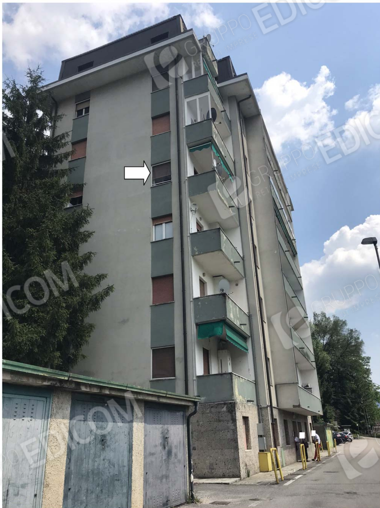
Foto 3 – Il complesso nel contesto e indicazione dell'unità in oggetto