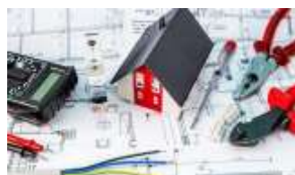
IMPIANTI ELETTRICI DI ULTIMA GENERAZIONE