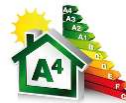
CLASSE ENERGETICA MINIMO A3