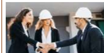
PERSONALIZZAZIONI RICHIESTE DAL CLIENTE