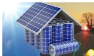
IMPIANTO FOTOVOLTAICO CENTRALIZZATO CONDOMINIALE