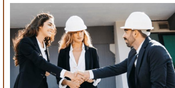
PERSONALIZZAZIONI RICHIESTE DAL CLIENTE