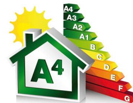
CLASSE ENERGETICA MINIMO A3