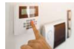
PORTONCINO BLINDATO, TAPPARELLE MOTORIZZATE, PREDISPOSIZIONE IMPIANTO DI SICUREZZA E DOMOTICA