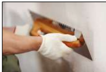
LAVORAZIONI, FINITURE E ZONE COMUNI ACCURATE