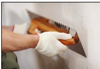
LAVORAZIONI E FINITURE ACCURATE