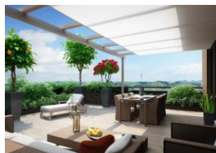
GIARDINI PRIVATI - TERRAZZE GOURMET