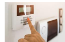
PORTONCINO BLINDATO, TAPPARELLE MOTORIZZATE, PREDISPOSIZIONE IMPIANTO DI SICUREZZA