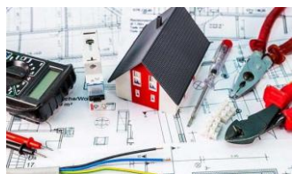
IMPIANTI ELETTRICI DI ULTIMA GENERAZIONE