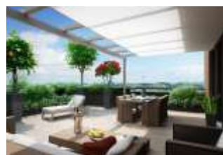
GIARDINI PRIVATI - TERRAZZE GOURMET