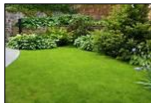
FINITURE ZONE COMUNI MOLTO CURATE

MATERIALI CERTIFICATI DI MARCHE RINNNOMATE SUL MERCATO