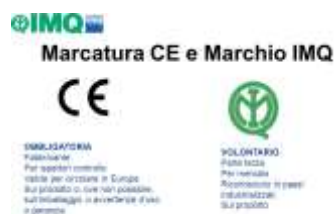
MATERIALI CERTIFICATI DI MARCHE RINNOMATE SUL MERCATO