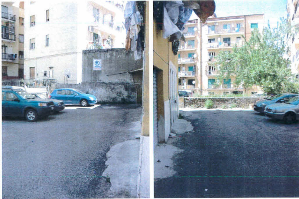
Cortile interno del fabbricato, foglio 12 p.la 236