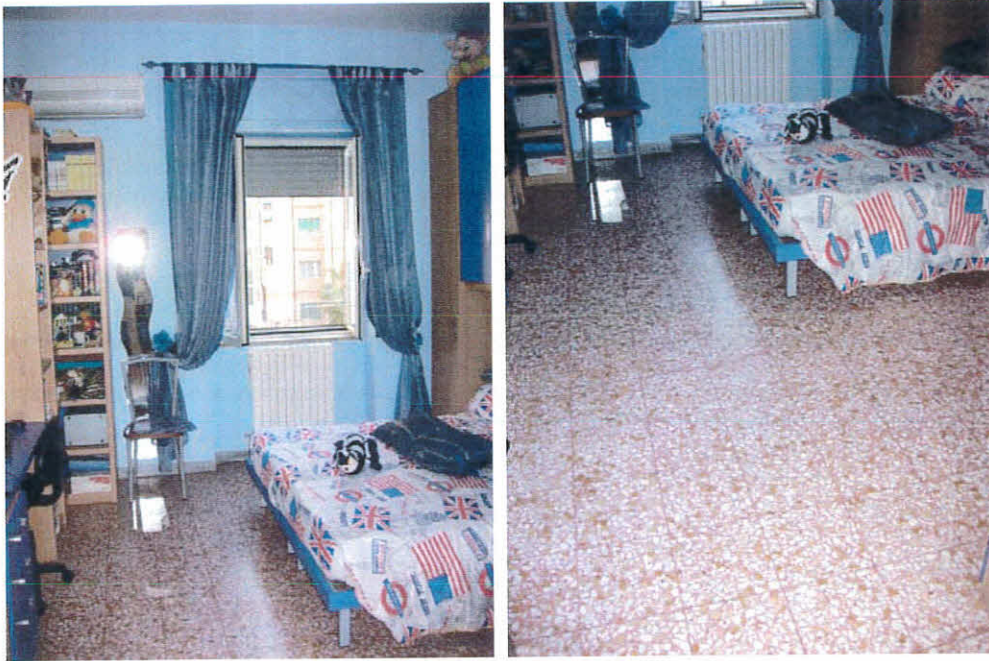
Camera da letto dell'immobile, foglio 12 p.la 236, sub 43