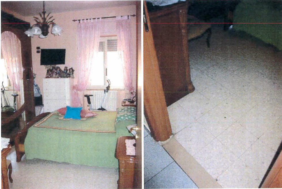
Camera da letto padronale dell'immobile, foglio 12 p.Ila 236, sub 43