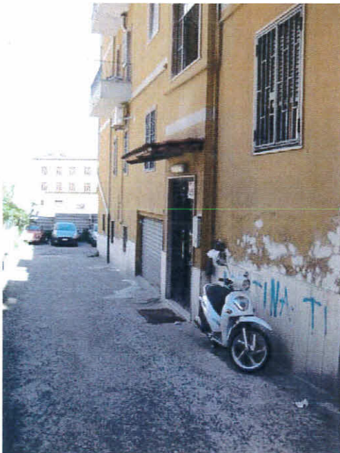
Portone del fabbricato, foglio 12 p.IIa 236