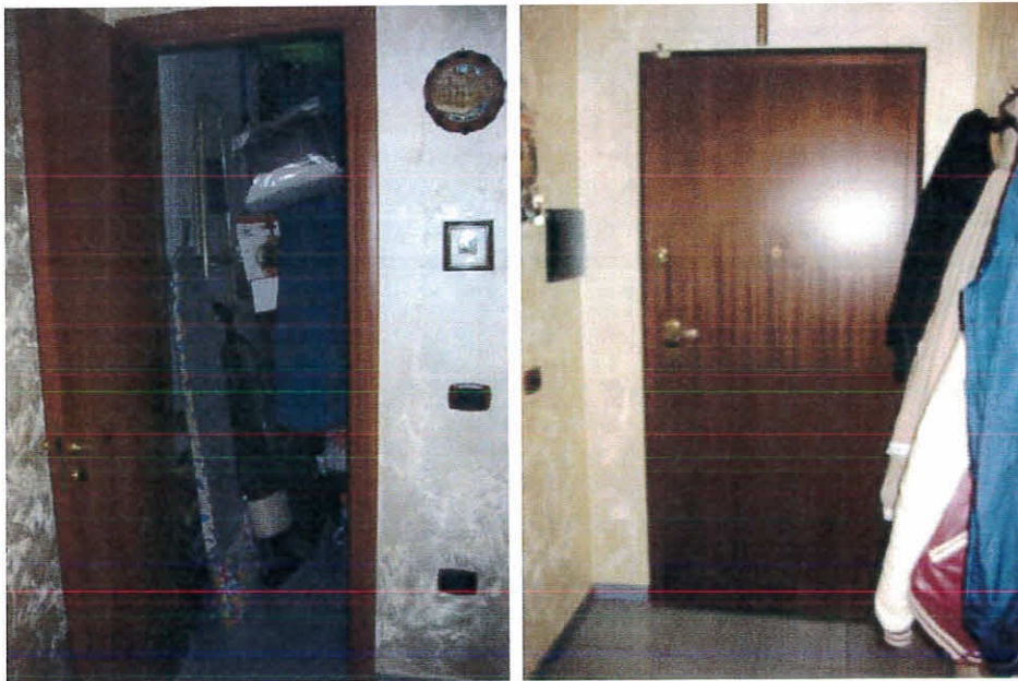
Ripostiglio e portone d'ingresso dell'immobile, foglio 12 p.Ila 236, sub 43