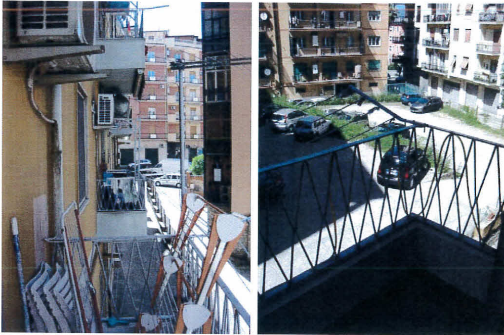
Balconi dell'immobile, foglio 12 p.la 236, sub 43