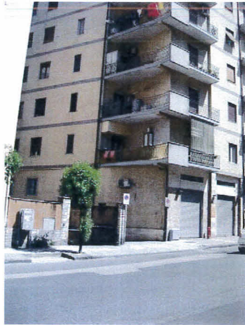
Accesso al fabbricato, foglio 12 p.IIa 236, da viale della Repubblica