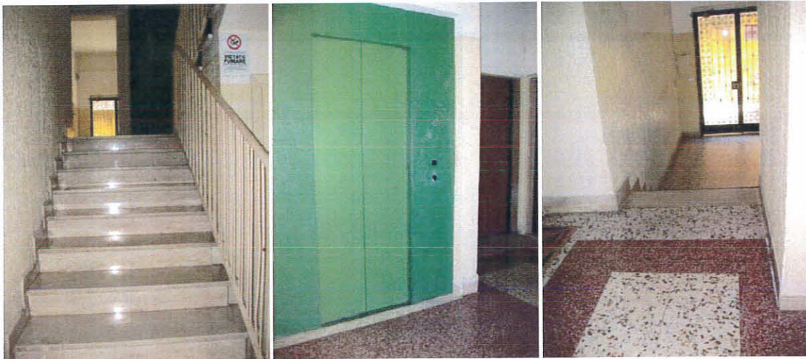
Interno portone e vano scala del fabbricato, foglio 12 p.la 236