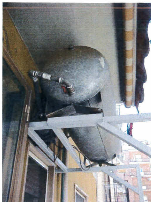
Caldaia e riserva idrica dell'immobile, foglio 12 p.Ila 236, sub 43