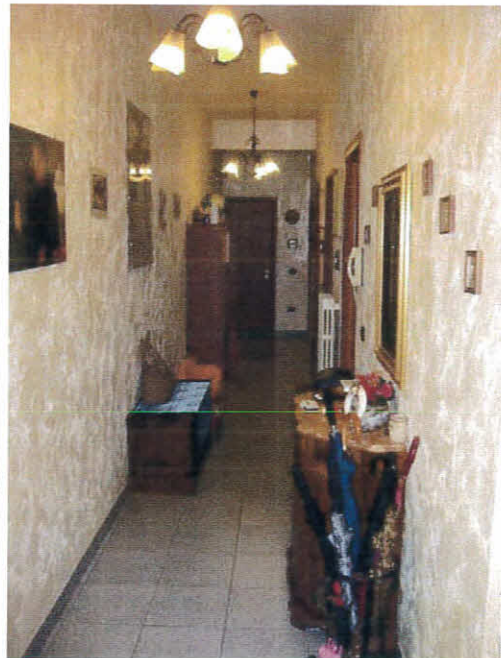
Sala da pranzo e corridoio dell'immobile, foglio 12 p.la 236, sub 43