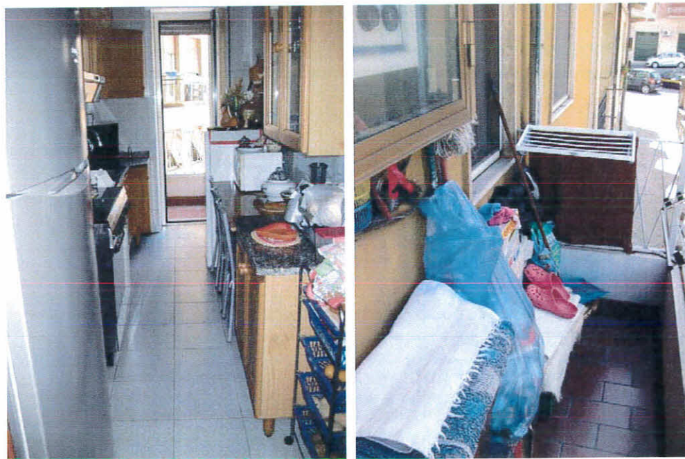
Cucina e balcone in corrispondenza. Rif. immobile, foglio 12 p.la 236, sub 43