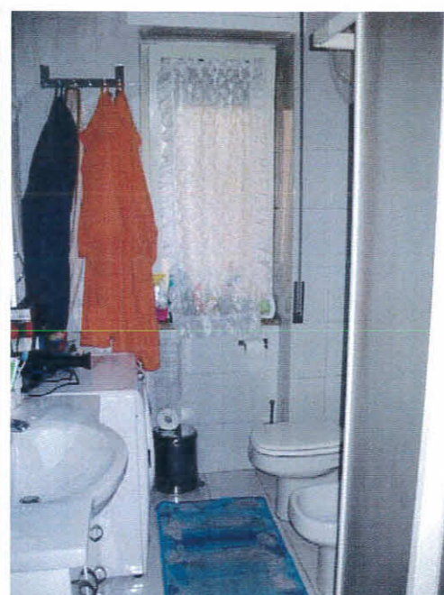
Bagno dell'immobile, foglio 12 p.Ila 236, sub 43