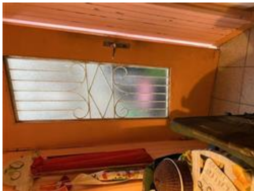
Porta cucina accesso su balcone