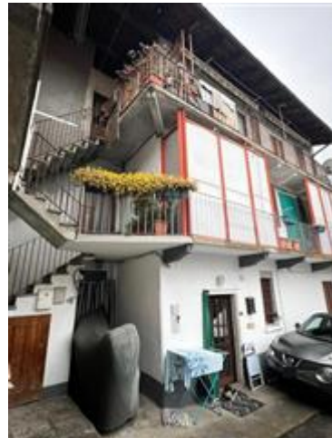
Foto facciata esterna su Via Cadorna