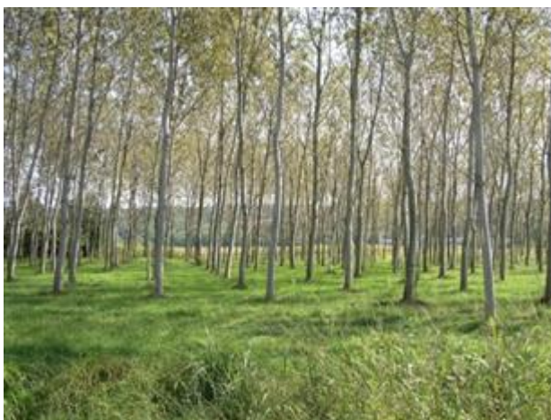
Piana di Montonate