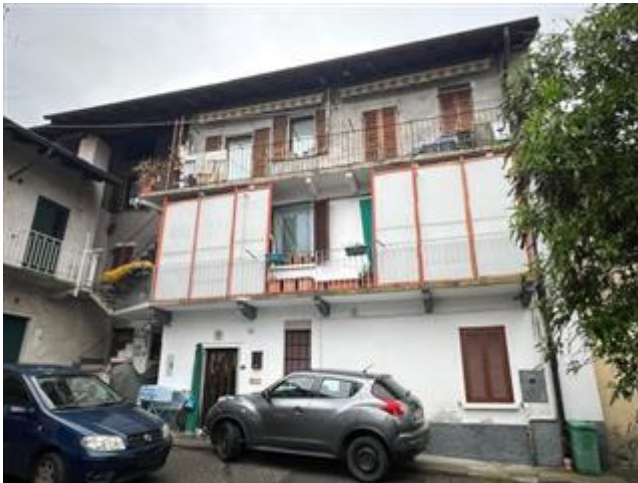
Foto facciata esterna su Via Cadorna

L'intero edificio sviluppa 3 piani, 3 piani fuori terra, 0 piano interrato.