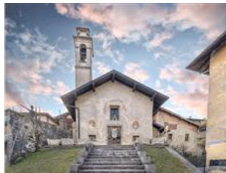
Oratorio di San Clemente