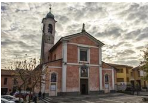
Chiesa di San Michele Arcangelo

I beni sono ubicati in zona centrale (centro storico) in un'area residenziale, le zone limitrofe si trovano in un'area residenziale (i più importanti centri limitrofi sono Vergiate, Besnate, Albizzate). Il traffico nella zona è locale, i parcheggi sono inesistenti. Sono inoltre presenti i servizi di urbanizzazione primaria e secondaria, le seguenti attrazioni storico paesaggistiche: Chiesa di San Michele Arcangelo, Oratorio di San Clemente, Torre Romana di Montonate, Piana di Montonate.