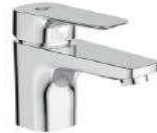
IDEAL STANDARD - serie CERAPLAN3 miscelatore lavabo finitura cromo