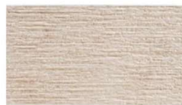
At. Rlv. Choice Sand ● 30,3x61,3 M41 015.722.0119.04372