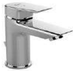
IDEAL STANDARD - serie CERAMIX miscelatore lavabo finitura cromo