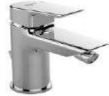
IDEAL STANDARD - serie CERAMIX miscelatore bidet finitura cromo