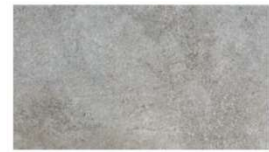
At. Choice Zircon PEI 4 ● 30,3x61,3 M41 015.722.0139.04333 ● 45x45 M37 015.340.0139.04333