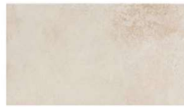
At. Choice Sand PEI 4 ● 30,3x61,3 M41 015.722.0119.04333 ● 45x45 M37 015.340.0119.04333