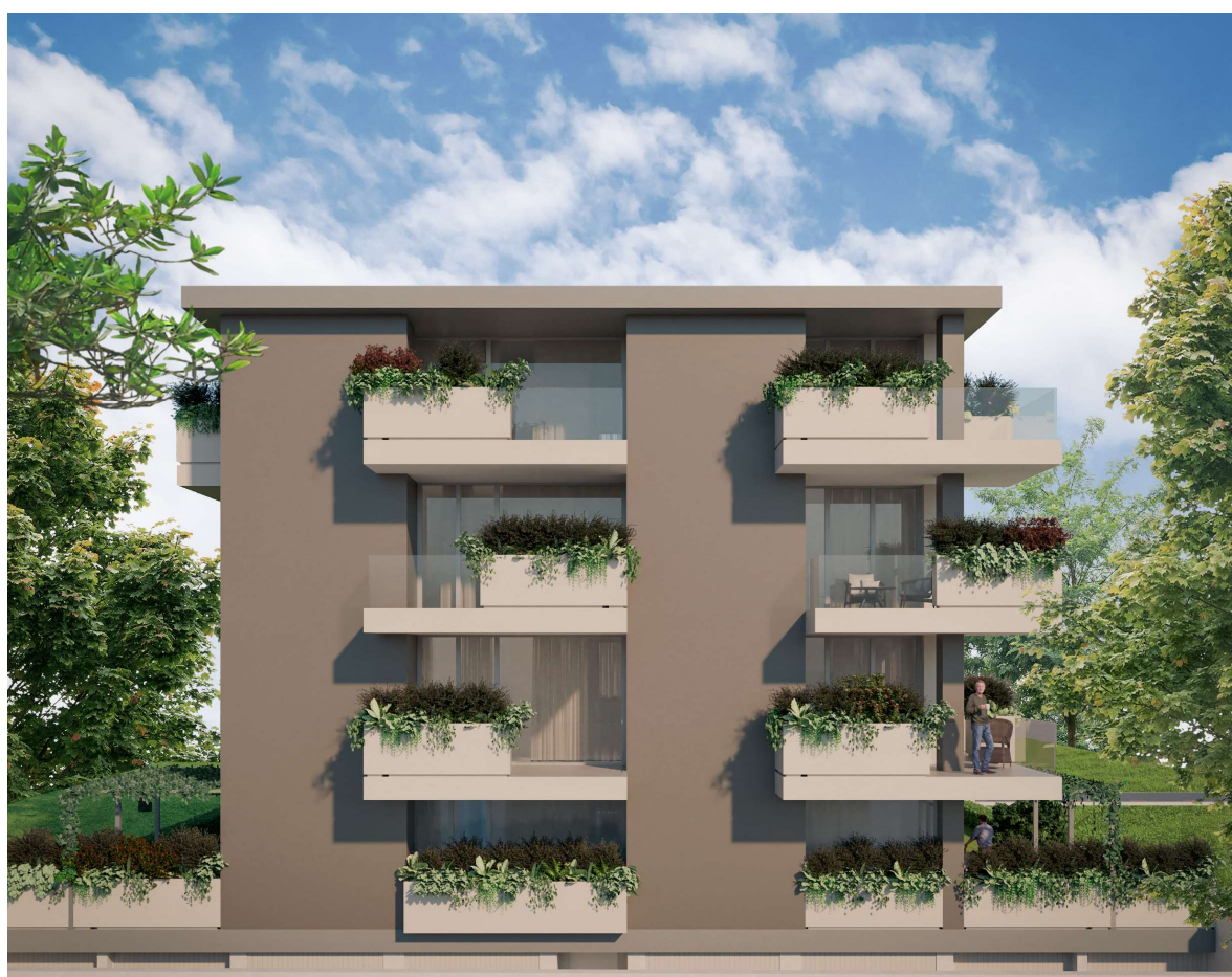
PALAZZINA RESIDENZIALE 10 ALLOGGI IN MONTICELLI TERME

REALIZZATO DA SER.CA.L COSTRUZIONI S.R.L.