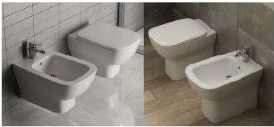
IDEAL STANDARD - serie ESEDRA