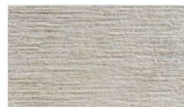
At. Rlv. Choice Ash ● 30,3x61,3 M41 015.722.0344.04372