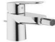
GROHE - serie BAUEDGE miscelatore bidet finitura cromo