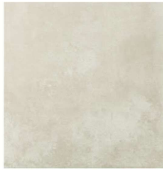
At. Kiel Perla PEI 4 ● 60,8x60,8 M41 15.440.0037.04075