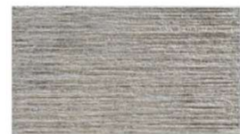
At. Rlv. Choice Zircon ● 30,3x61,3 M41 015.722.0139.04372

La zona a copertura delle autorimesse esterne sarà pavimentata in gres-ceramico antigelivo e antisdrucciolo o in elementi cementizi prefabbricati a scelta della D.L.