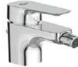
IDEAL STANDARD - serie CERAPLAN3 miscelatore bidet finitura cromo