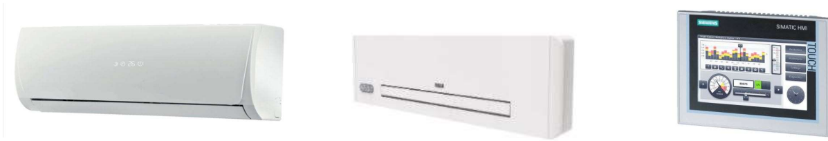
SPLIT DEUMIDIFICATORI- CALDO E FREDDO

Lo schema del riscaldamento, prevede un collettore con elettrovalvole, comandate dai termostati ambiente che ne regolano il flusso, mantenendo la temperatura impostata per ogni locale.