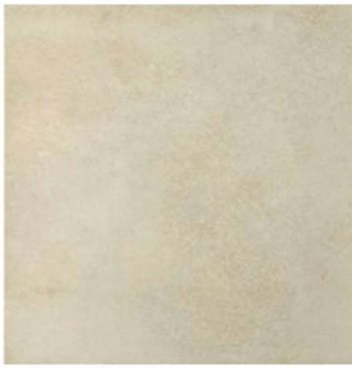
At. Kiel Arena PEI 4 ● 60,8x60,8 M41 15.440.0017.04075