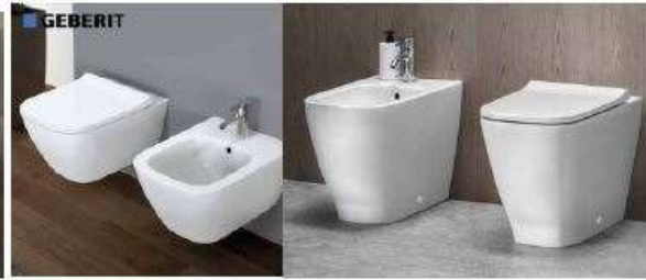
GEBERIT - serie SMYLE