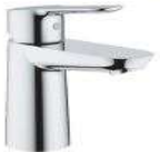
GROHE - serie BAUEDGE miscelatore lavabo finitura cromo