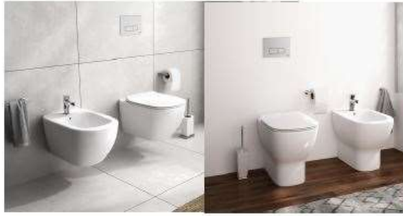
IDEAL STANDARD serie TESI