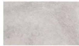
At. Choice Ash PEI 4 ● 30,3x61,3 M41 015.722.0344.04333 ● 45x45 M37 015.340.0344.04333