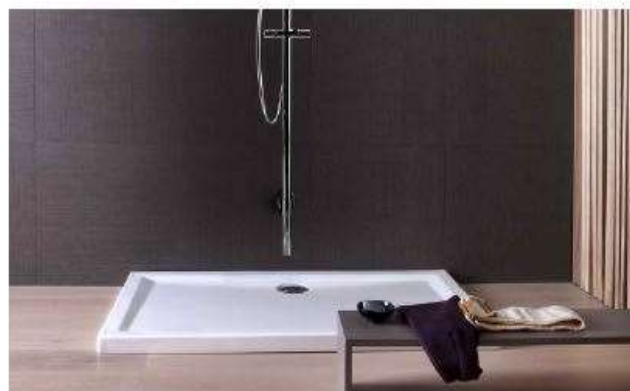
GROHE - serie 60 piatta doccia in ceramica con superficie antiscivolo altezza 60mm dimensioni 90x90 cm - 100x80 cm