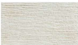
At. Rlv. Choice Light ● 30,3x61,3 M41 015.722.0204.04372