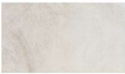
At. Choice Light PEI 4 ● 30,3x61,3 M41 015.722.0204.04333 ● 45x45 M37 015.340.0204.04333