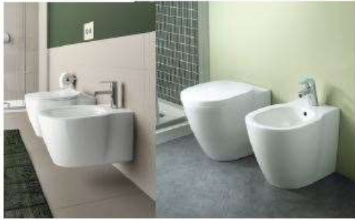
IDEAL STANDARD serie CONNECT