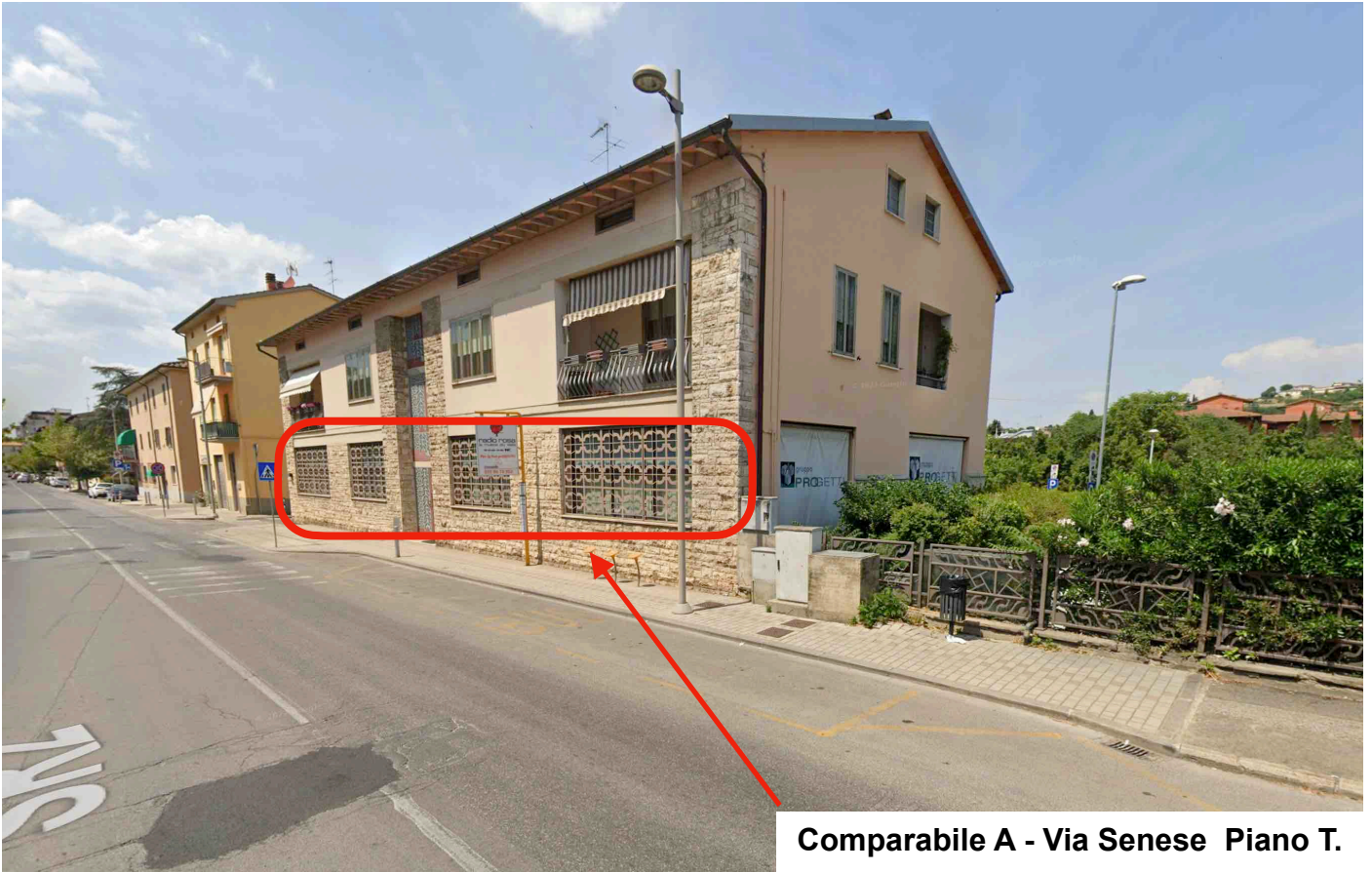
Comparabile A - Via Senese Piano T.