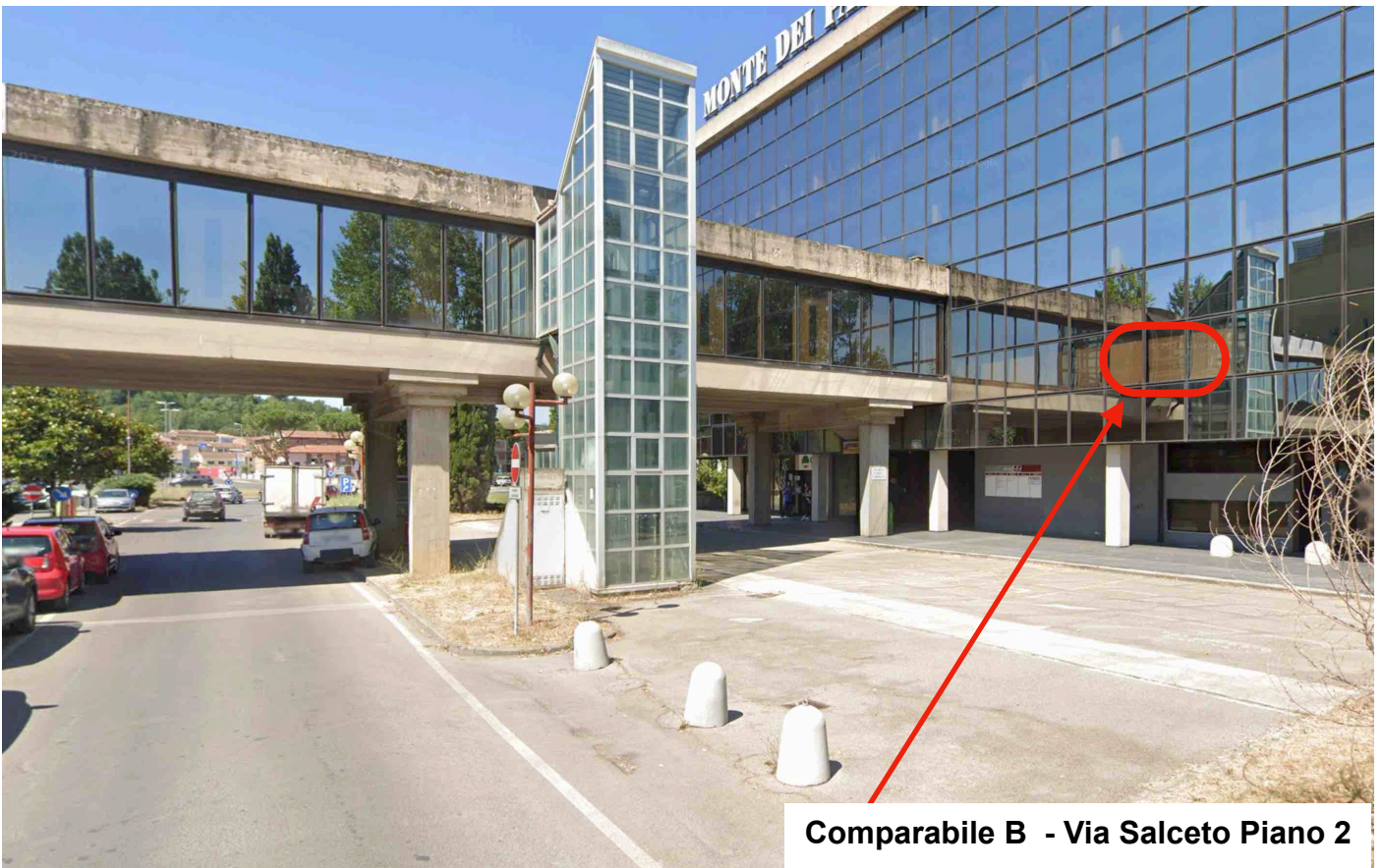
Comparabile B - Via Salceto Piano 2