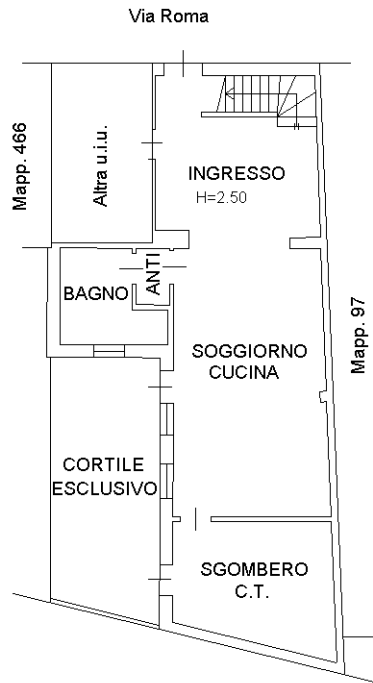
PIANO TERRA H=2.70