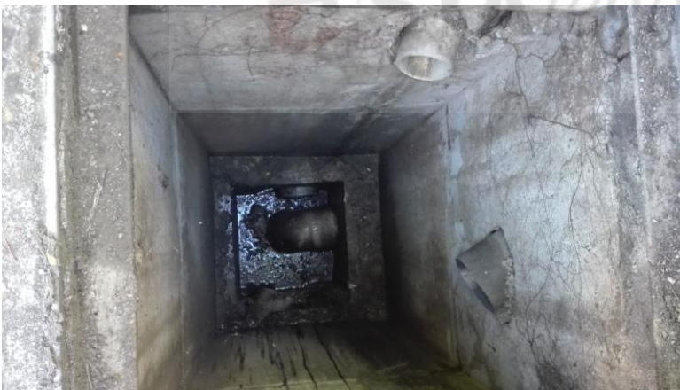
Pozzetto di ispezione

Risultano pertanto già divisi gli impianti fognari.