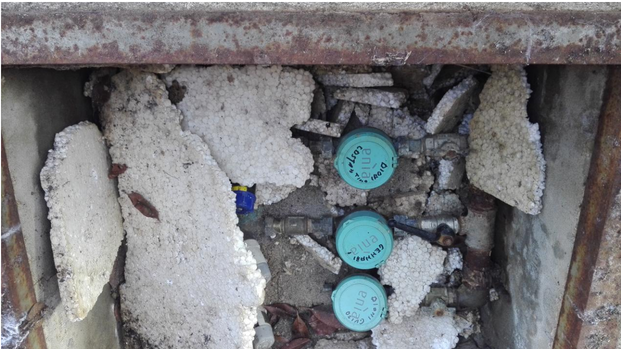
Tre contatori acqua