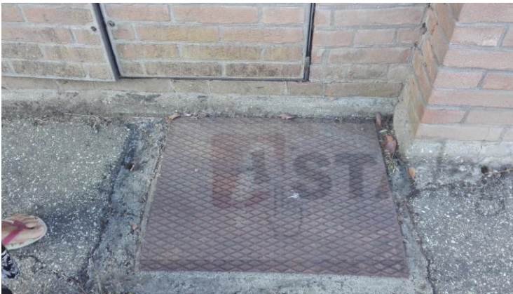
Contatori gas a muro e acqua su via Crocetta