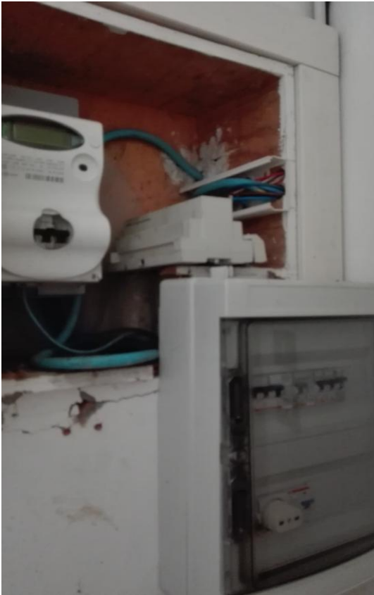
Contatore da spostare