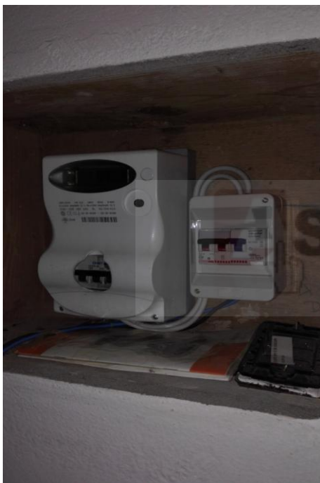
Contatore parte [REDACTED]