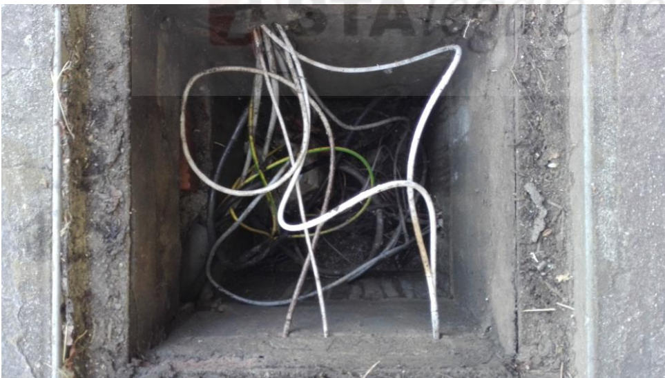
Pozzetto nel cortile ispezionabile