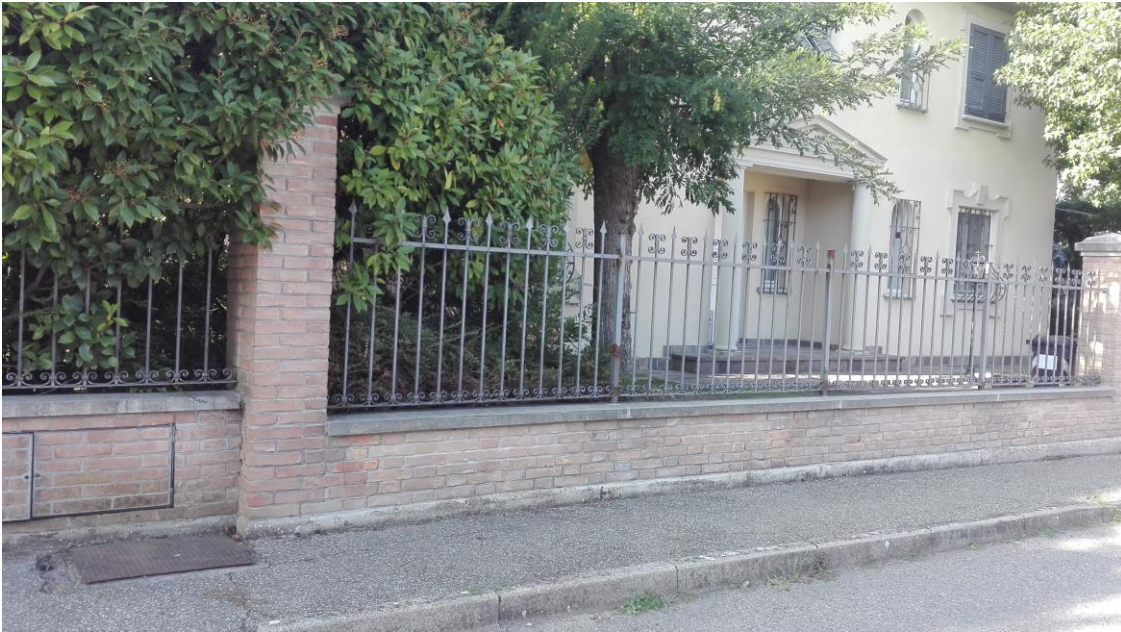
Pozzetto con contatori in via Crocetta