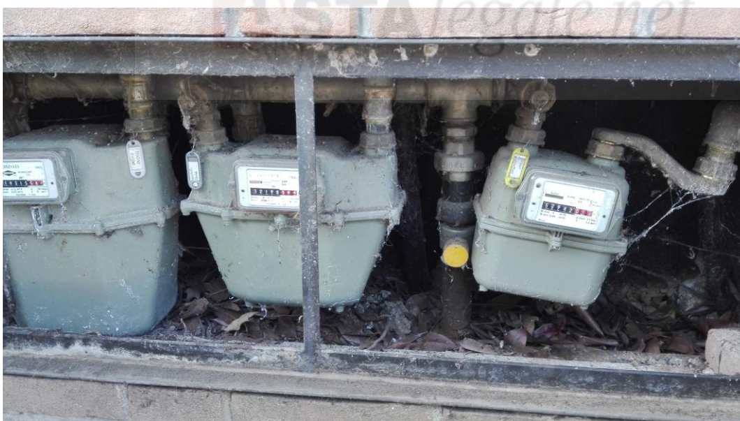
Contatori gas con i rispettivi nominativi

Sono esistenti 3 caldaie di cui 2 a servizio parte [REDACTED] localizzate nella parte [REDACTED] in taverna e una caldaia già esistente nella parte [REDACTED] al primo piano locale ripostiglio.