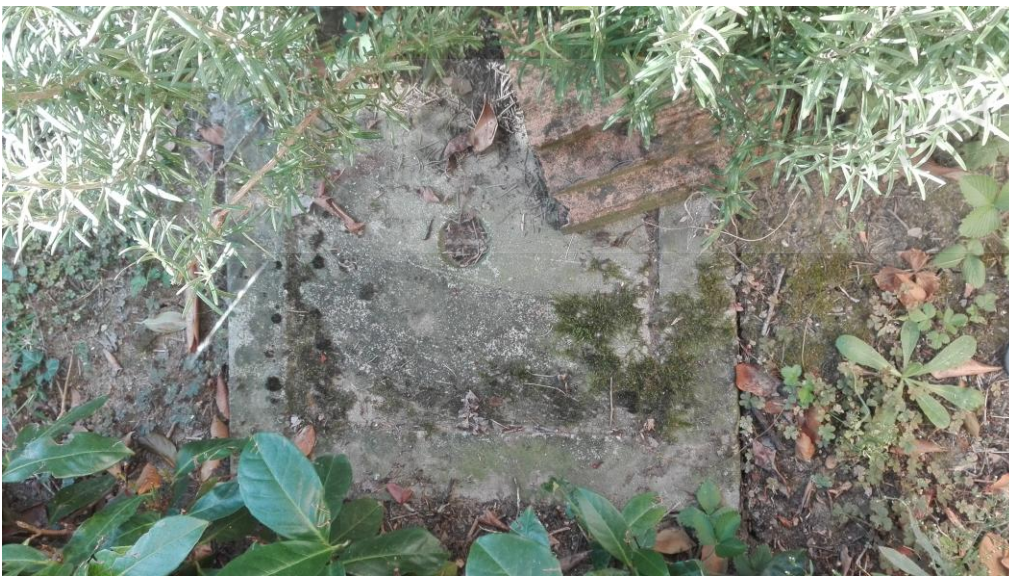
fossa biologica [REDACTED]

Per quanto riguarda l'altra unità immobiliare, presenta una fossa biologica in cemento, che non siamo riusciti ad aprire, in prossimità di un bagno sulla proprietà [REDACTED]