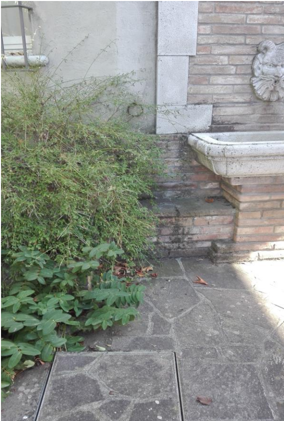
Pozzetto di ispezione