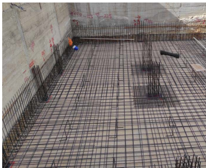
Figura 1 - Esempio strutture in elevazione

Ci si riserva di modificare gli elementi costruttivi con altri ritenuti più idonei dal Tecnico Calcolatore e dai dati risultanti dal calcolo strutturale.