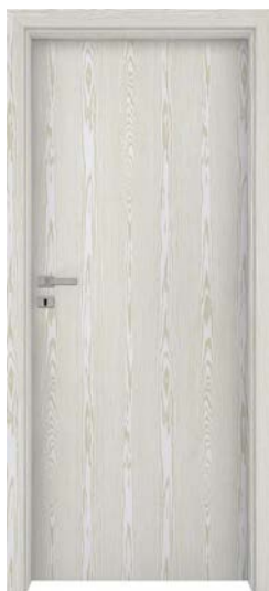
Figura 11 - Esempio tipologia porte interne

Tutte le porte interne dei singoli appartamenti saranno del tipo a battente e/o a scomparsa in laminato bianco no laccate, complete di maniglie di ottone e/o cromate con serratura, con placca e contro placca. Il numero e la tipologia delle porte verranno indicato nella planimetria allegata al compromesso di vendita.