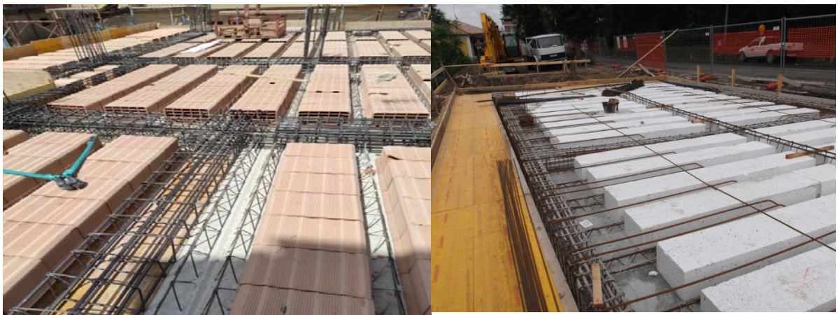
Figura 3 - Esempio struttura solai

Ci si riserva di modificare gli elementi costruttivi con altri ritenuti più idonei dal progettista e direzione lavori.