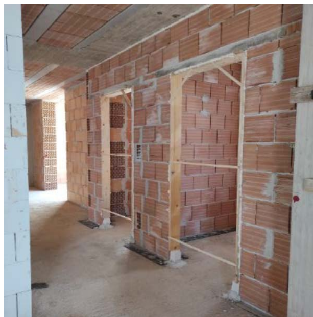
Figura 4 - Esempio tramezzature interne

Le scale saranno delimitate da murature in cemento armato.