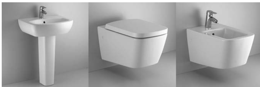
Figura 16 - IDEAL STANDARD – SANITARI SERIE MIA