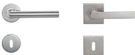
Figura 12 - Esempio maniglia in acciaio porte interne