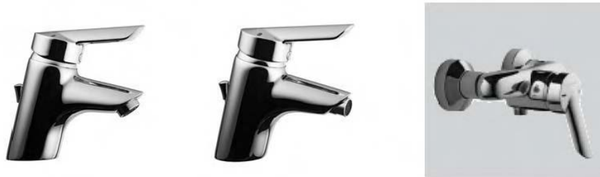
Figura 17 - RUBINETTERIA – SERIE FORUM