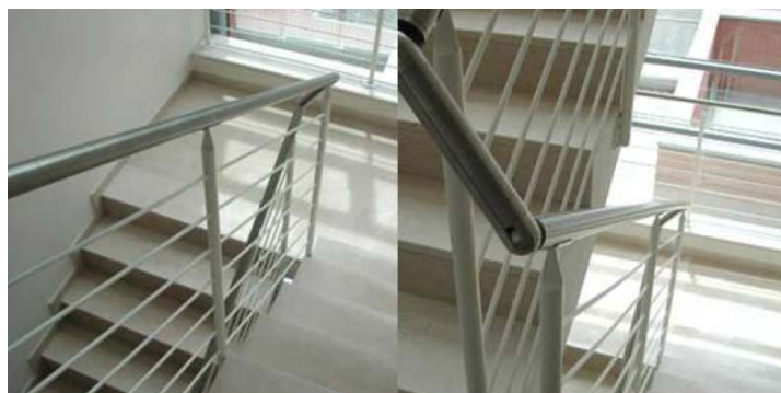
Figura 8 - Esempio corrimano vani scala

Tutte le ringhiere delle scale, saranno dotate di corrimano in ferro.