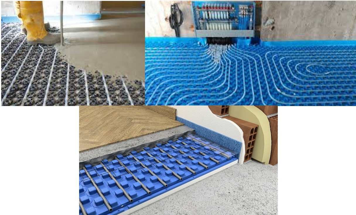
Figura 13 - Esempio applicazione sistema riscaldamento radiante