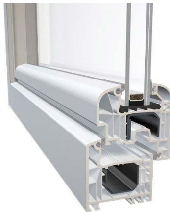
Figura 10 - Esempio tipologia infissi esterni

Le ante a battente delle porte avranno la chiusura con bacchette a cariglione comandate a perfetta tenuta, cerniere, squadrette, viterie, etc. I telai fissi in lamiera saranno dotati di guide per le persiane avvolgibili. I battenti dovranno accogliere i vetri del tipo da infilare da applicarsi con sigillatura esterna. Il tutto fornito e posato a perfetta regola d'arte per evitare possibili infiltrazioni di acqua.