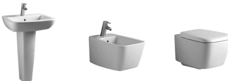
Figura 14 - IDEAL STANDARD – SANITARI SERIE 21