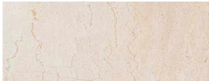
Figura 6 - Esempio tipologia Pietra di Trani

Per la posa di tutte le soglie interne e davanzali finestre di ciascun appartamento, si predispone il marmo pietra di Trani: