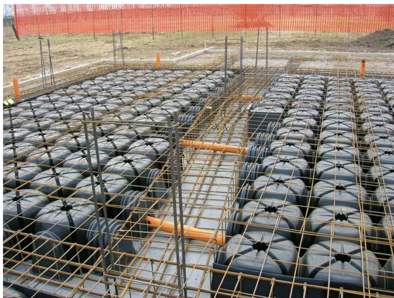
Figura 2 - Esempio di vespaio areato

All'interno dei vani di fondazione verrà realizzato il vespaio areato con sistema a doppio solaio, o con la collocazione degli Igloo e massetto in calcestruzzo. Per l'areazione del vespaio saranno realizzati dei fori del diametro di 100 mm sulle murature perimetrali, completi di tubazioni di collegamento in PVC e griglie esterne con rete anti-insetti. Il vespaio areato evita il contatto diretto dell'immobile con il terreno, quindi consente di mantenere asciutti gli ambienti e con la giusta umidità, contribuendo all'isolamento termico dell'intera struttura.