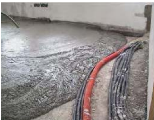
Figura 5 - Esempio posa di massetto

E' previsto un massetto in sabbia-cemento additivato a copertura delle tubazioni di riscaldamento, lisciato per la posa dei pavimenti.