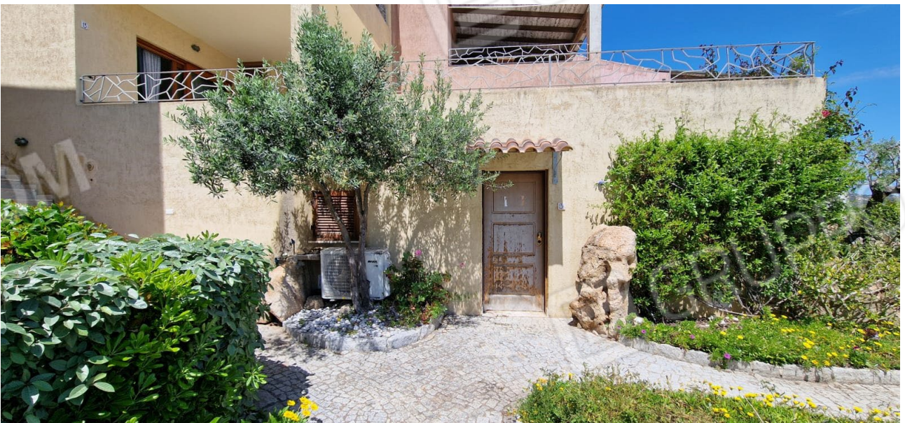
Fig. 7 – immagine dell'ingresso all'appartamento – vialetto e verde condominiale