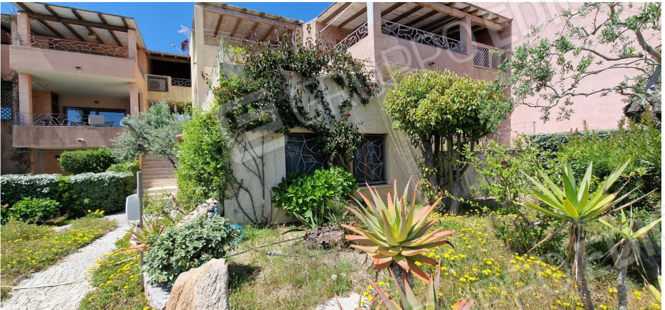
Fig. 6 – immagine del prospetto sud/est dell'appartamento