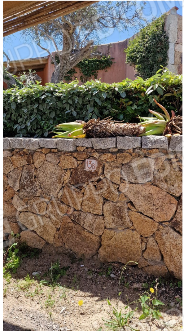
Fig. 3/4– immagine dell'ingresso e il parcheggio n. 13/b con pergola di proprietà