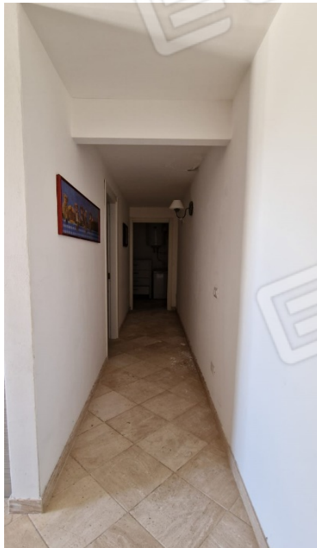
Fig. 9 – disimpegno d'ingresso (vista dal soggiorno verso la zona notte)