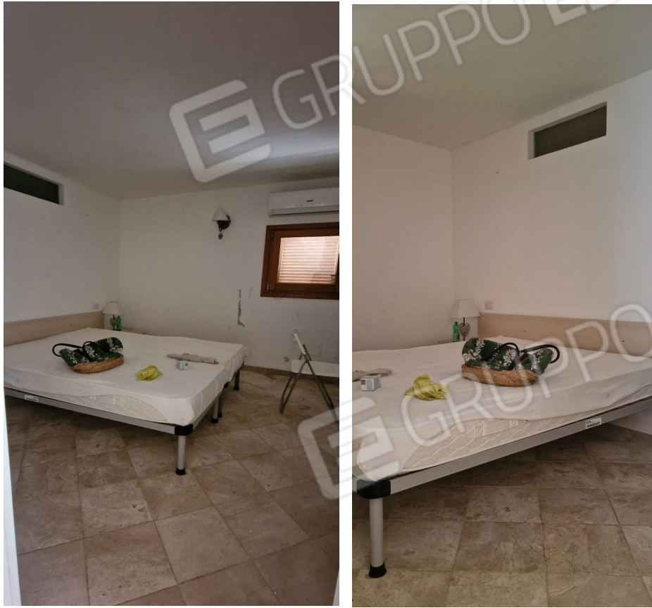
Fig. 10 – camera da letto doppia