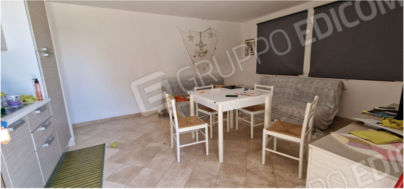
Fig. 8 – soggiorno pranzo con angolo cottura – visto dall'ingresso