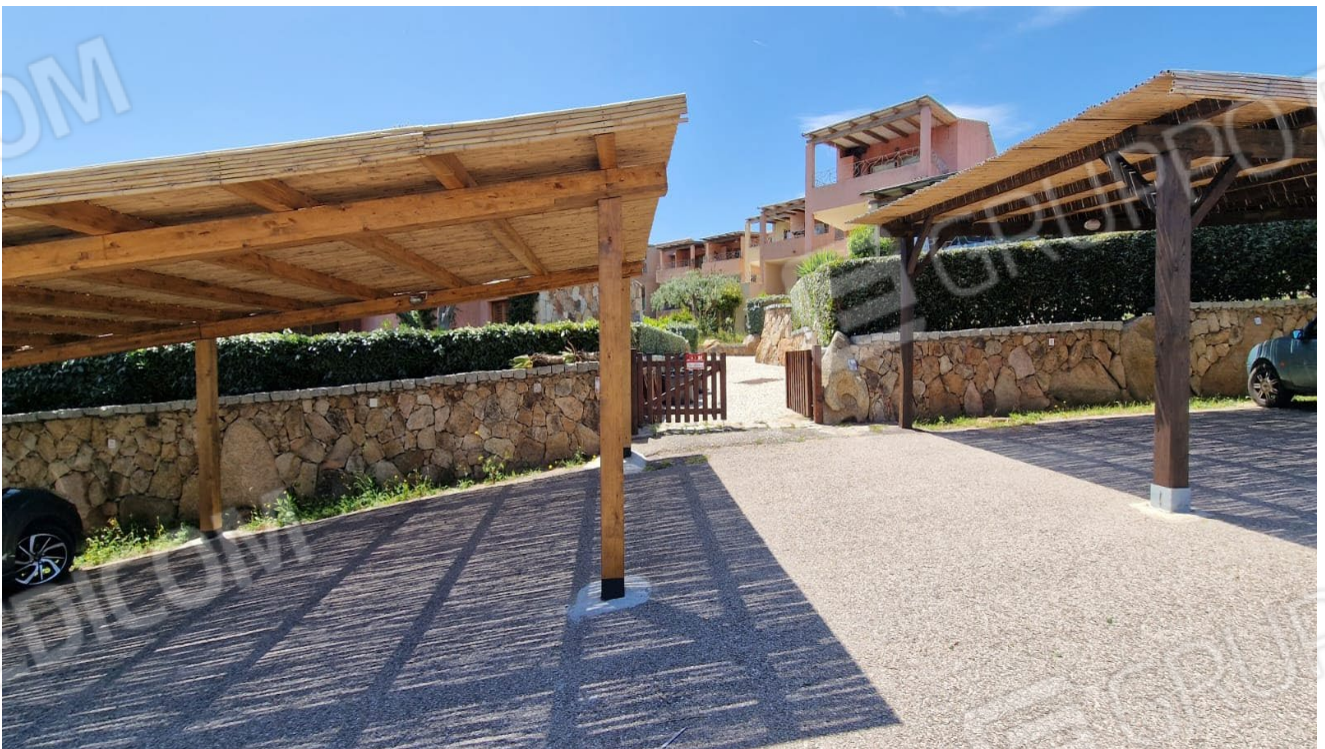
Fig. 2 – immagine dell'ingresso al complesso condominiale “Il Fiordo”