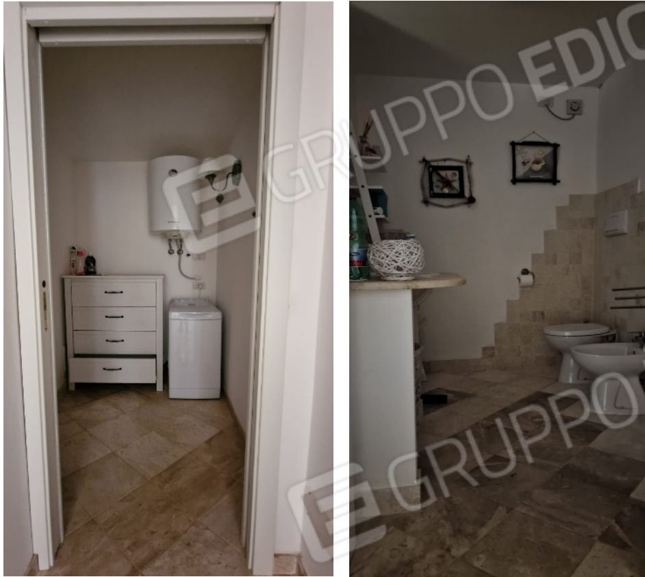
Fig. 11/12 – accesso all’antibagno – bagno