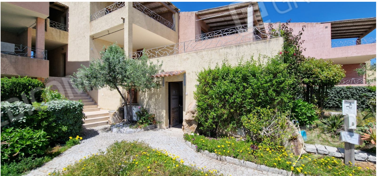
Fig. 5 – immagine del prospetto sud dell'appartamento