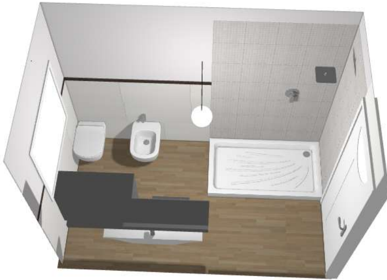
Bagno tipo 1