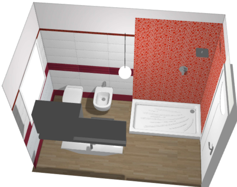
Bagno tipo 2