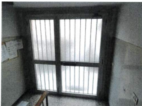
Vista atrio ingresso