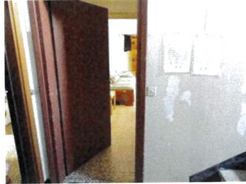
Vista porta ingresso appartamento