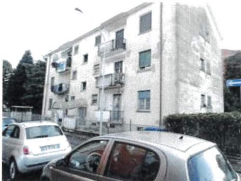
Vista fabbricato facciata principale da via Sant'Ambrogio

L'intero edificio sviluppa 4 piani, 3 piani fuori terra, 1 piano interrato. Immobile costruito nel 1950.