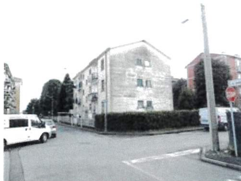
Vista fabbricato facciata laterale da via Sant'Ambrogio