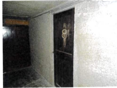
Vista porta ingresso cantina