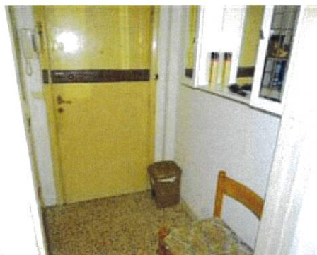
Vista ingresso appartamento