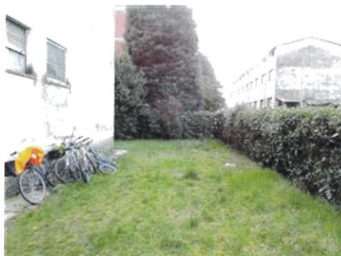
Vista area verde