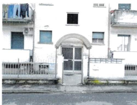
Vista ingresso condominio da via Sant'Ambrogio