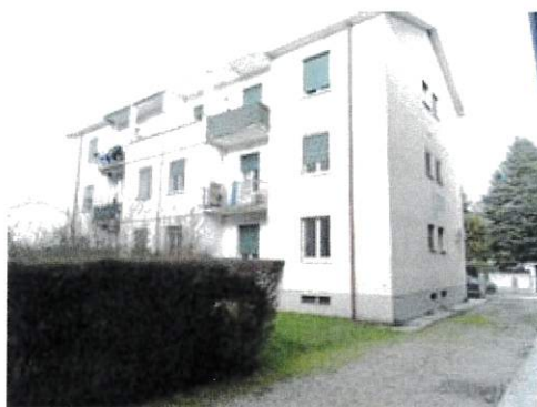
Vista fabbricato facciata laterale e anteriore dal cortile interno