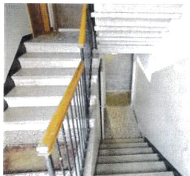
Vista scala interna e ingresso cantina