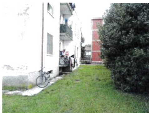
Vista area verde