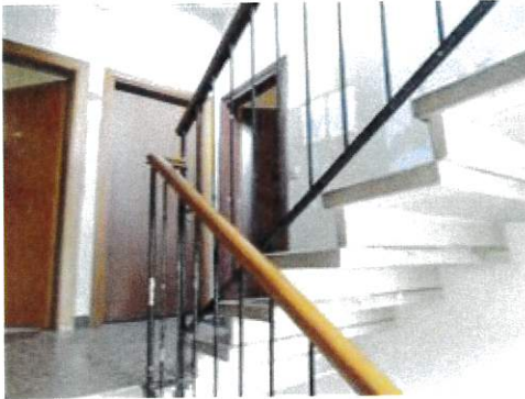
Vista scala interna e porta ingresso appartamento