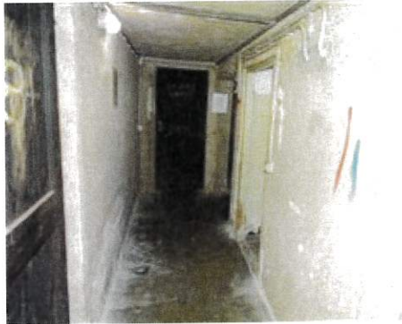
Vista corridoio cantina