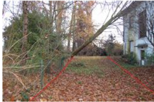
area al mappale 3164 non soggetto ad esecuzione