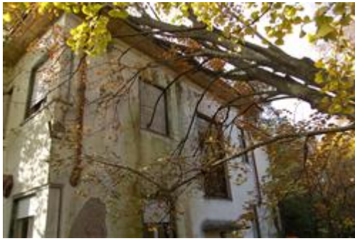
prospetto retro - nord/est