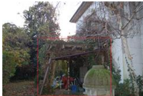
portico in legno