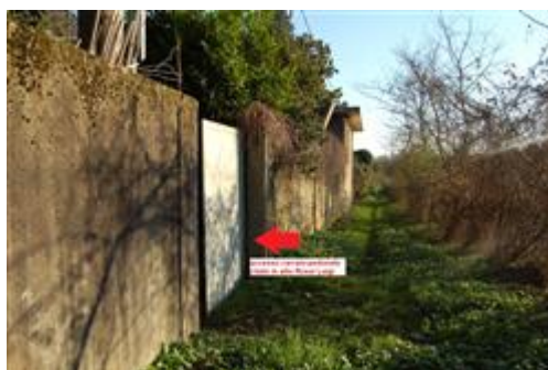
area interclusa angolo sud-ovest solo per manutenzione muri di fabbrica