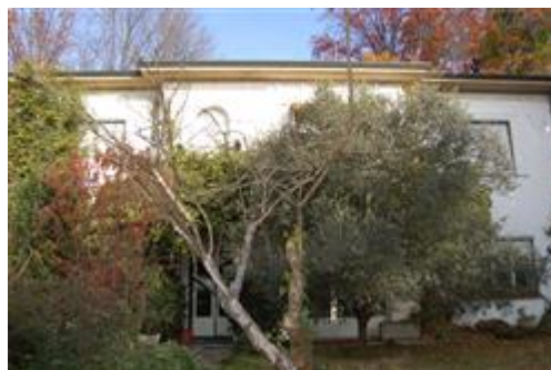
prospetto principale - sud/est