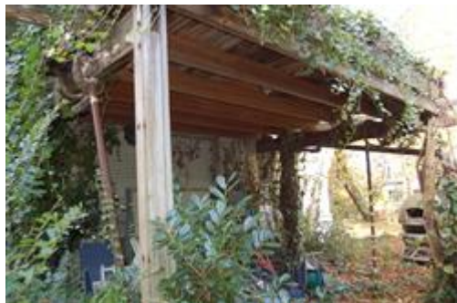
villa lato est - portico in legno