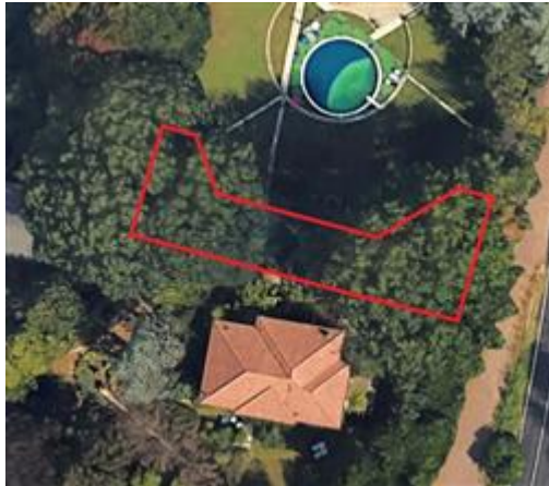
posizione mappale 4819

Il terreno presenta , un'orografia pianeggiante, i seguenti sistemi irrigui: nessuno, sono state rilevate le seguenti colture arboree: alberi da fogliame ,