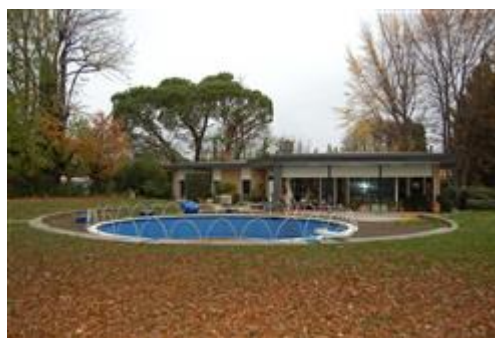
prospetto sud - zona giorno