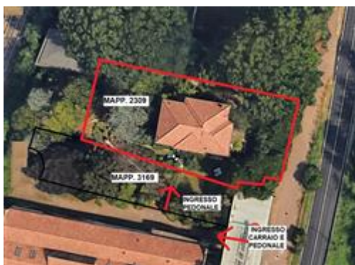
ingresso pedonale sul mappale 3169 - non sottoposto a pignoramento

L'intero edificio sviluppa 3 piani, 2 piani fuori terra, 1 piano interrato. Immobile costruito nel 1950.