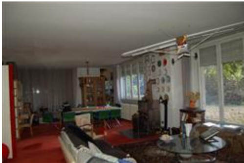
Soggiorno - pranzo

PIANO PRIMO: ampio disimpegno, n. 4 camere, n. 2 bagni, locale guardaroba, 4 balconi.