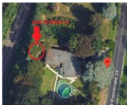
posizione box seminterrati