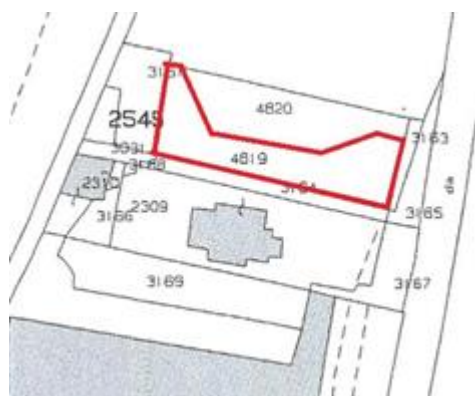
stralcio mappa catastale