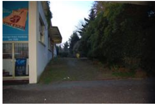
servitù sul corsello e viale interno - di proprietà di Terzi al mappale 469