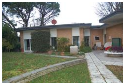
prospetto sud - zona notte