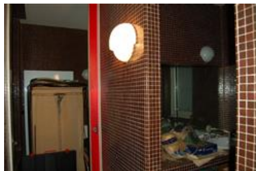
antibagno - bagno 1°P