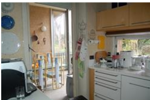
cucina - veranda