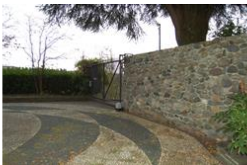
ingresso pedonale e carroia