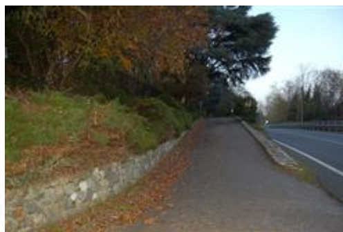
viale accesso pedonale e carroia da via Mazzini