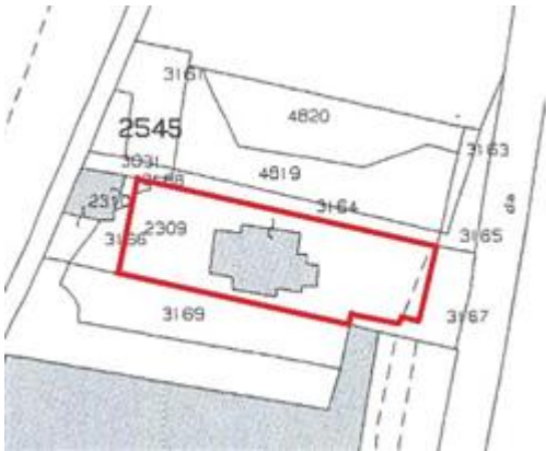
stralcio mappa - villa con portico