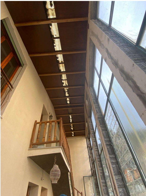
Vano veranda di accesso