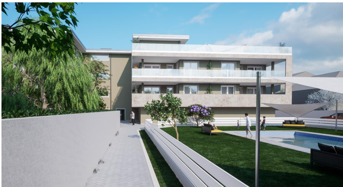
Vista. Rappresentazione grafica è puramente indicativa e non costituisce elemento contrattuale.

Il nuovo complesso residenziale “Il Fontanile” si inserisce nel tessuto urbanizzato di recente espansione del comune di Sedriano, paese situato ad ovest dell’area metropolitana di Milano. Il paese di Sedriano si colloca in una posizione strategica rispetto ai collegamenti infrastrutturali del territorio. Infatti, è ben collegata con Milano attraverso la poco distante stazione ferroviaria di Vittuone e attraverso i collegamenti pubblici lungo la via Novara e del centro paese. Nelle vicinanze si trova l’ingresso Mesero-Arluno dell’autostrada A4.