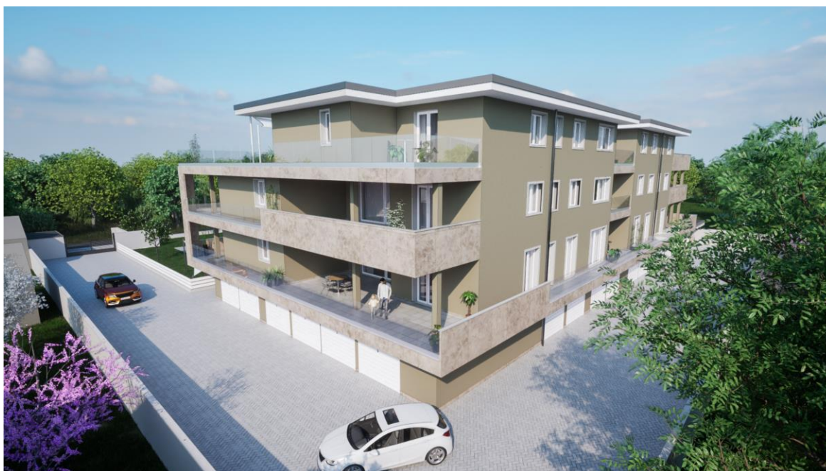
Vista dell'intervento. Rappresentazione grafica è puramente indicativa e non costituisce elemento contrattuale.

Il Fontanile si trova in una posizione riservata e appartata, arretrata rispetto al filo stradale. Questo accorgimento ha consentito al progettista di creare un'ampia zona verde riservata ai condomini con un giardino, solarium e piscina.