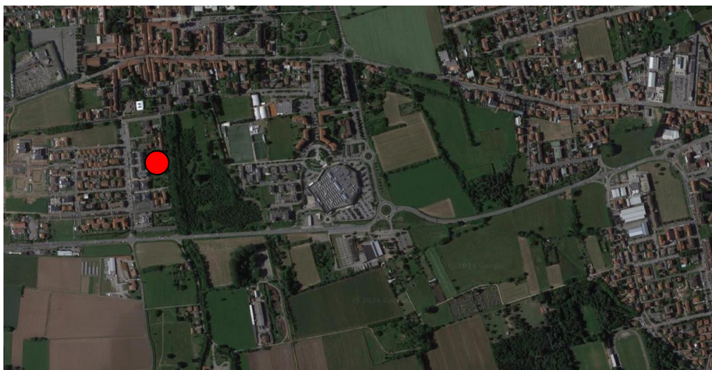
Vista dell’intervento dall’ingresso pedonale su via Leonardo da Vinci

Inoltre l’intorno offre molti spazi verdi, prati coltivati e boschi. Senza dimenticare le numerose cascate dei dintorni e i percorsi ciclopeditoni che si snodano fra i campi.