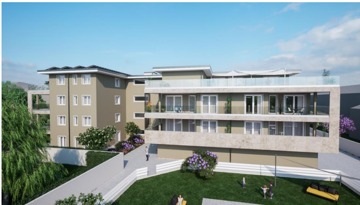
Vista dell'intervento. Rappresentazione grafica è puramente indicativa e non costituisce elemento contrattuale.

Nella palazzina trovano comodamente posto 16 appartamenti disposti su tre piani dal primo al terzo. Al piano terra si trovano box e cantine oltre al giardino condominiale con i suoi servizi.