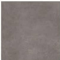
Type GC 04