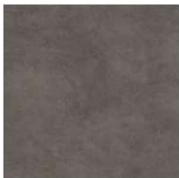
Toffee GC 09