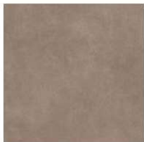
Chamois GC 08