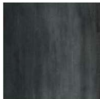
Iron GC 20