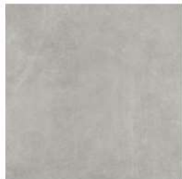
Perfect GC 02