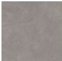
Ideal GC 03