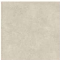
Ginger GC 10