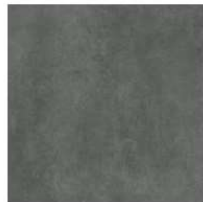
Classic GC 05