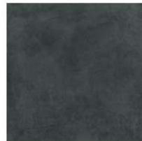
Absolute GC 06