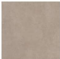
Sugar GC 07