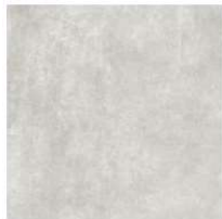
Clear GC 01