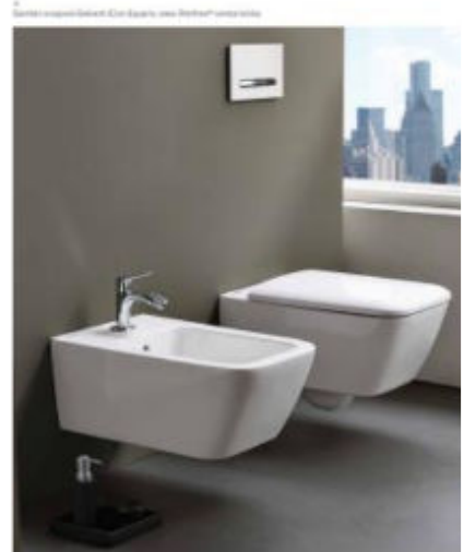
SANTARI GEBERIT SERIE 'iCon Square'

GEOMETRIA PERFETTA I sanitari Geberit iCon Square, caratterizzati da forme squadrato, sono disponibili sia in versione sospeso che a pavimento. Doppia possibilità di scelta a seconda delle preferenze e necessità progettuali.