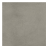
Atlas Factor Volcano