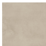
Atlas Factor Desert