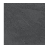
Atlas Impact Grafite