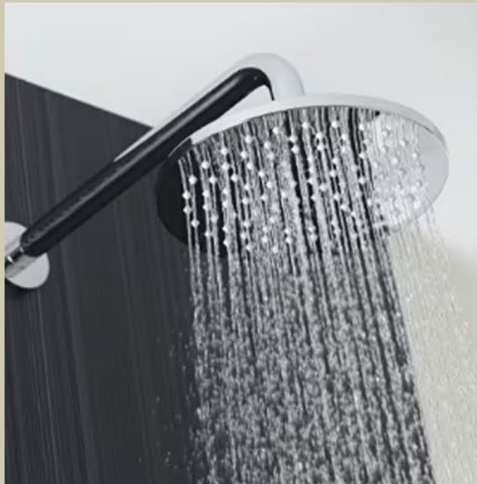
SOFFIONE E DOCCINO: HUDSON (SOFFIONE DIAMETRO 20 CM)