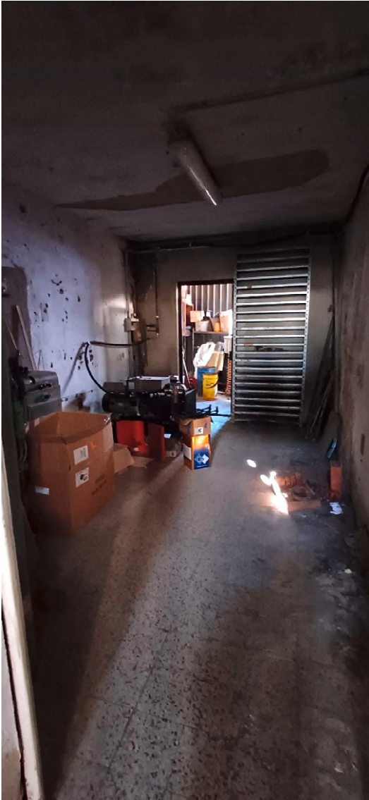
Fotografia 6 vista deposito interno