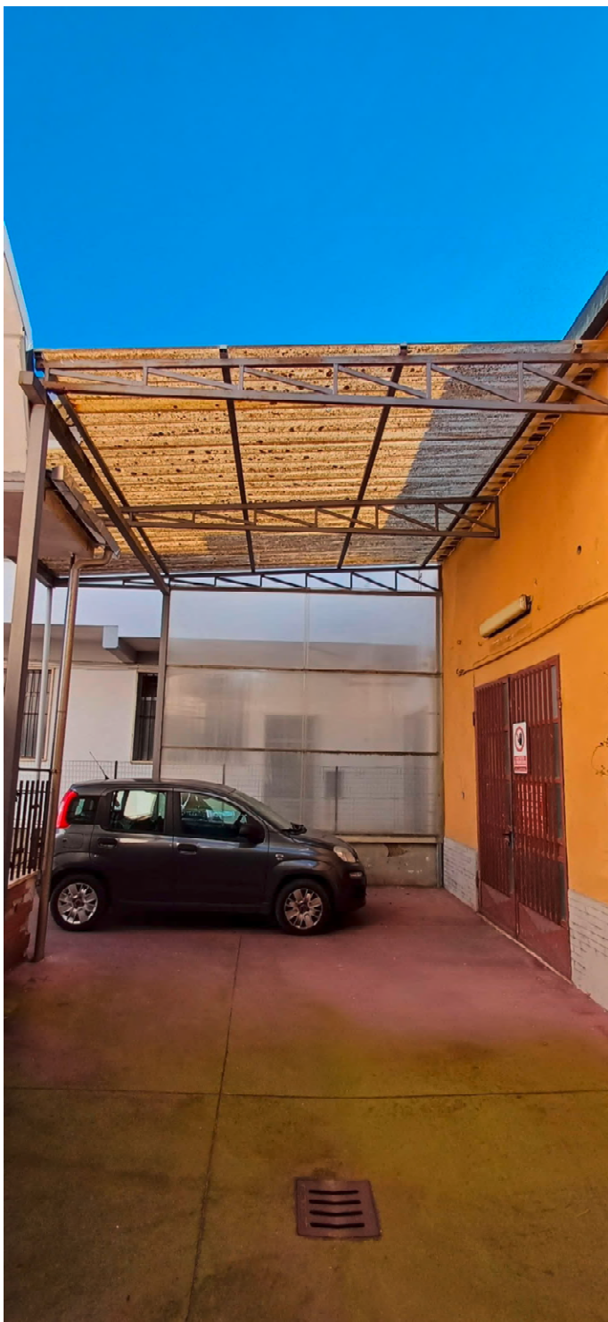
Fotografia 10 vista cortile a comune con civile abitazione