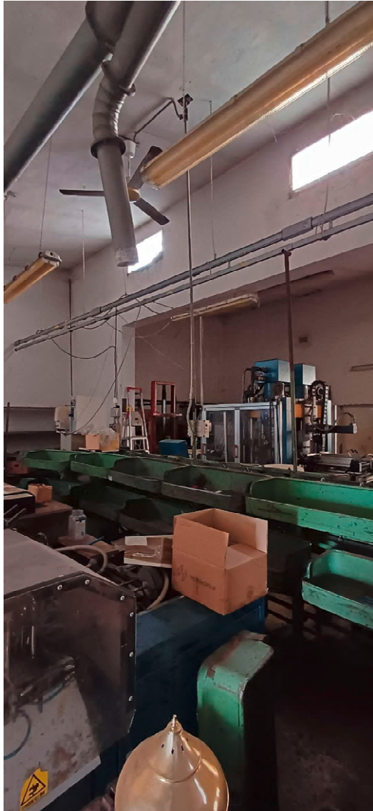
Fotografia nr 2 vista interna laboratorio