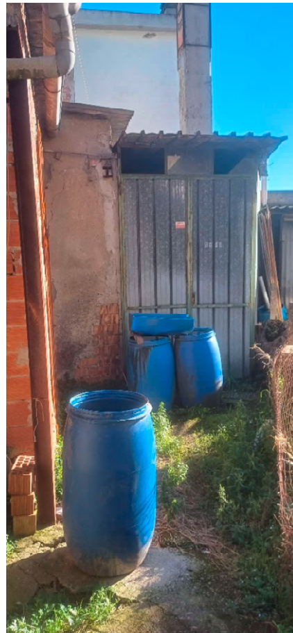
Fotografia 7 vista deposito esterno