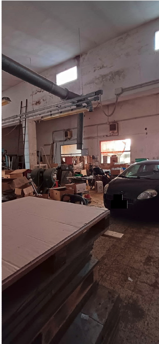
Fotografia nr 5 vista interna laboratorio