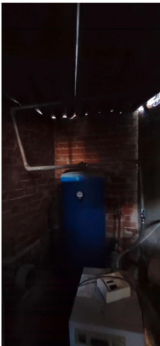
Fotografia nr 9 vista interna ripostiglio esterno