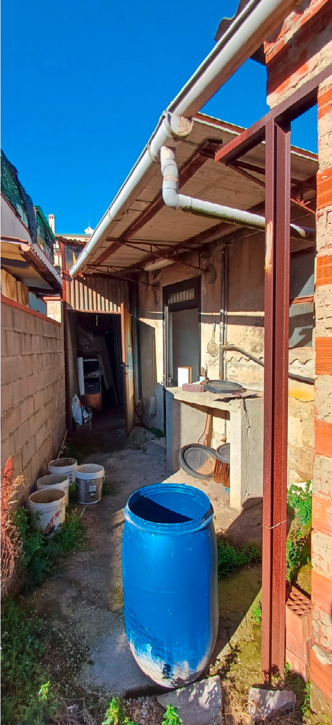
Fotografia nr 8 vista cortile esterno tergale