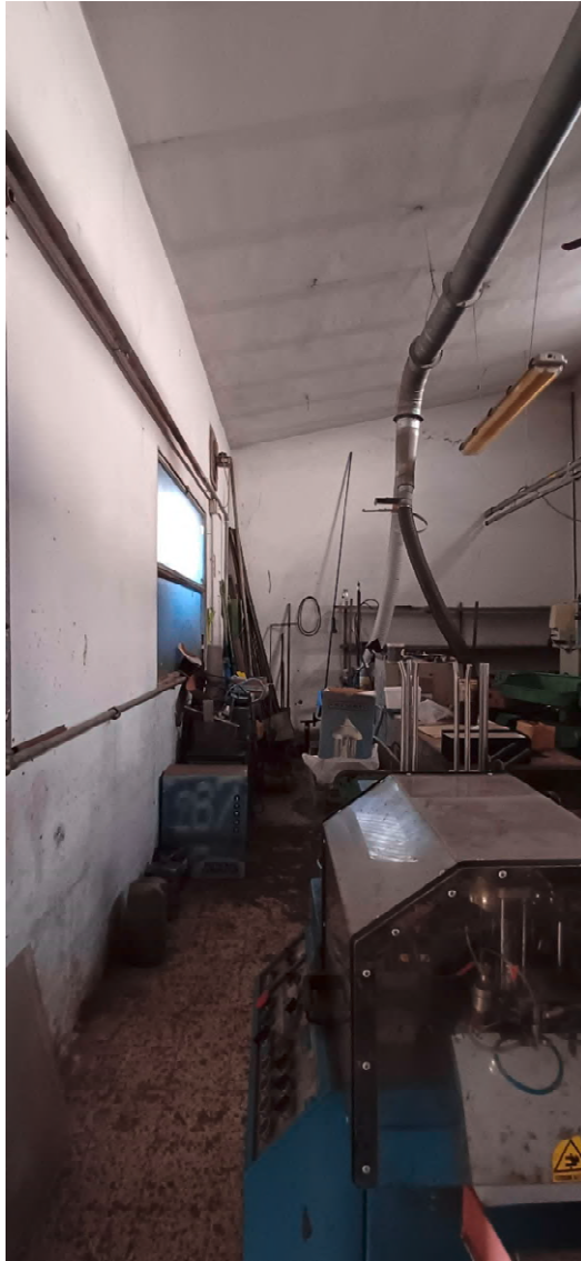
Fotografia nr 4 vista laboratorio