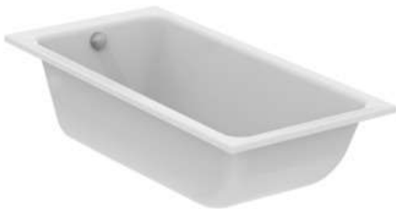
Vasca La Dolce Vita

Vasca rettangolare da incasso Ideal Standard serie La Dolce Vita dimensioni cm 170x75