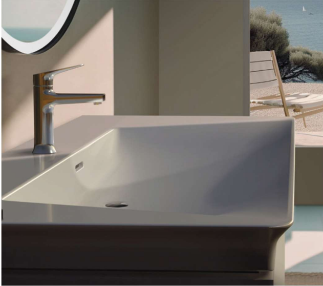
Lavabo La Dolce Vita