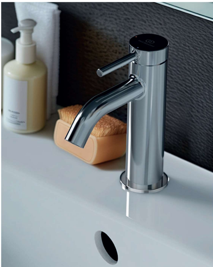
Rubinetto Ceraline monoforo

Vasca rettangolare da incasso Ideal Standard serie La Dolce Vita dimensioni cm 170x75