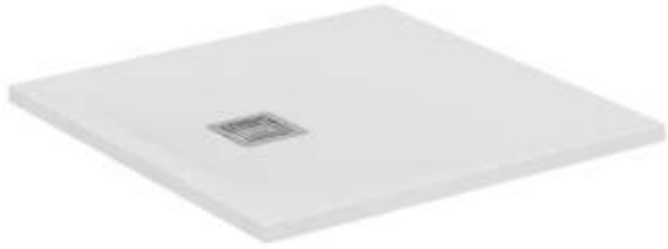
Piatto Doccia Ultra Flat S+