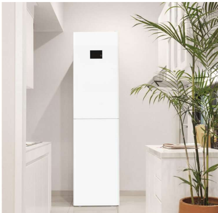
Pompa di calore 4 in 1