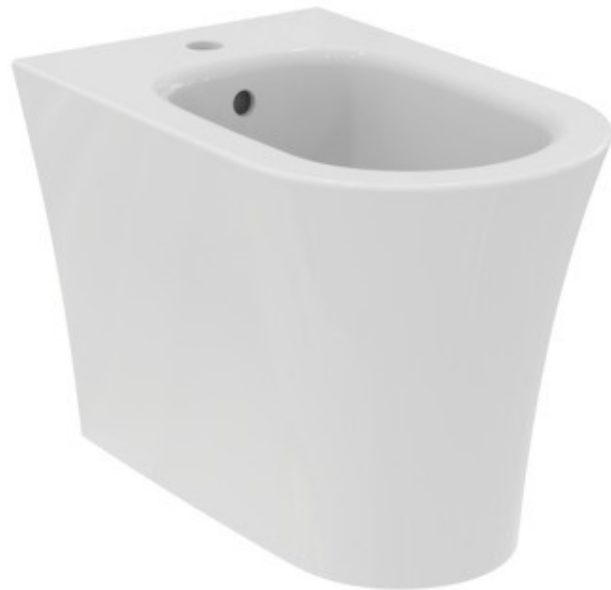
Vaso e Bidet a terra filo parete La Dolce Vita

Rubinetterie in acciaio cromato Ideal Standard serie Ceraline monoforo