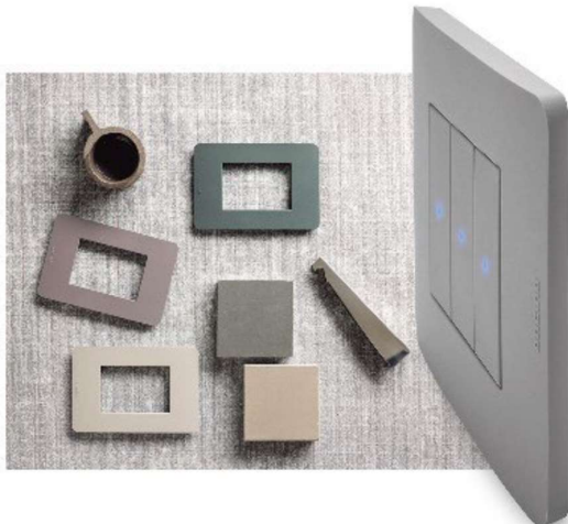
Placche ed interruttori MatixGo