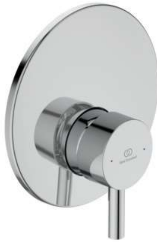
Miscelatore doccia ad incasso Ceraline