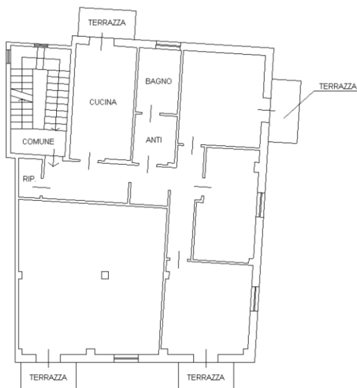
Pianta Piano Primo – sub. 4 – LOTTO 1

Per quanto riguarda il layout distributivo, si riportano nel seguito le planimetrie catastali dei beni oggetto di stima: