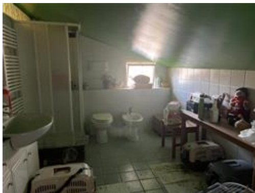
immagine dello stato di fatto

Tempi necessari per la regolarizzazione: 3 mesi