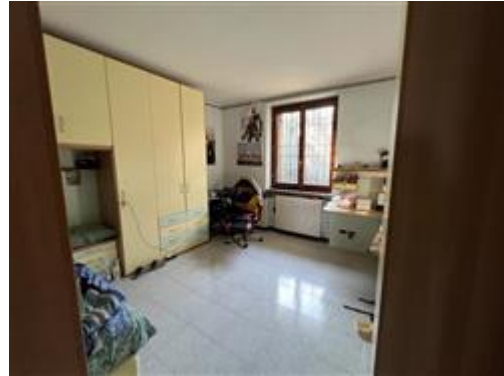
vista cameretta Piano Terra