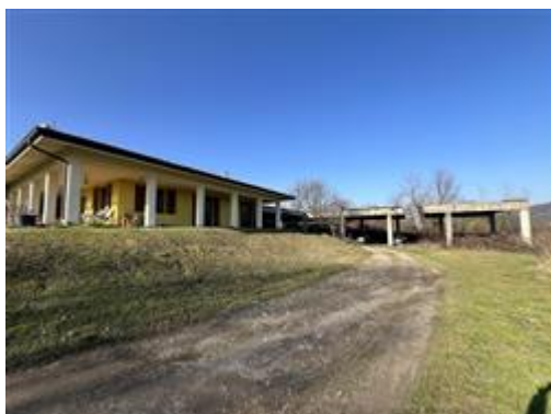
Vista villa con deposito/magazzino agricolo