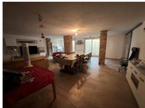
vista taverna Piano Seminterrato