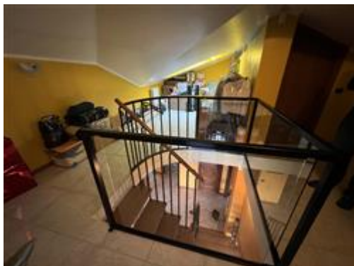
vista sbarco scala Piano Primo/Sottotetto