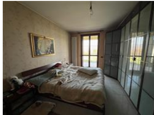
vista camera matrimoniale Piano Terra