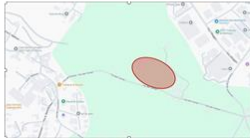
mappa satellitare ibrida