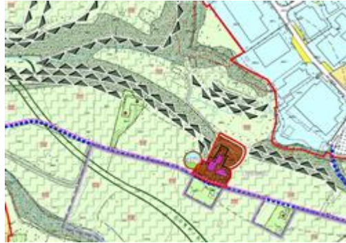
estratto carta sensibilità paesistica