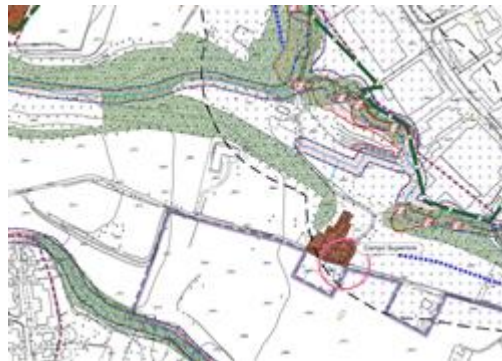
estratto tavola dei vincoli