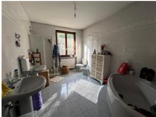
vista bagno Piano Terra