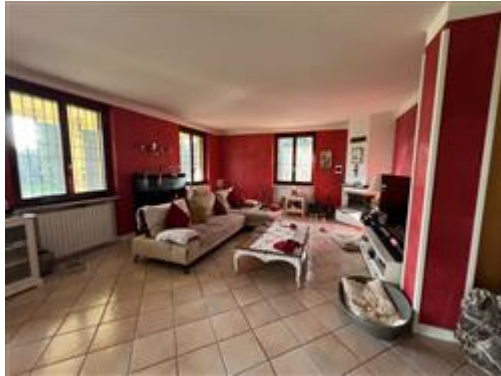
vista soggiorno Piano Terra