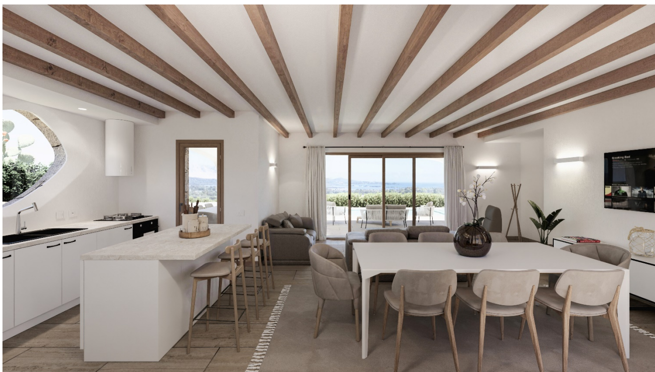
VISTA INTERNO SOGGIORNO .

rosso, scelte in base alla normativa UNI EN 14080, tagliate nel senso delle fibre ed essicate ad alta temperatura per più giorni in modo da eliminare i parassiti e incrementare la resistenza meccanica e la durezza rispetto al legno da segheria. Le travi sono lavorate con impianto a controllo numerico secondo le necessità previste dal progetto costruttivo in modo da ottenere un kit di prodotti strutturali qualificati che minimizza la necessità di lavorazioni in cantiere durante il montaggio. A norma del DM 14 gennaio 2008 "Norme Tecniche per le Costruzioni" punto 11.7.10, le lavorazioni sui materiali sono eseguite nel rispetto delle procedure di controllo della qualità depositate presso il Servizio Tecnico Centrale del Consiglio Superiore dei Lavori Pubblici. In particolare è assicurata la prescritta tracciabilità di tutti gli elementi lignei forniti. Il materiale, quando previsto in offerta, viene trattato con impianto automatico ad alta pressione e spazzolatura rotante, con un ciclo di impregnazione all' acqua, antimuffa, antitarlo e idrorepellente, a scelta tra quelli della nostra campionatura colore. Per i fissaggi tra le parti in legno e per il loro ancoraggio alle strutture esistenti (plinti, fondazioni, travi in cls murature e/o altre strutture in genere) vengono impiegati elementi metallici pressopiegati e/o saldati e realizzati a disegno, bulloneria, viteria.