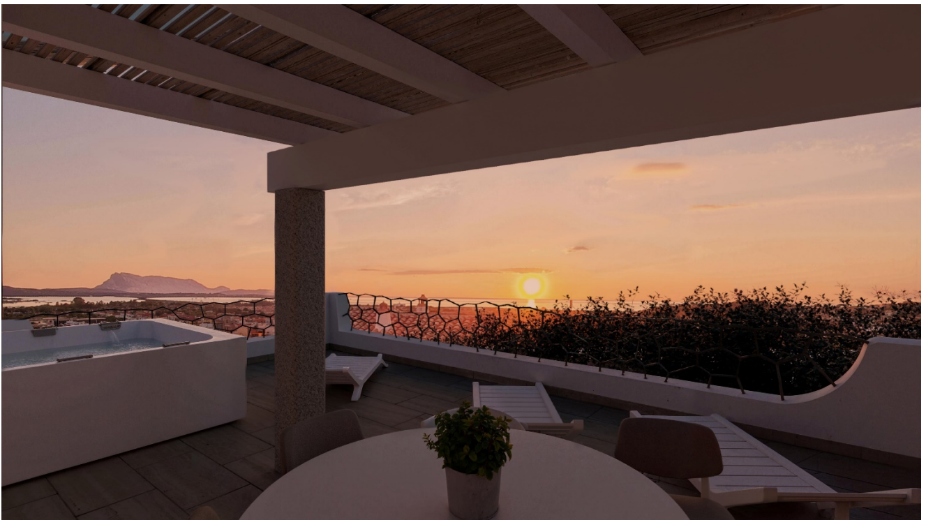
ALBA DAL TERRAZZO

Porte interne delle dimensioni di cm. 80/90 – 210/215 realizzate in legno, sulla base degli schemi della direzione dei lavori, compresi di quanto occorre per dare l'opera finita a regola d'arte. Comprese eventuali porte scorrevoli nei bagni.