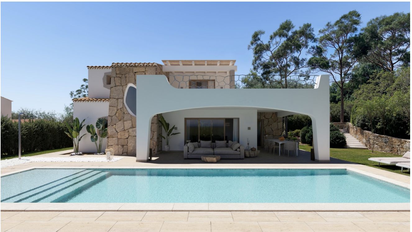
Prospetto principale Villa