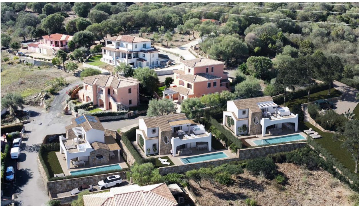
VISTA AEREA DELLE VILLE

Gestione lavori: con la nostra esperienza e competenza, garantiamo la realizzazione del progetto, con un perfetto inserimento nella natura circostante per la massima soddisfazione del cliente.