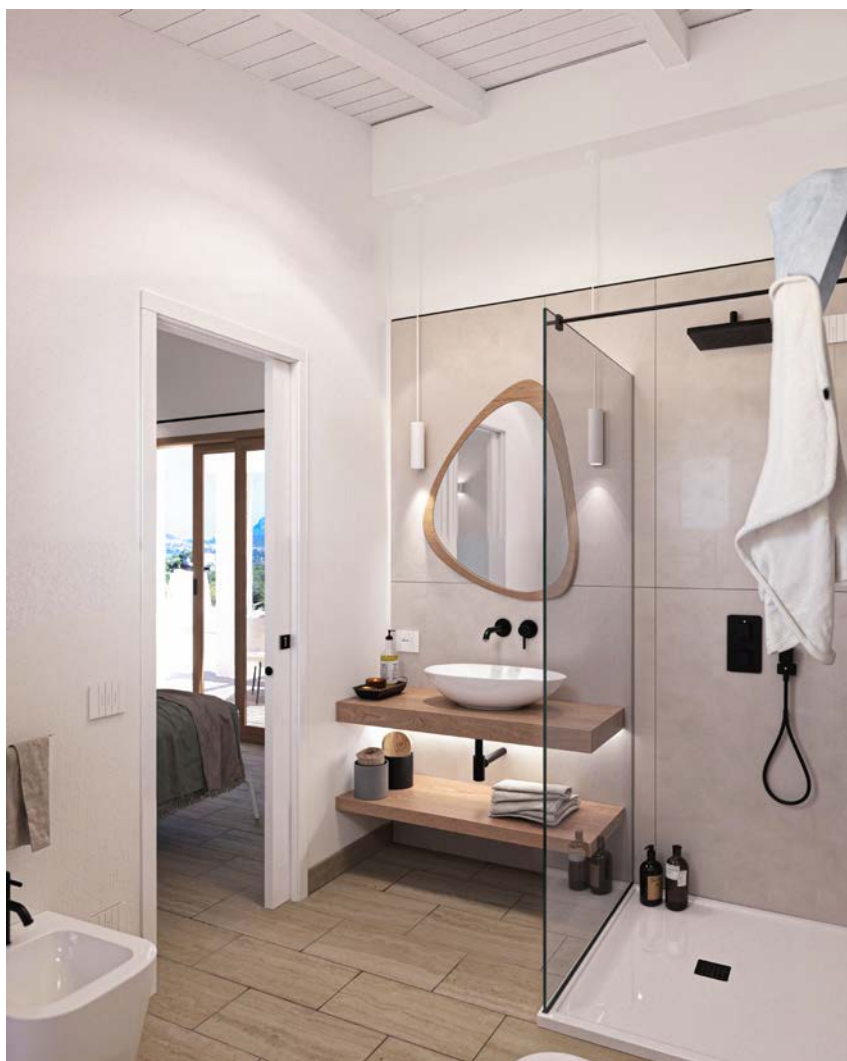
BAGNO AL 1° PIANO

L'impianto idrico-sanitario sarà, in rame sanitario o in multistrato per l'adduzione e in Pvc rinforzato per gli scarichi delle acque nere. La rete fognaria per lo scarico dei servizi igienico-sanitari e della cucina sarà costituita da colonne tipo sylent, completa di pezzi speciali, collari e tutto quanto necessario per il miglior funzionamento. Tutti i raccordi orizzontali avranno appositi pozzetti di ispezione, per garantirne un idoneo funzionamento. Compresi tubi di ventilazione dell'impianto fognario. La cucina verrà predisposta per un lavello ed una lavastoviglie. L'impianto idrico/sanitario sarà dimensionato con tubazioni adeguate. I sanitari (water con cassetta ad incastro tipo pucci/bidet/lavabo) saranno del tipo sospeso moderno rimless o similare, completi di rubinetteria Paffoni e/o Grohe. Il piatto doccia sarà in vetroresina o similare, completo di soffione e miscelatore con doccino ad incasso sempre Paffoni e/o Grohe. Per ogni unità abitativa sono previsti due attacchi per la lavatrice, uno interno ed uno esterno. Predisposizione per installazione pompa di calore per acqua calda sanitaria. Si precisa che le Ville non saranno dotate di impianti a gas.