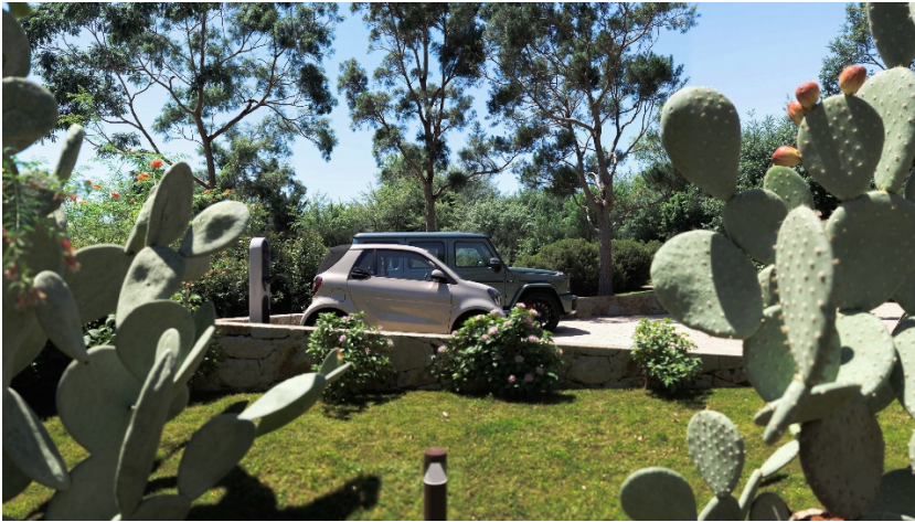
RICARICA ELETTRICA AUTO