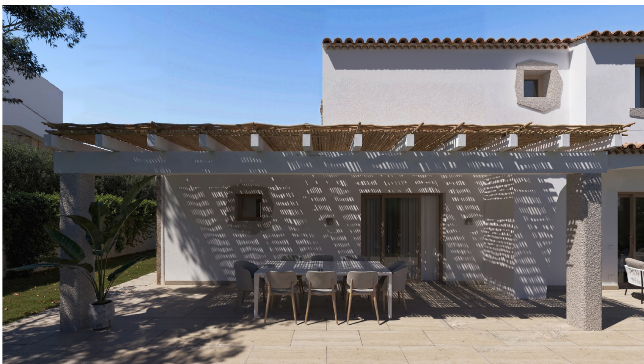
VISTA PERGOLATO SUL RETRO

In fase di costruzione, e se ritenuto indispensabile, la società proprietaria ed il Direttore dei Lavori si riservano, la facoltà di apportare alla presente descrizione ed ai disegni di progetto quelle variazioni o modifiche che ritenessero necessarie per motivi tecnici, funzionali, estetici o connessi alle procedure urbanistiche e paesaggistiche, purché le stesse non comportino la riduzione del valore tecnico e/o economico delle unità immobiliari.