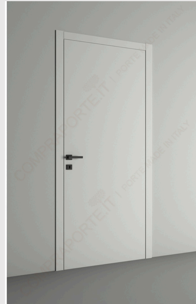
ITALPORTE - EKASA AD ANTA