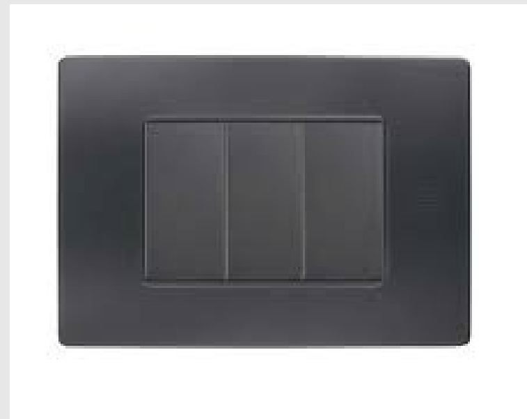
PRESE SIMON - URMET SERIE FLEXA