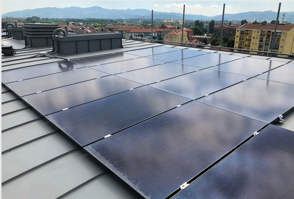
IMPIANTO FOTOVOLTAICO PRIVATO