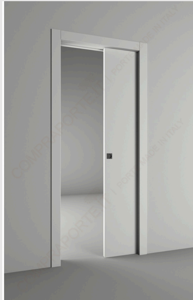
ITALPORTE - EKASA A SCOMPARSA