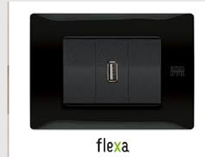
PRESE SIMON - URMET SERIE FLEX USB / USBC