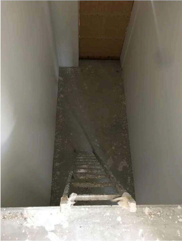
Vano per scala interna