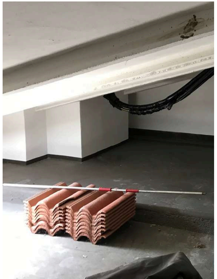
Sottotetto - Porzione non abitabile