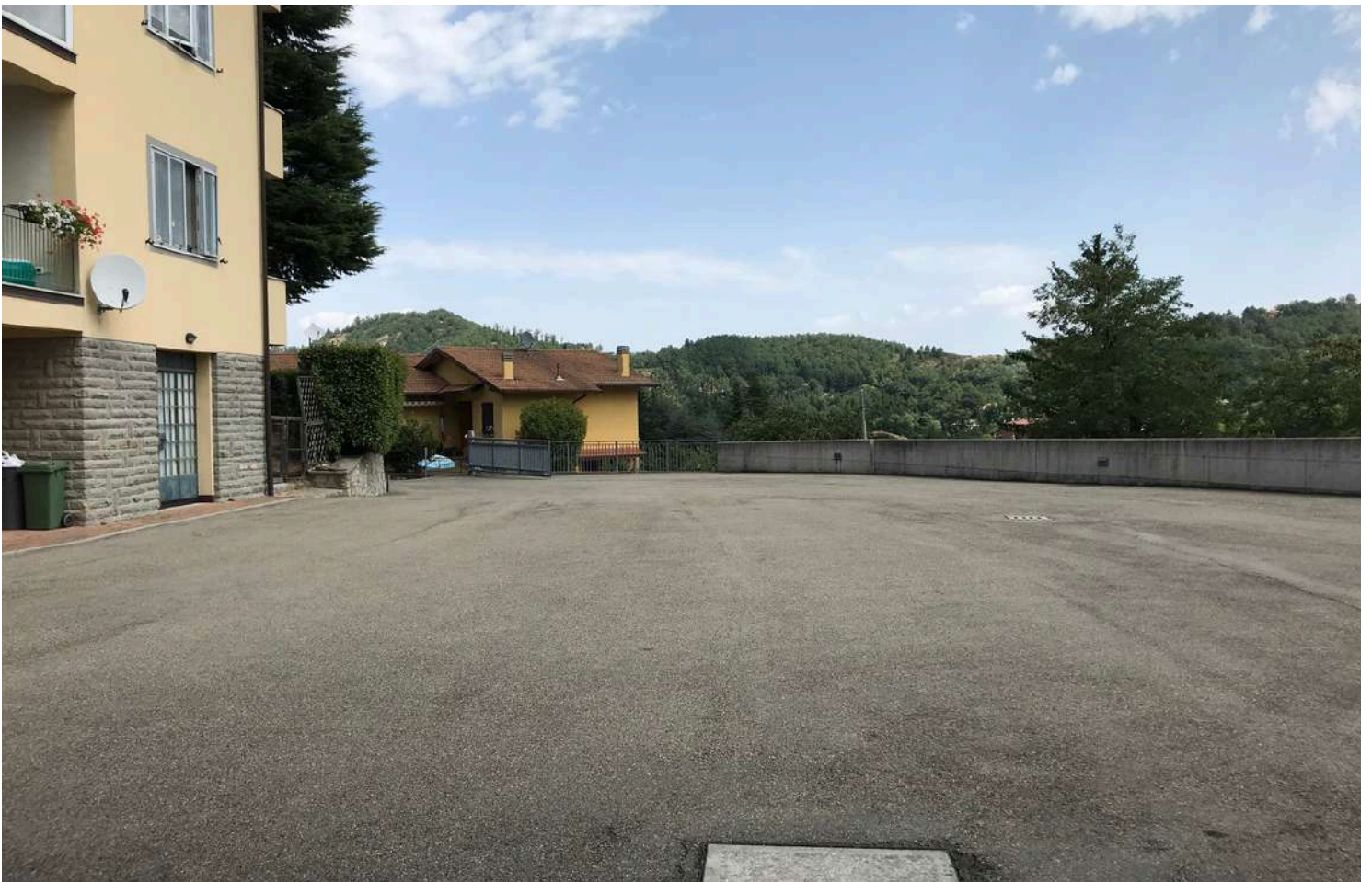
Sub. 15 - BCNC - Piazzale carrabile comune