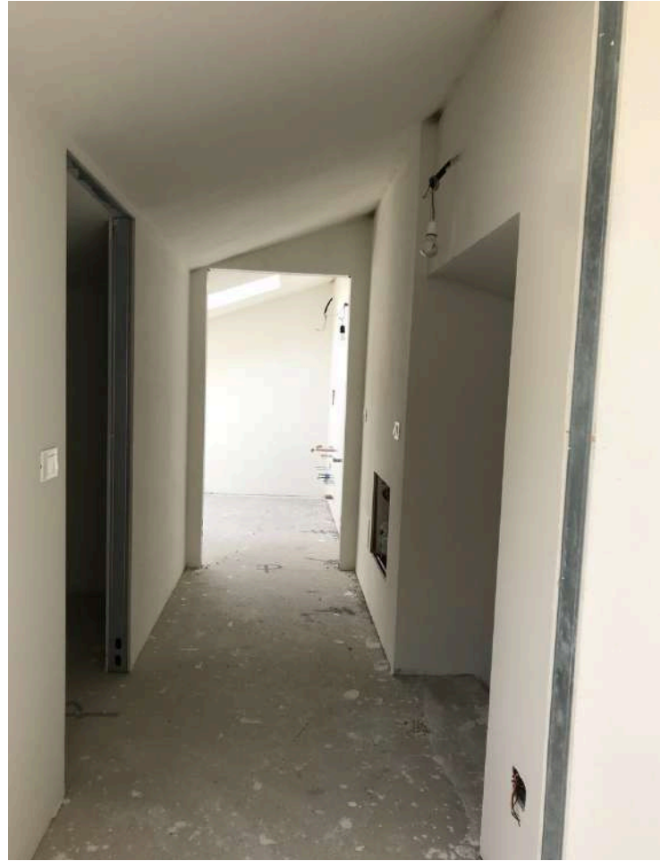
Sottotetto - Disimpegno centrale