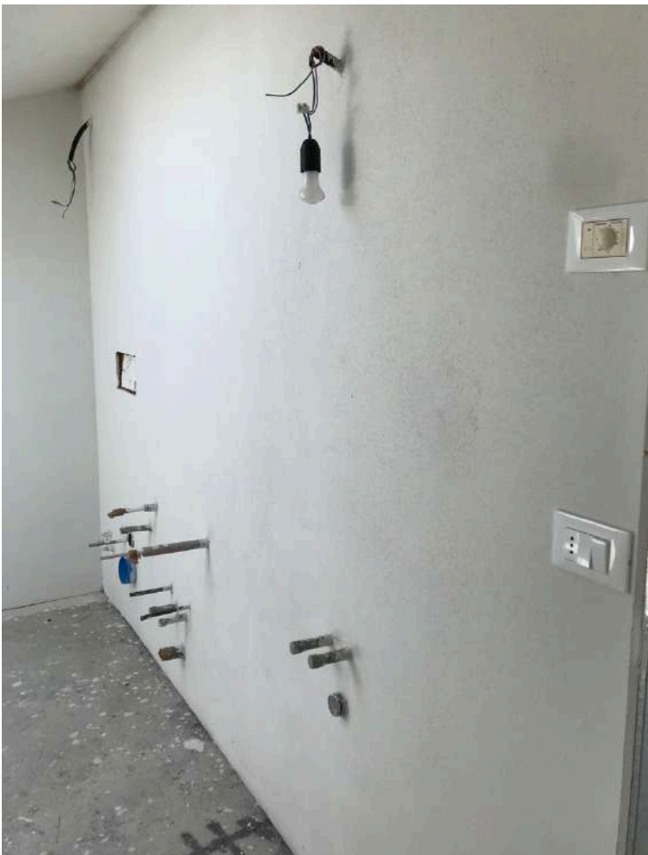
Sottotetto - Predisposizione bagno