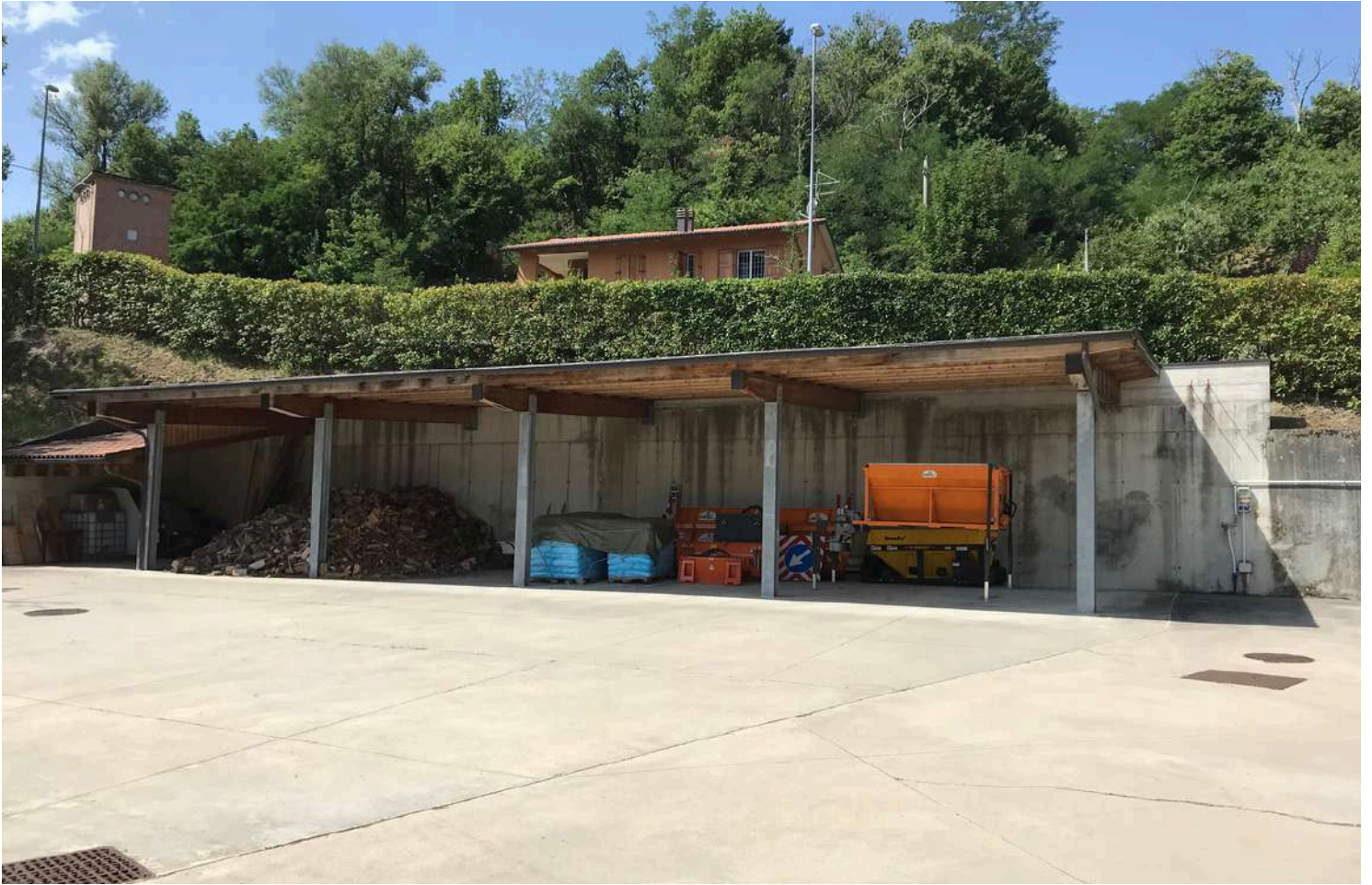
Sub. 16 - BCNC - Tettoia non legittima