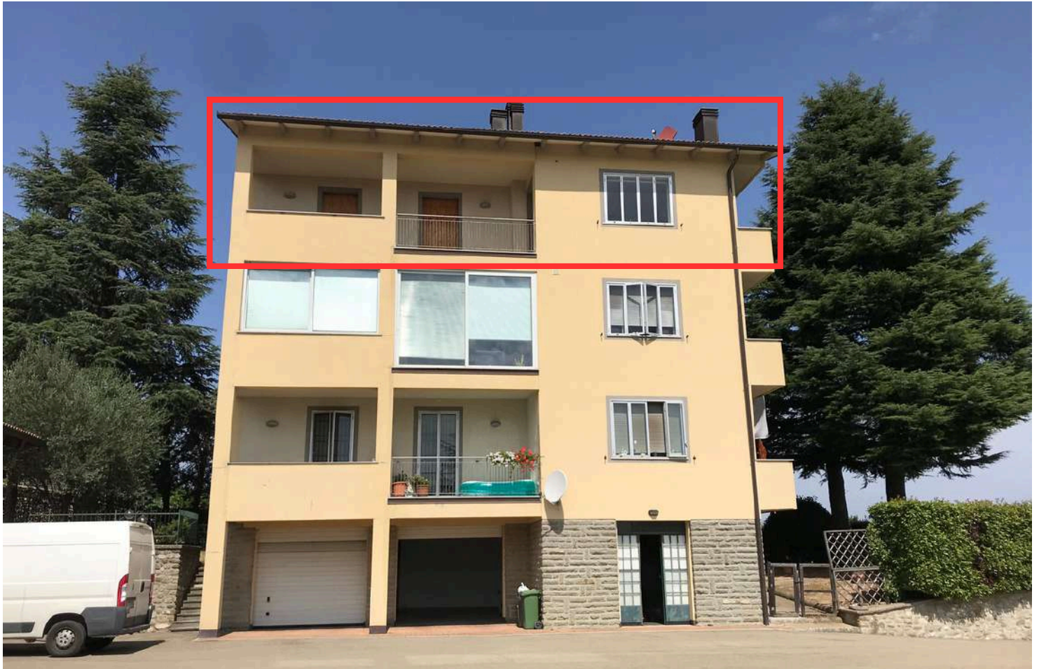
Facciata del fabbricato con individuazione dell'appartamento