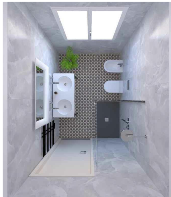
Viste 3d Bagno Tipo