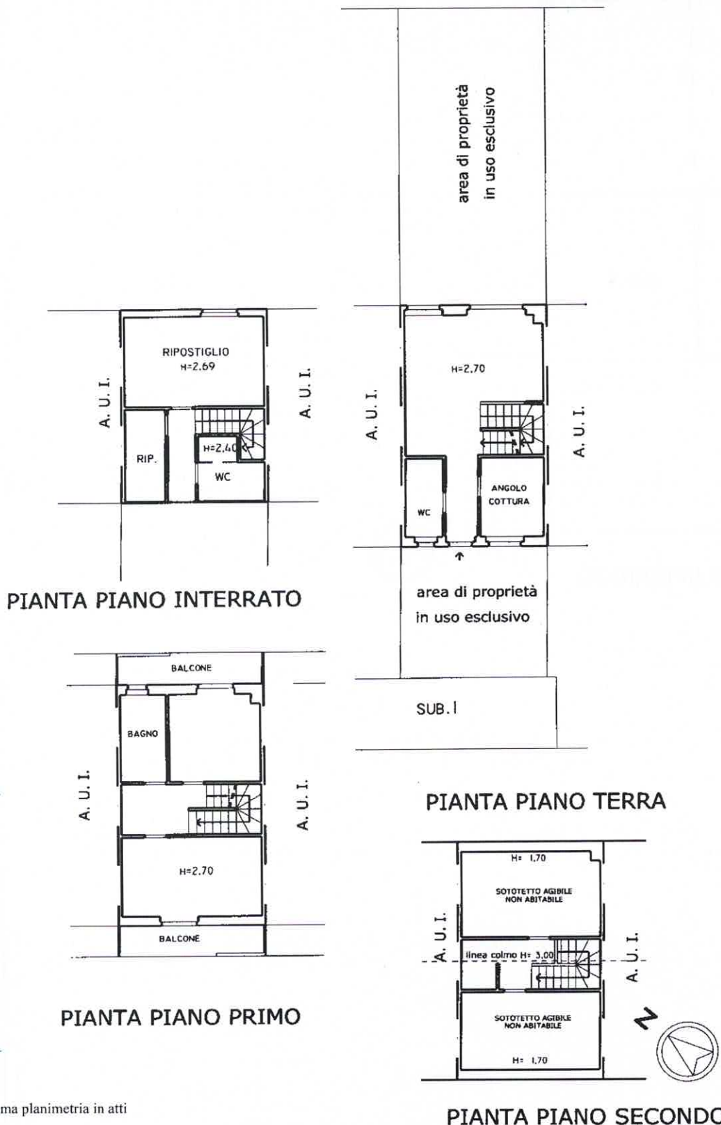
PIANTA PIANO INTERRATO