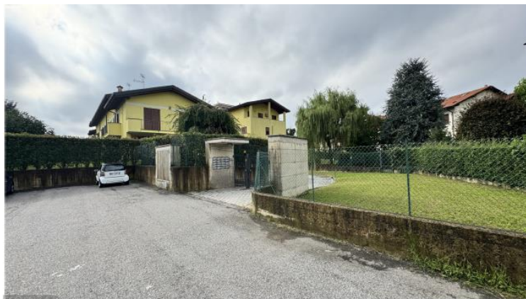
INGRESSO AL CONDOMINIO