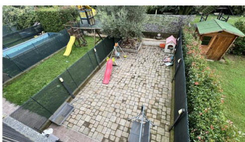
GIARDINO SUL RETRO PIANO TERRA