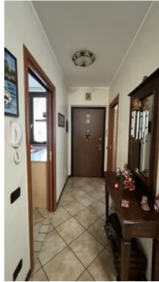
BAGNO E CORRIDO