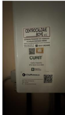
IMPIANTI (INVERTER RIMOSSO)