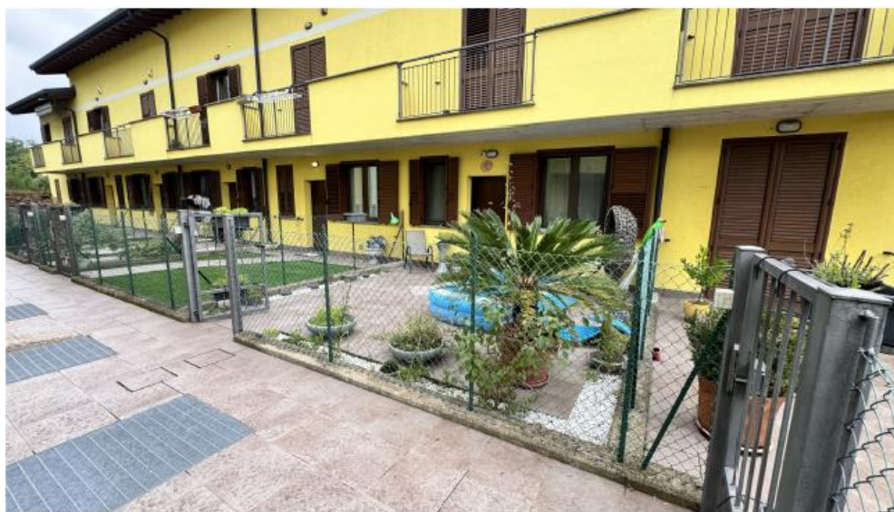
GIARDINO – INGRESSO

STUDIO ASSOCIATO DI INGEGNERIA E ARCHITETTURA DI ING. VALERIA RIBALDONE E ARCH. PIETRO MORETTI