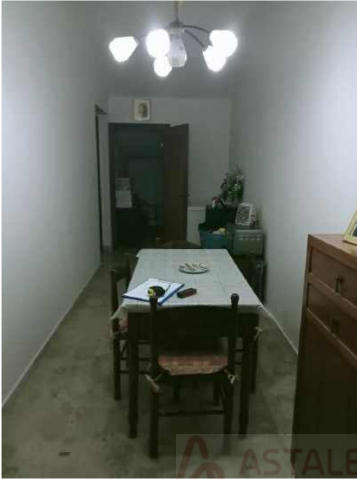
Foto 5 –corridoio cieco Sullo sfondo accesso al secondo ripostiglio