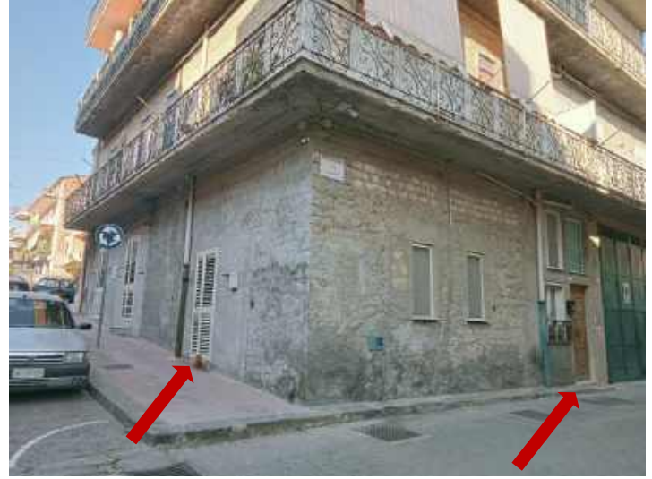
Foto 10 – esterno con accesso da via del Risorgimento n. 42 privato e da via Italia n. 42 comune