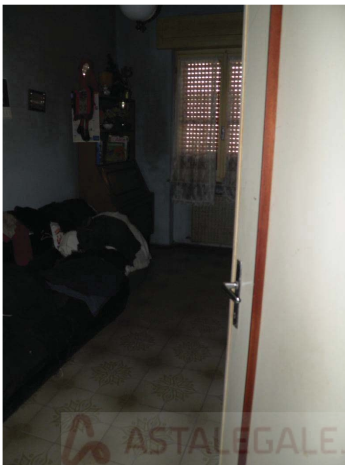
FOTOGRAFIA 9: Vista della terza camera da letto matrimoniale.