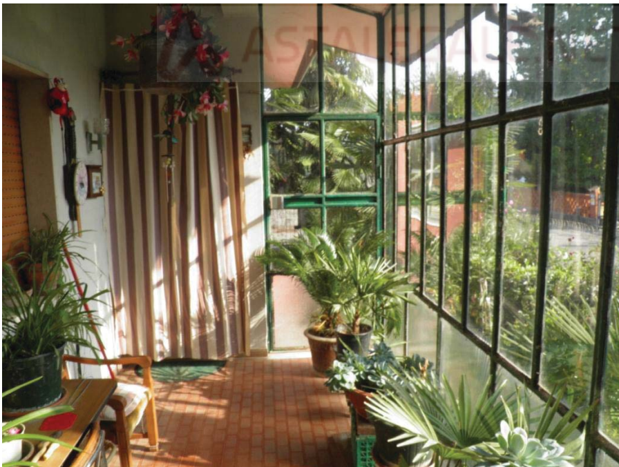
FOTOGRAFIA 4: Vista della veranda d'ingresso.