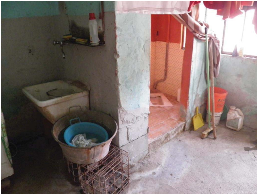
FOTOGRAFIA 15: Vista interna del locale lavanderia.