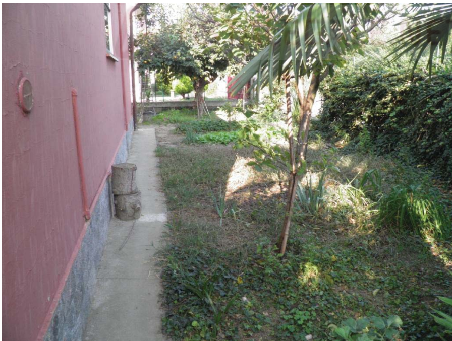
FOTOGRAFIA 20: Vista dell'area verde posta in lato sud-est.