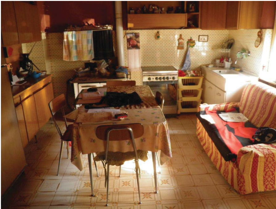
FOTOGRAFIA 5: Vista della cucina.