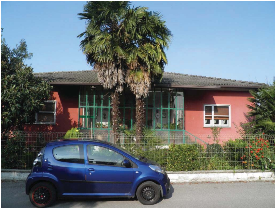
FOTOGRAFIA 3: Vista della facciata principale dell'immobile.