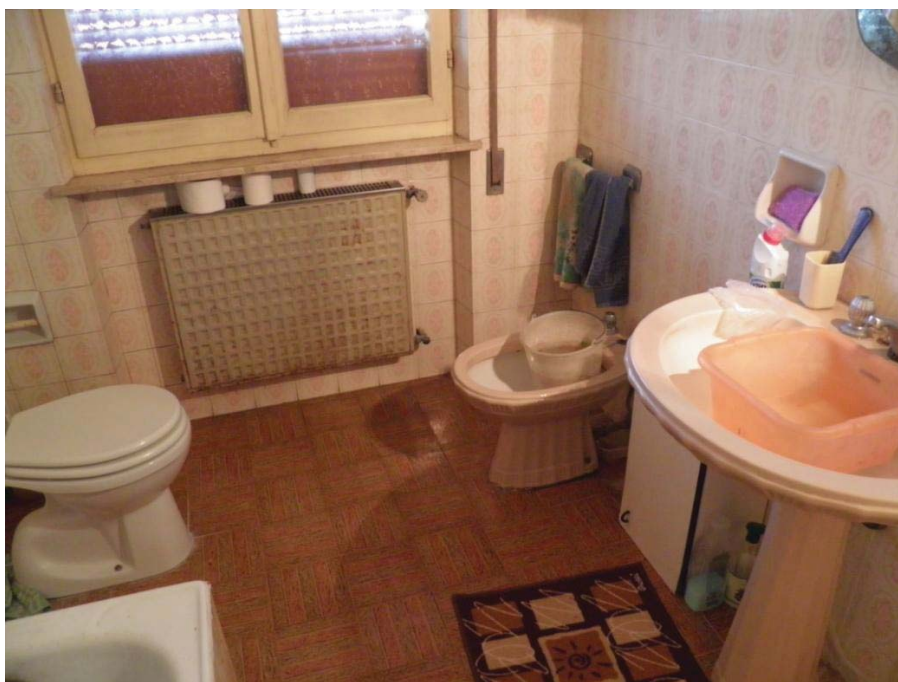
FOTOGRAFIA 10: Vista del locale bagno.