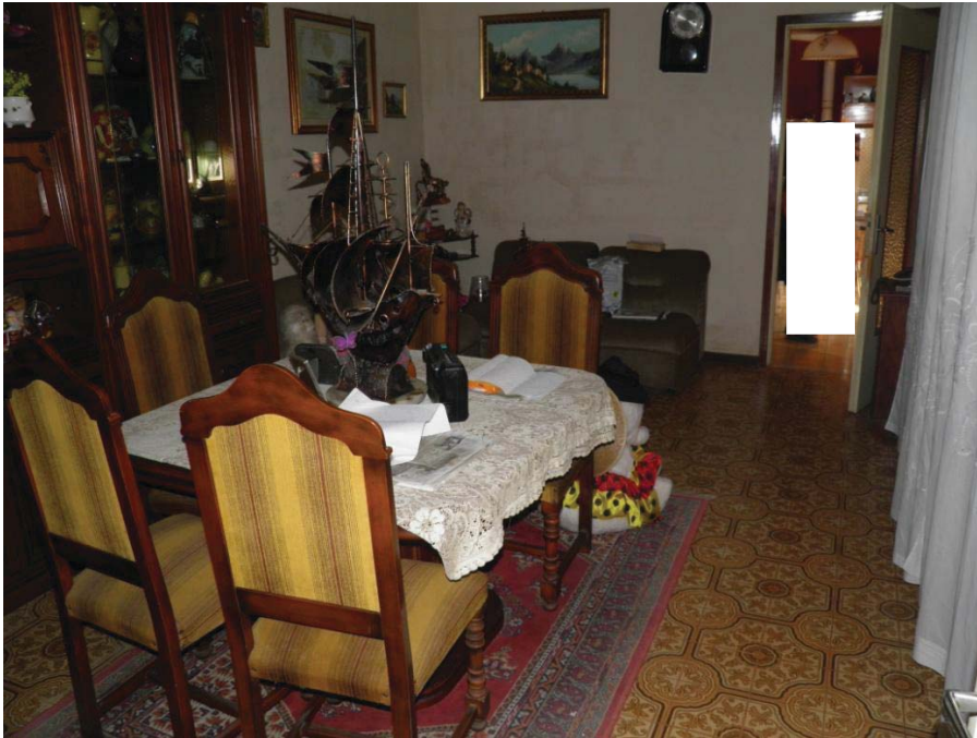
FOTOGRAFIA 11: Vista del soggiorno.