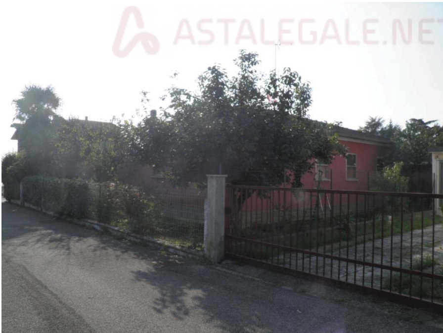
FOTOGRAFIA 2: Altra vista d'insieme del fabbricato.