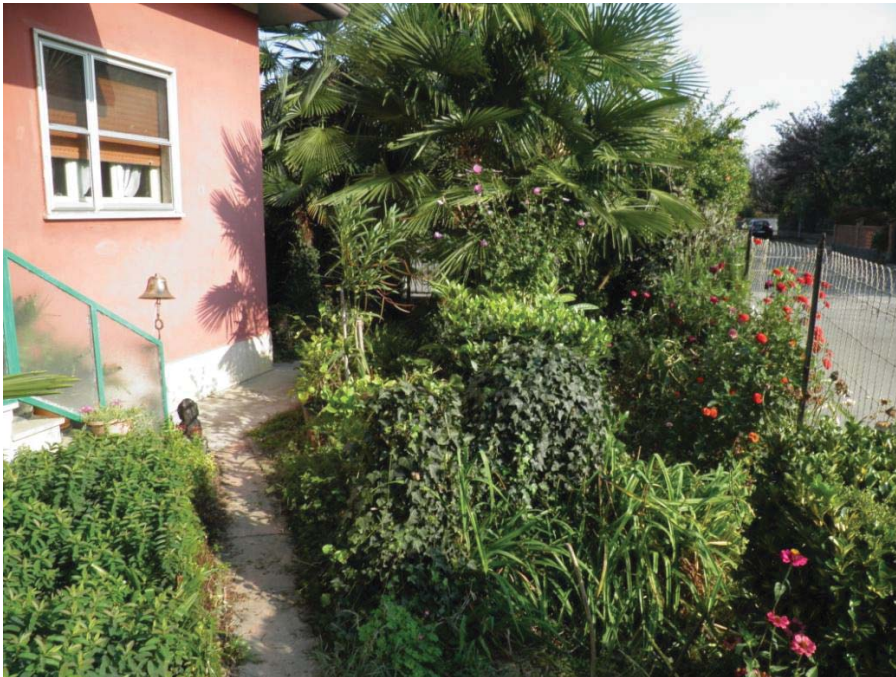
FOTOGRAFIA 21: Vista dell'area verde antistante l'ingresso principale.