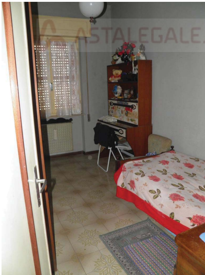
FOTOGRAFIA 8: Vista della seconda camera da letto.