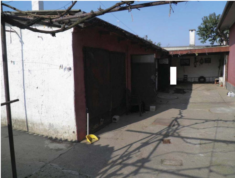
FOTOGRAFIA 13: Vista d'insieme dei locali accessori esterni.