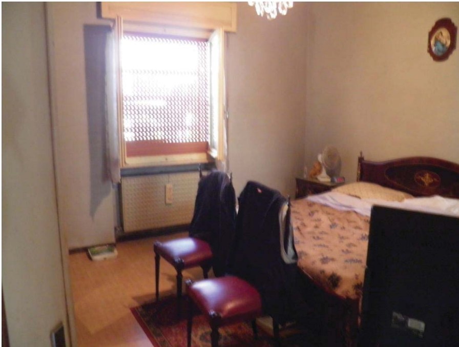
FOTOGRAFIA 7: Vista della camera da letto matrimoniale.