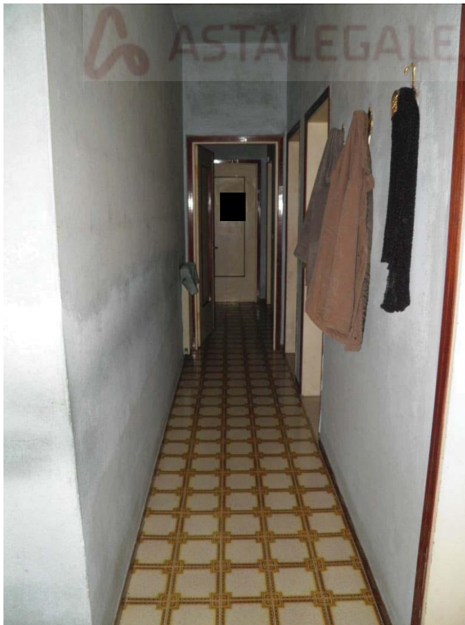
FOTOGRAFIA 6: Vista del corridoio che conduce alla zona notte.