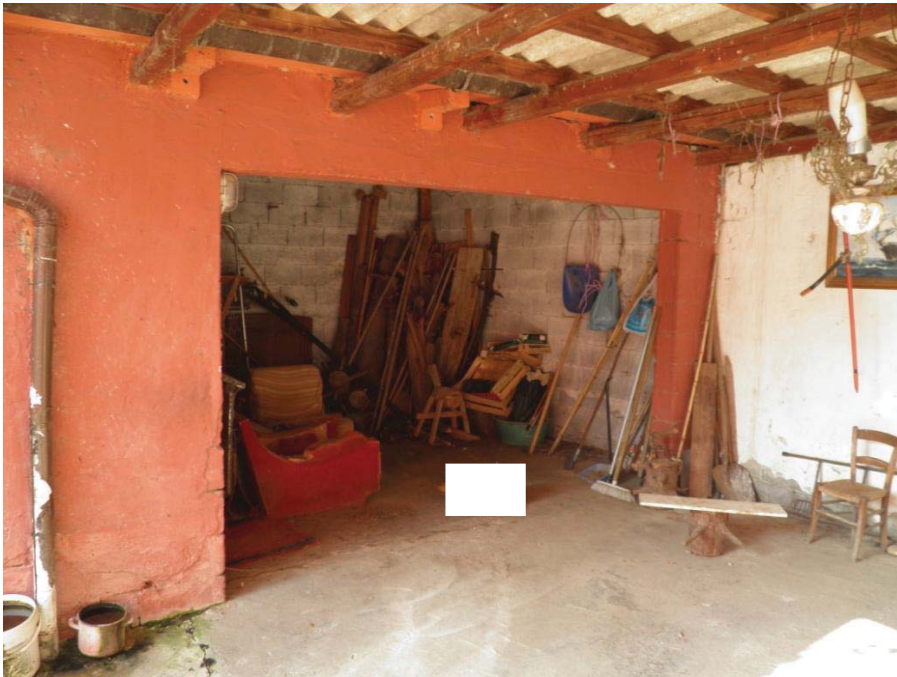
FOTOGRAFIA 17: Vista del locale legnaia.