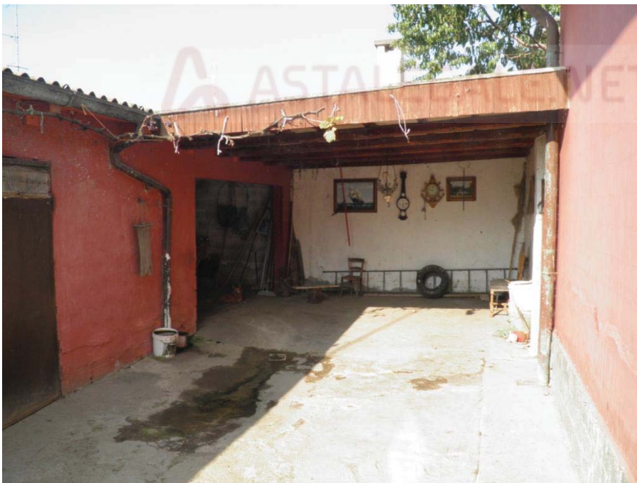
FOTOGRAFIA 18: Vista del portico prospiciente alla legnaia.