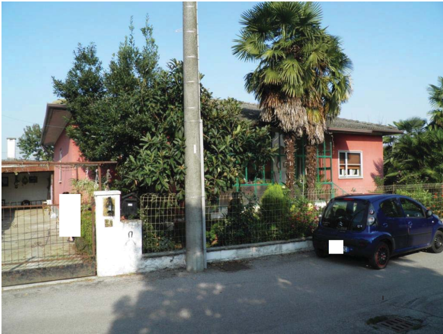
FOTOGRAFIA 1: Vista d'insieme del fabbricato oggetto di pignoramento dalla via A. Ponchielli.