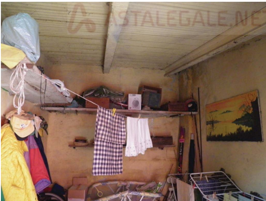
FOTOGRAFIA 14: Vista interna dell'autorimessa.