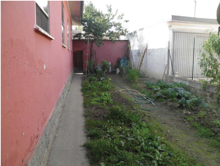
FOTOGRAFIA 19: Vista dell'area verde posta in lato nord-est.