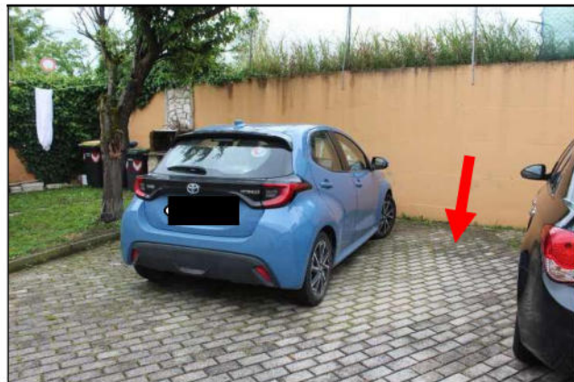
5 - posto auto sub 17