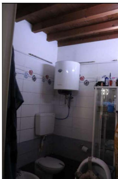
12 - scaldabagno