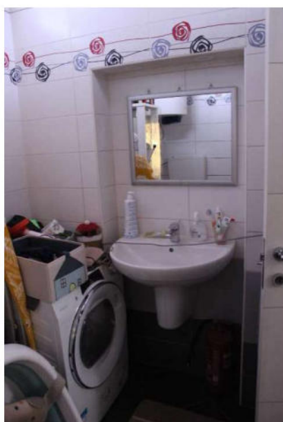
11 - Bagno