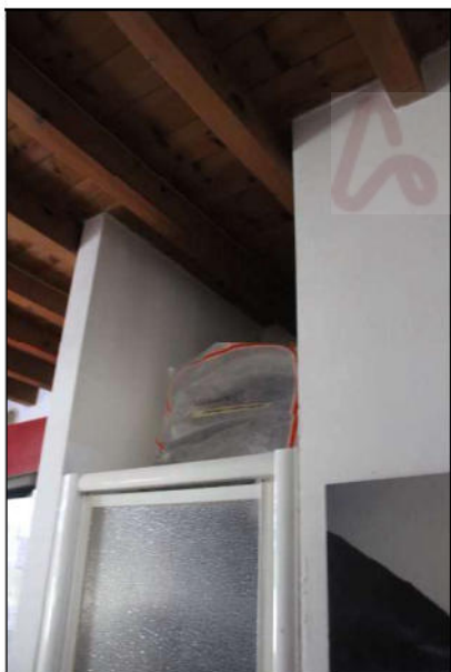
16 – ripostiglio