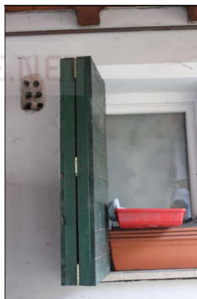
18 – Finestra e scuro pieghevole