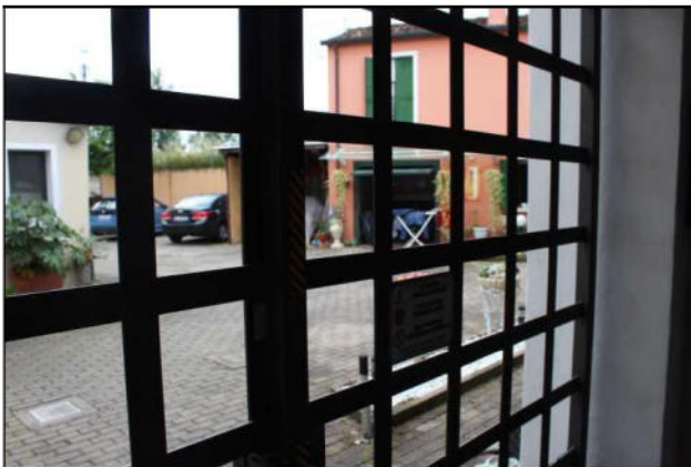
4 - Cortile interno