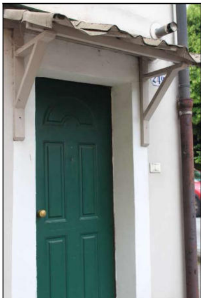
6 - Portoncino di ingresso