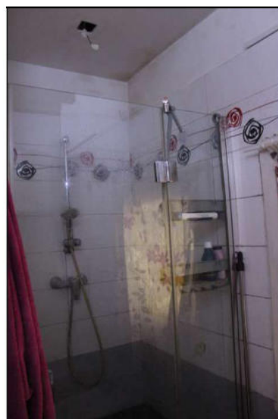
13 - Doccia