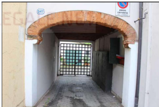
3 - Portico di ingresso al cortile interno