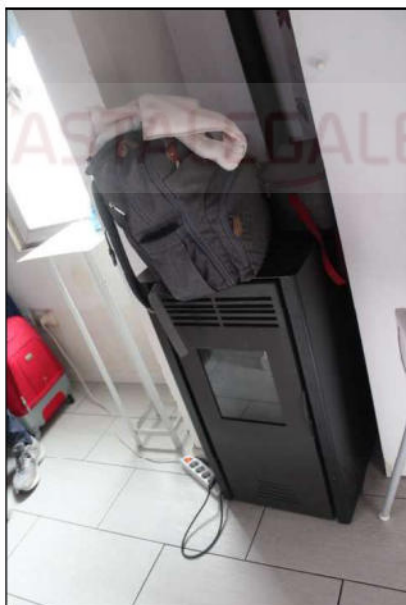
17 – stufa a pellet