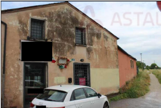
2.- Prospetto Nord (lungo l'argine Brentella)