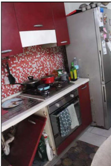
7 - piano cottura