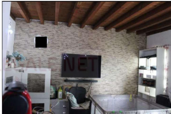
9-10 - Locale soggiorno