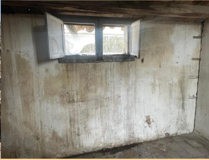
The Upper Sector at 2 nd Floor