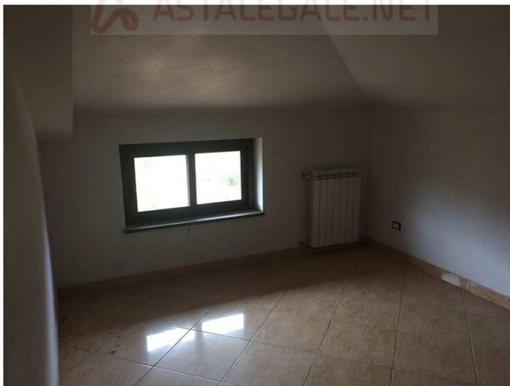
Camera piano primo