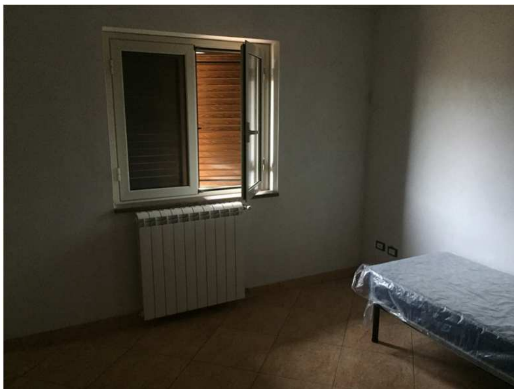
Camera piano primo