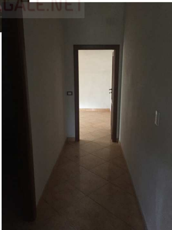
Corridoio piano primo