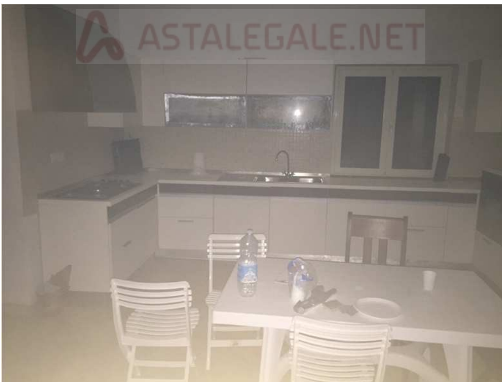
Cucina al piano terra