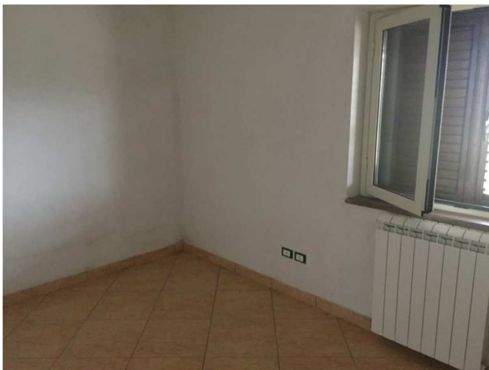
Camera piano primo