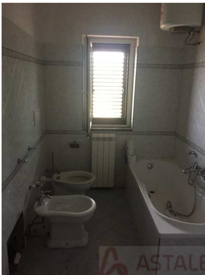
Bagno piano primo