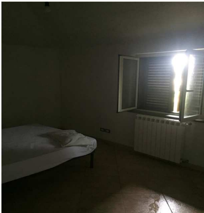
camera al piano terra