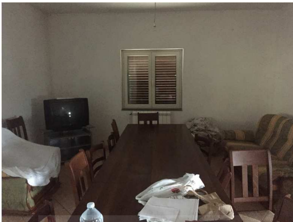
Soggiorno al piano terra