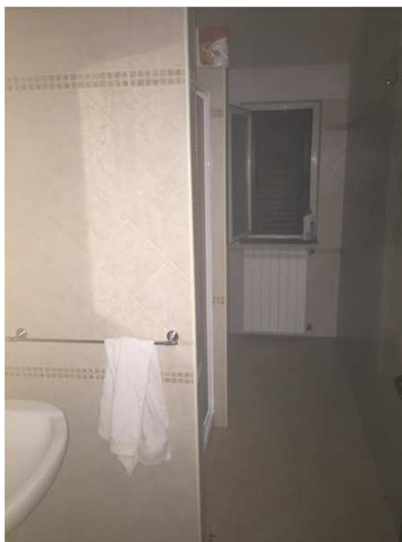
Bagno al piano terra