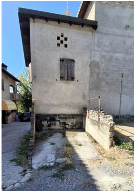
Figura 5 - VISTA AREA ESTERNA