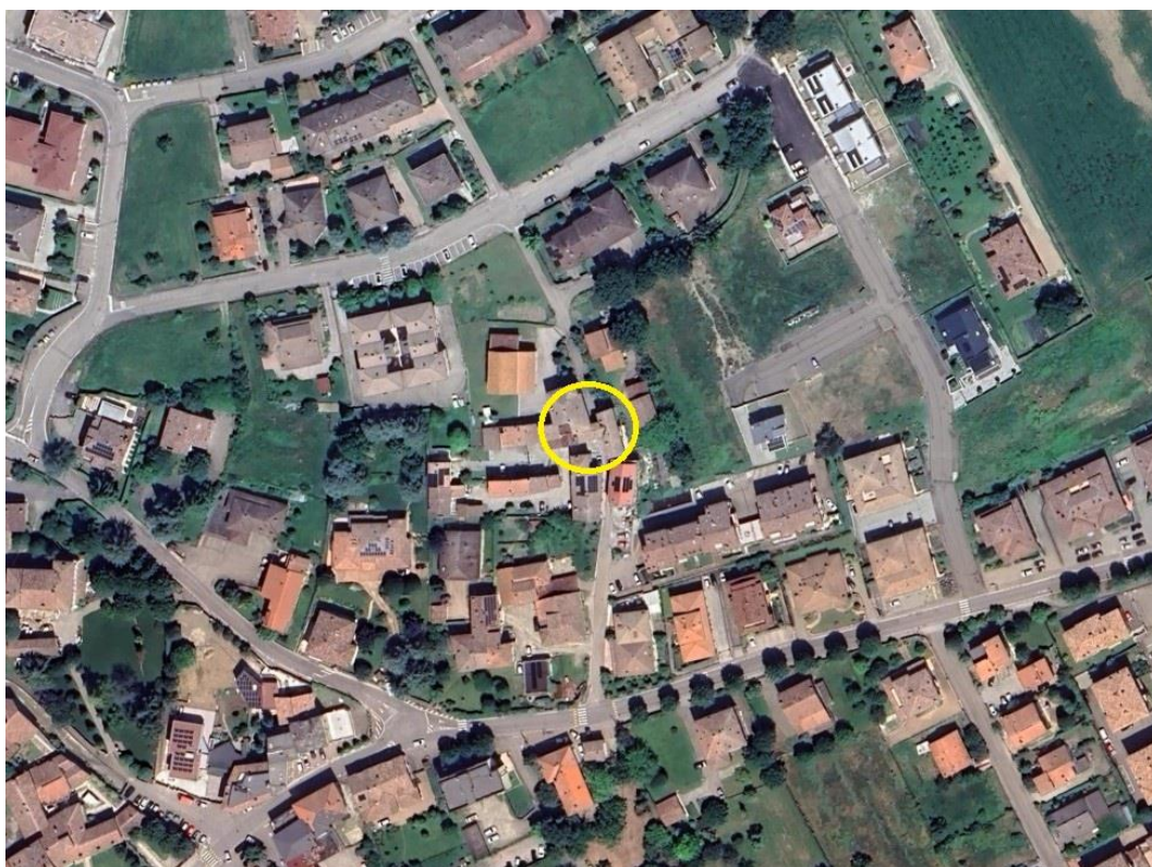
Figura 2 - INQUADRAMENTO DEL FABBRICATO NEL TERRITORIO