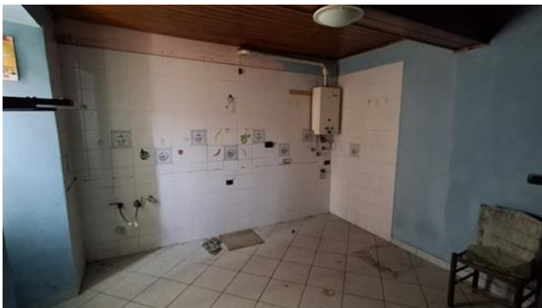
Figura 3 - VISTA CUCINA