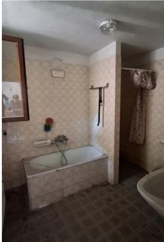
Figura 4 – VISTA SERVIZIO IGIENICO