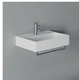
Lavabo modello Hide con rubinetteria serie Prime