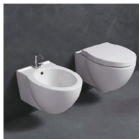
Water e bidet serie Short

La rubinetteria prevista sarà della ditta Cristina Rubinetteria serie Prime finitura cromo o simile e le cassette Geberit a scomparsa doppio flusso.