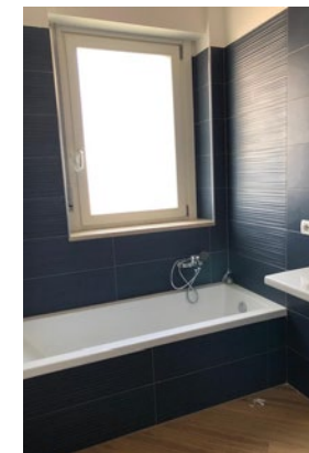
Vasca a incasso ditta Ideal Standard