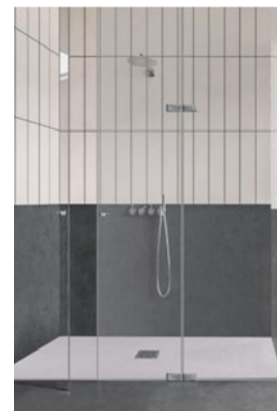
Piatto doccia ditta Poliflex Riverstone