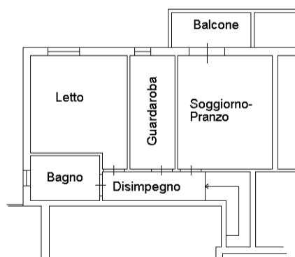
PIANO PRIMO H=270