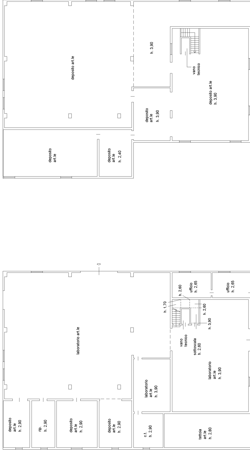
PIANO TERRA h. 3.50