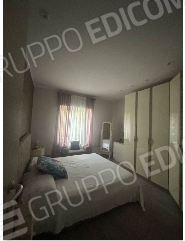
Figura 10 - Camera n.2