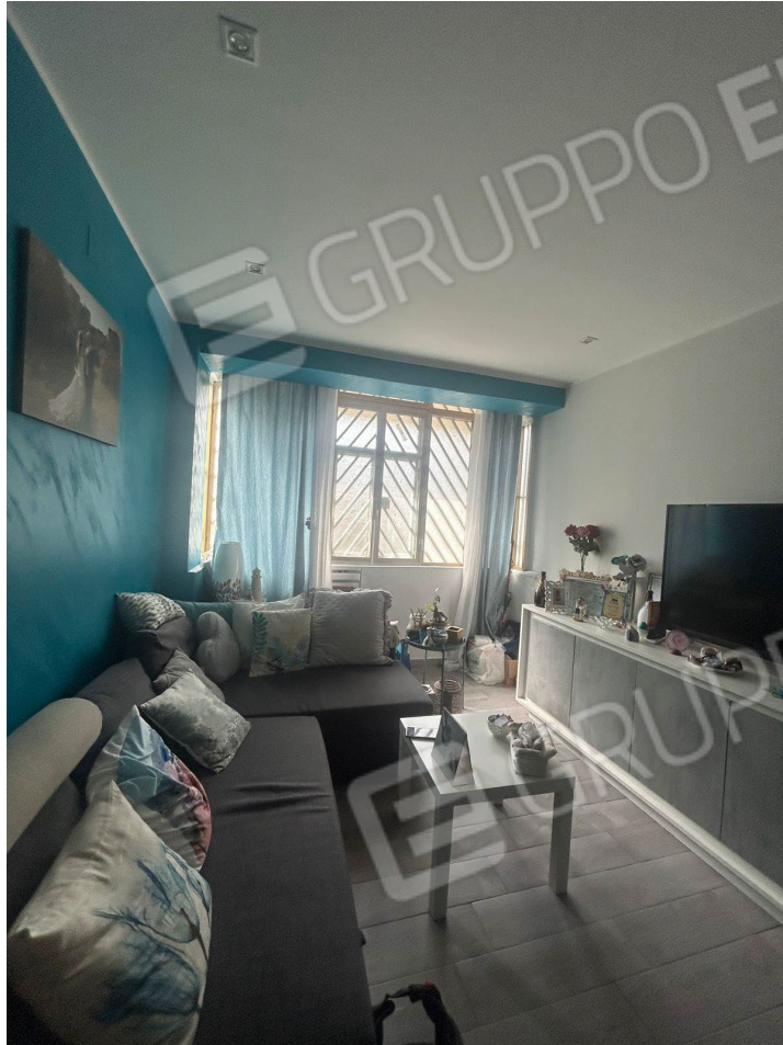
Figura 4 - Soggiorno