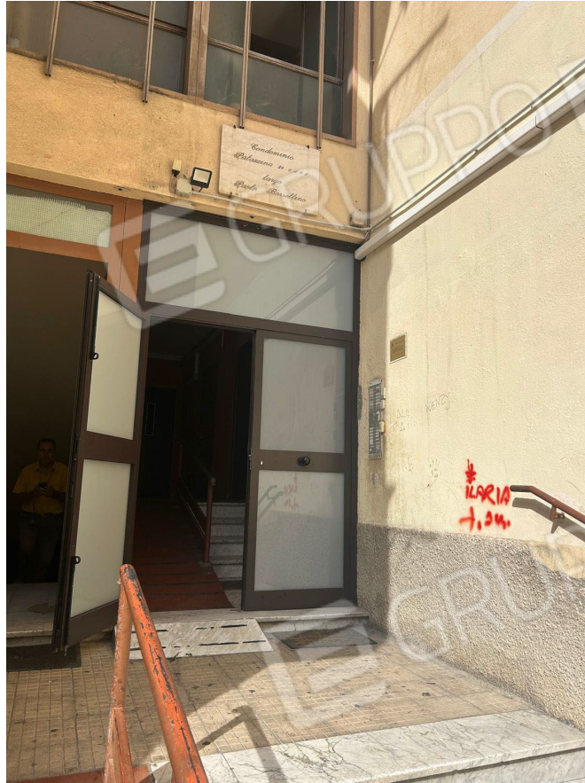
Figura 1 - Ingresso condominio Pal.24 IACP