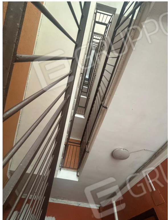
Figura 3 - Scale condominiali