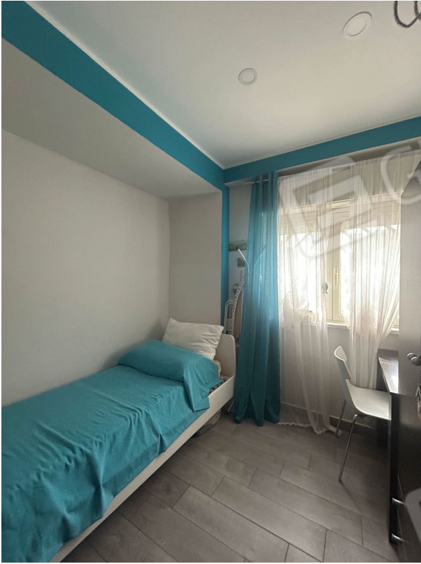
Figura 9 - Camera n.1