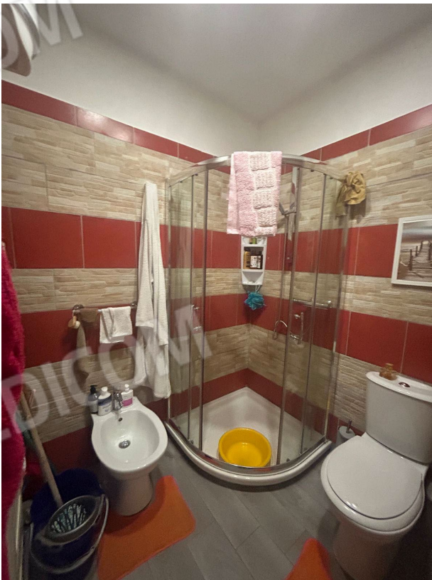
Figura 7 - Bagno