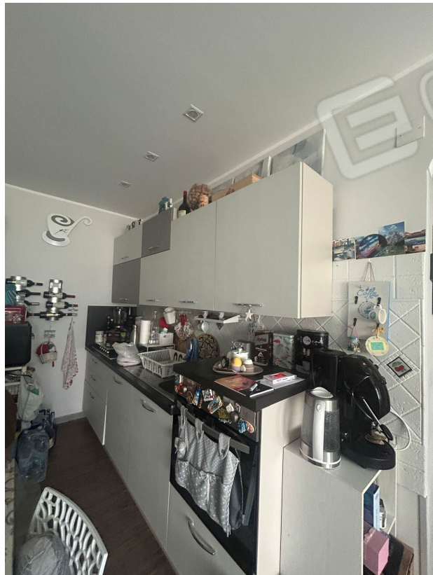
Figura 5 - Angolo cottura