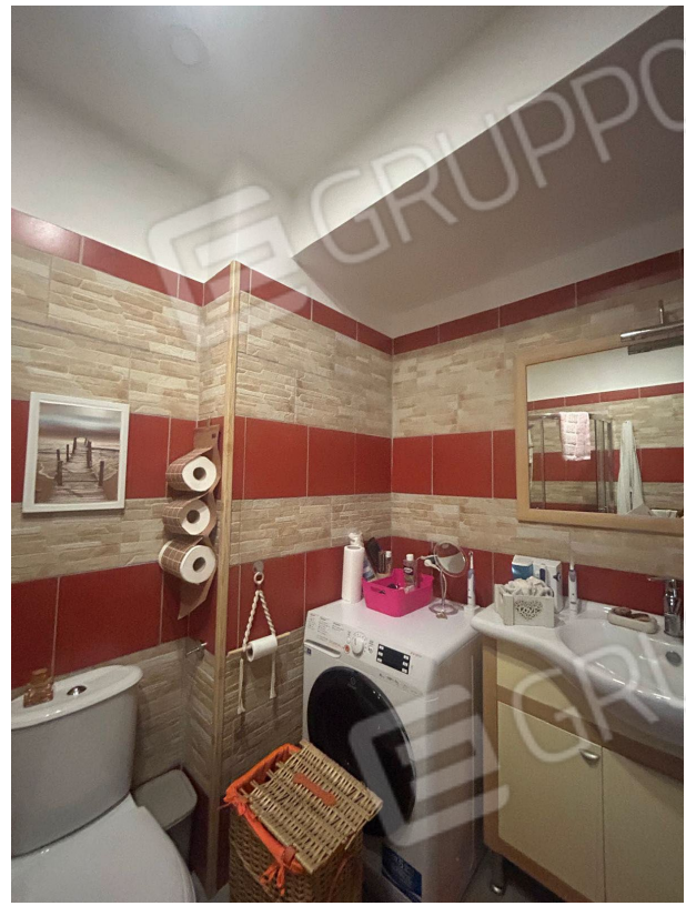
Figura 8 - Bagno