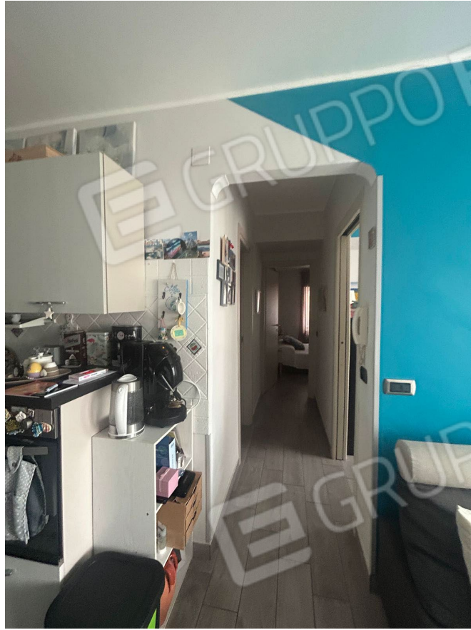
Figura 6 – Corridoio