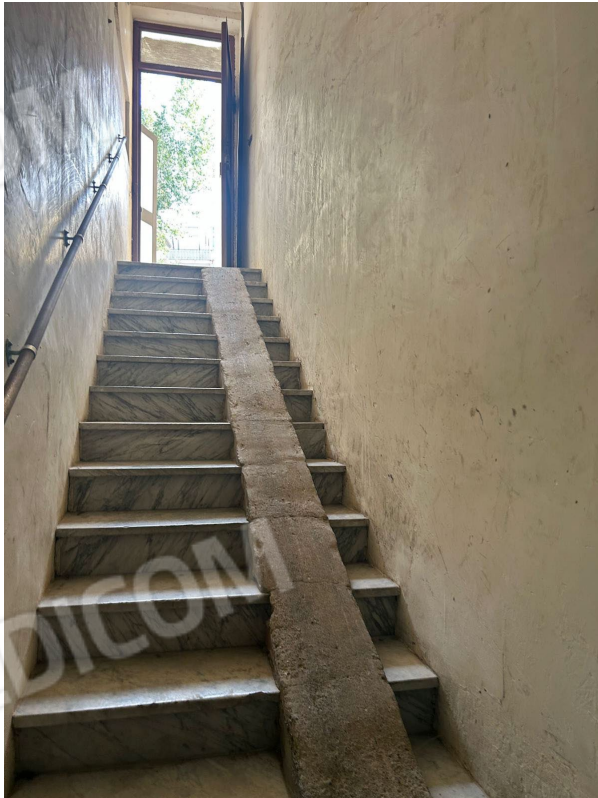
Figura 11 - Scala di accesso alle cantine