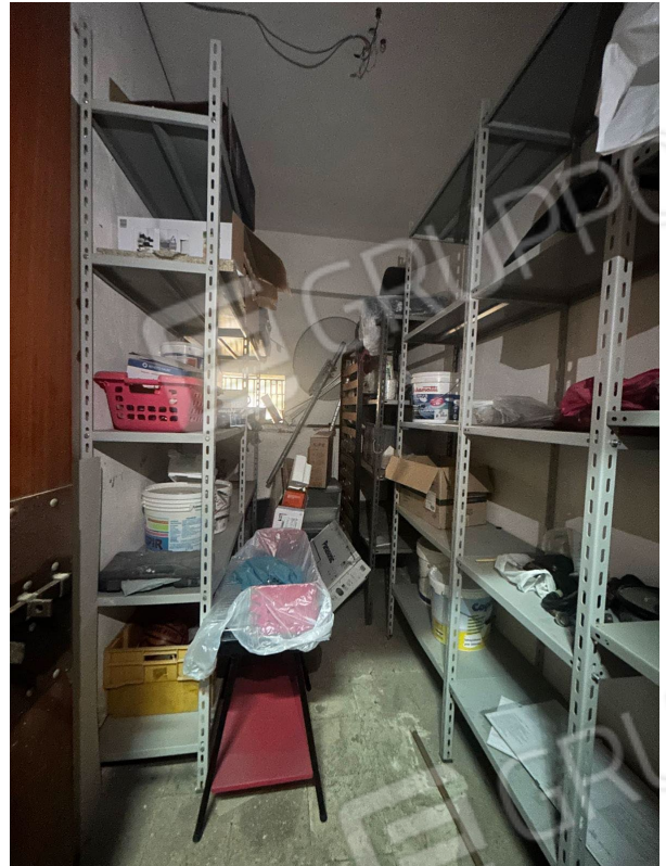
Figura 12 - Cantina