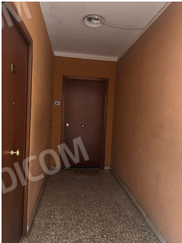
Figura 2 - Ingresso appartamento