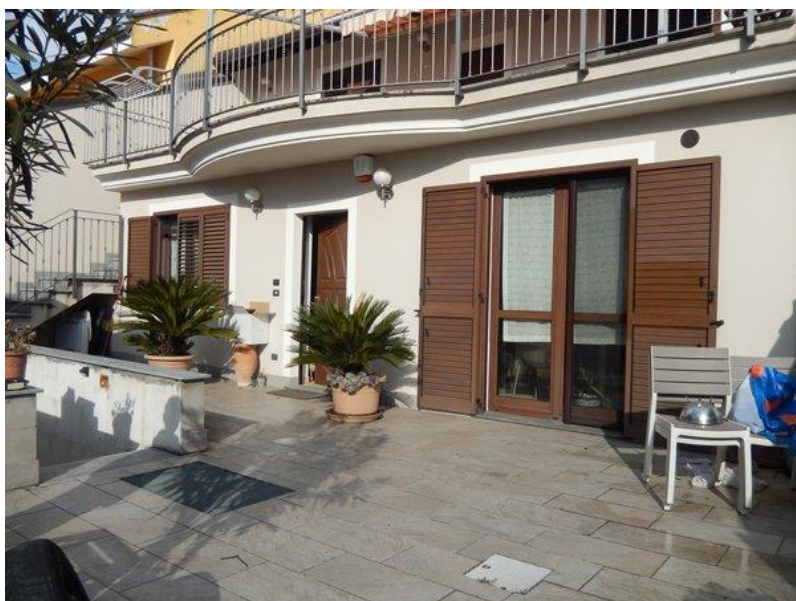
Vista esterna immobile