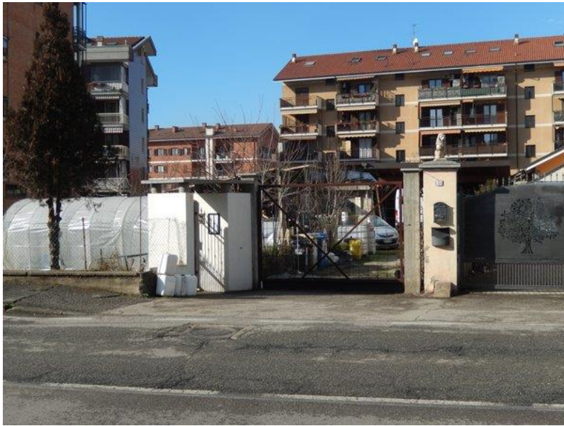
Accesso immobile carraio e pedonale