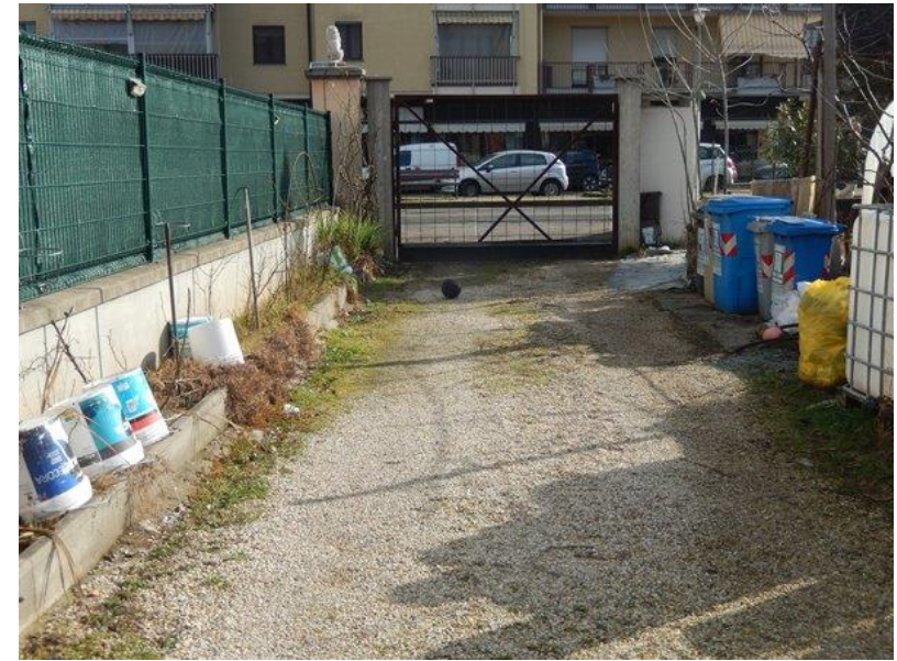
Viale di accesso immobile