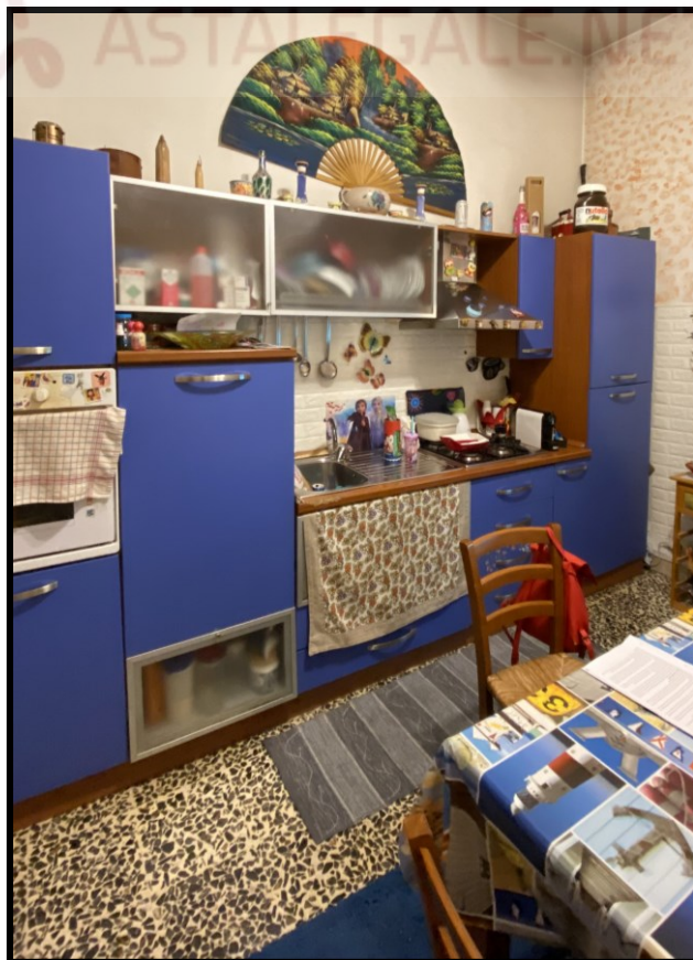
FOTO 4 - Cucina

Documentazione fotografica E.I. n.85/2022 – Tribunale di Ragusa