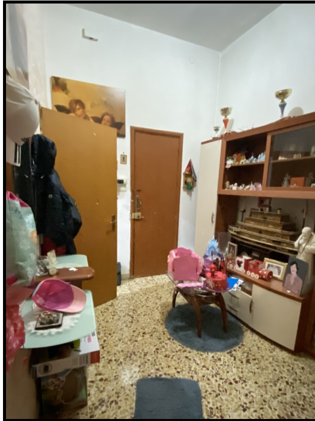
FOTO 3 - ingresso