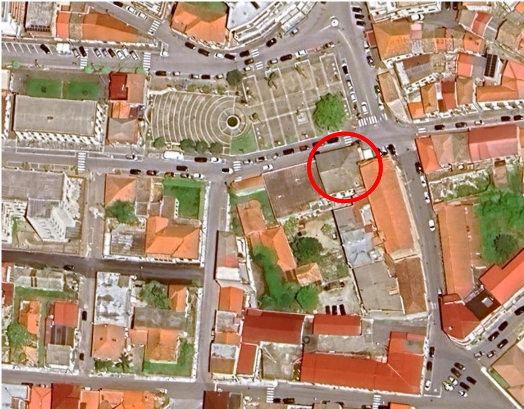
Figura 22 - Inquadramento territoriale

L'u.i. di nostro interesse è localizzata nel centro storico adiacente la chiesa del Santissimo Rosario, nella prestigiosa Piazza Italia.