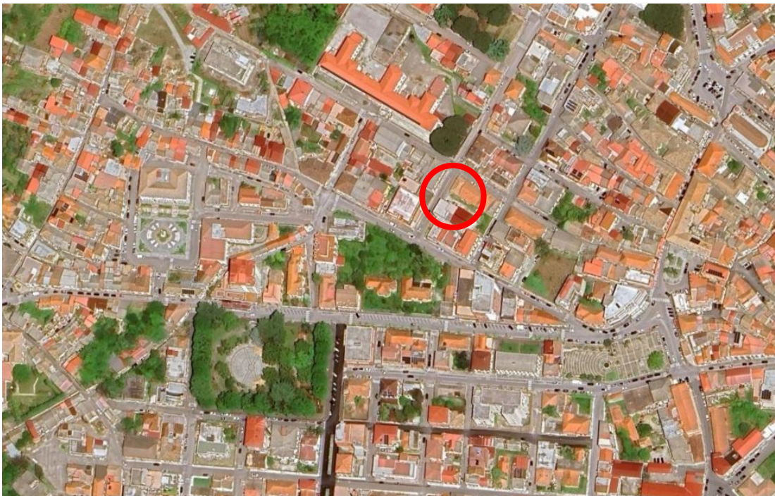
Figura 1 - Inquadramento territoriale

L'immobile si colloca nel comune di Taurianova (RC).