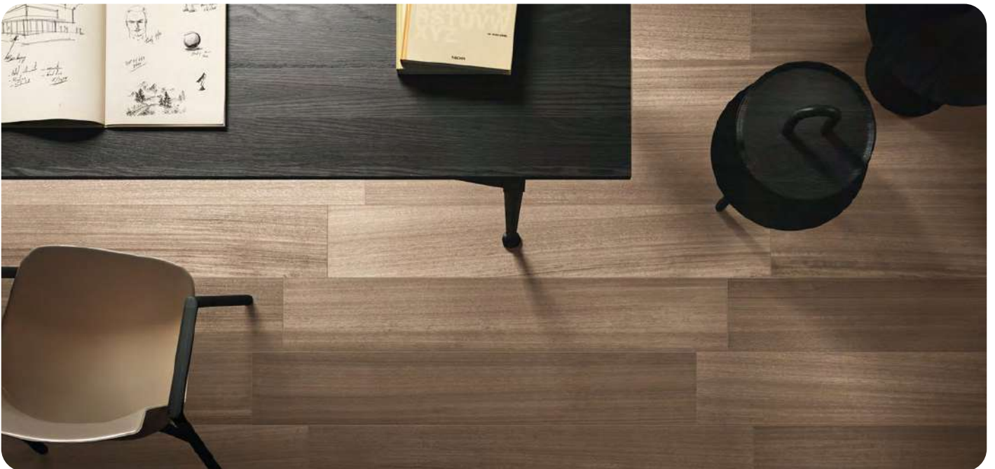
KOALA effetto legno 20x120