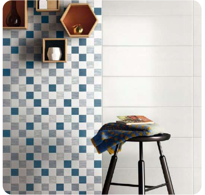
PLAY effetto decorativo 20x60