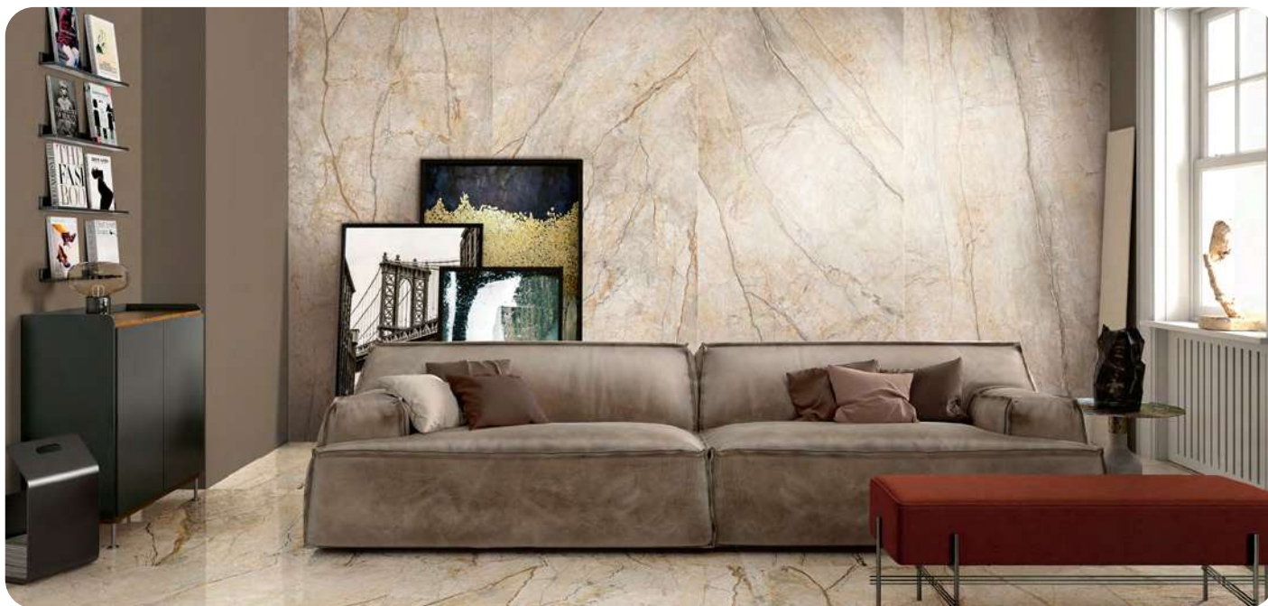
THE ROOM SAN PE6