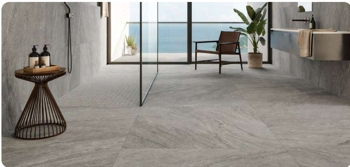
VIBES effetto pietra 90x90