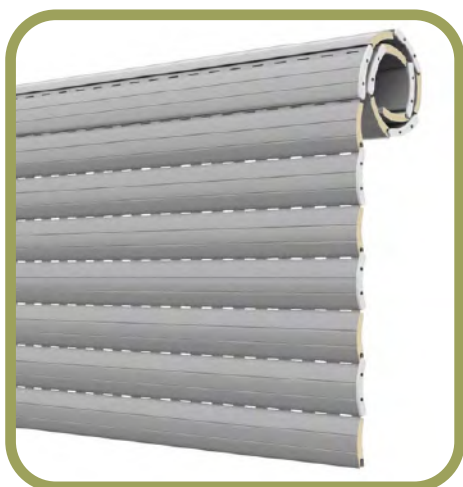
TAPPARELLE MOTORIZZATE IN ALLUMINIO