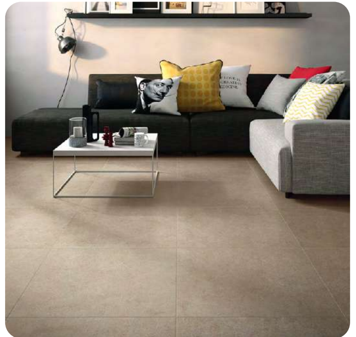
WALK effetto pietra 60x60