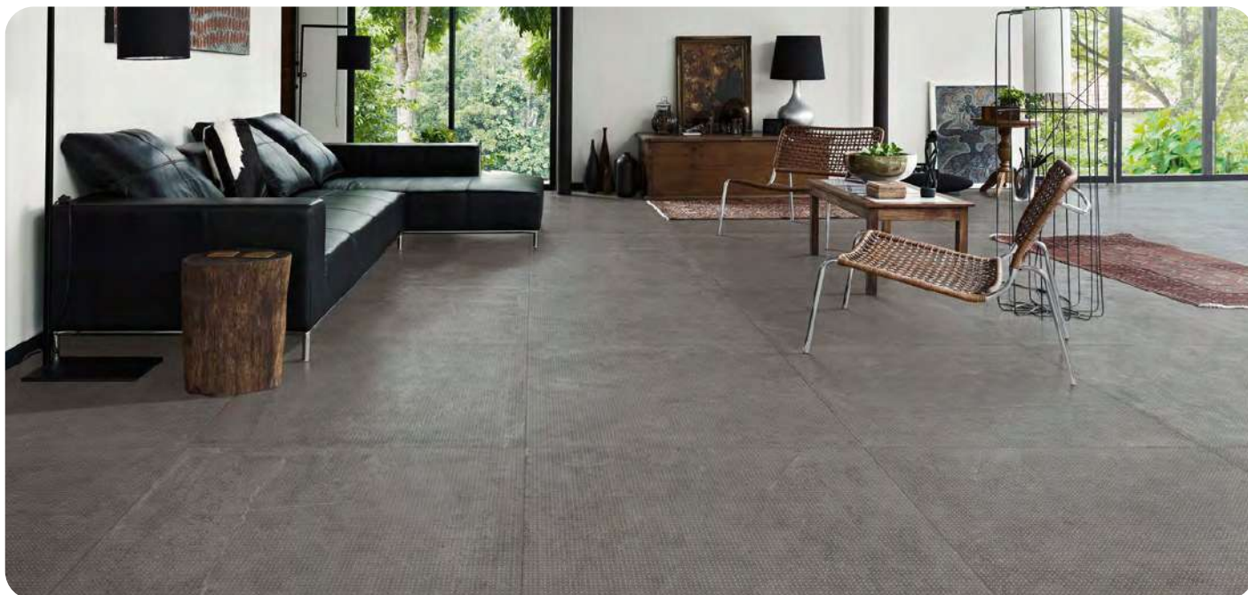
STONECRETE effetto pietra 90x90