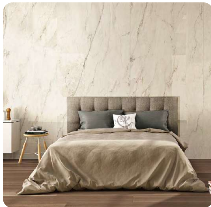
THE ROOM CRE DL6