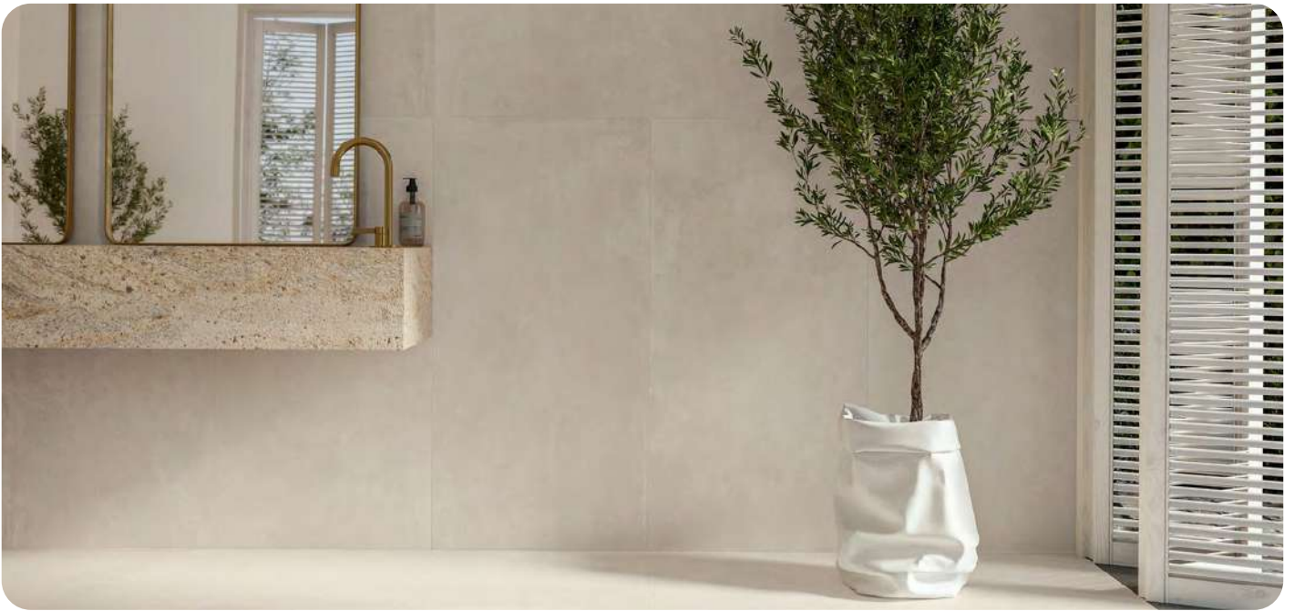
AZUMA UP SP 6,5 effetto cemento 60x120