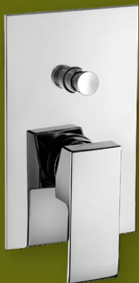
PAFFONI Elle - Effe EL015/EF015