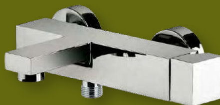
PAFFONI Elle - Effe EL022/EF022