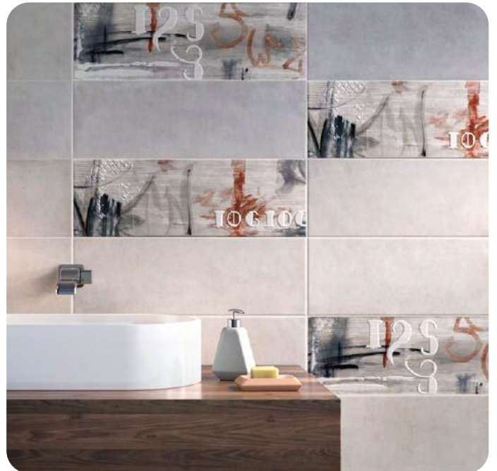
RIVERSIDE effetto decorativo 20x60