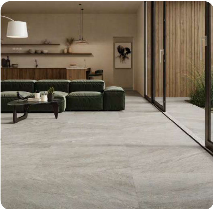
VIBES effetto pietra 60x60