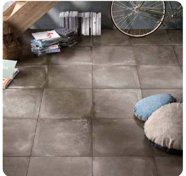
RIVERSIDE effetto cemento 60x60