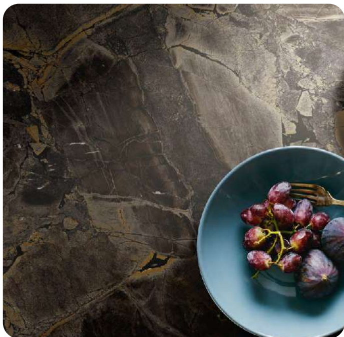
THE ROOM INF BR6