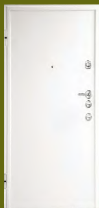
DIERRE Tablet 8 plus interno

Le porte interne alle unità immobiliari saranno a battente realizzate con un'anta cieca in legno tamburato della marca VILLARE linea Pandora e Lexi , come da campionatura in cantiere, complete di maniglia tipo KIS finitura satinata.