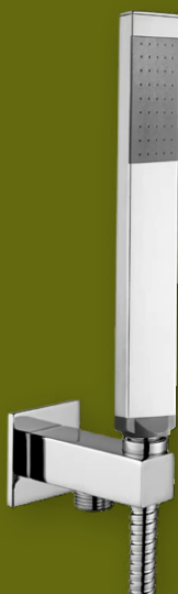
PAFFONI Shower Heads ZDUP095