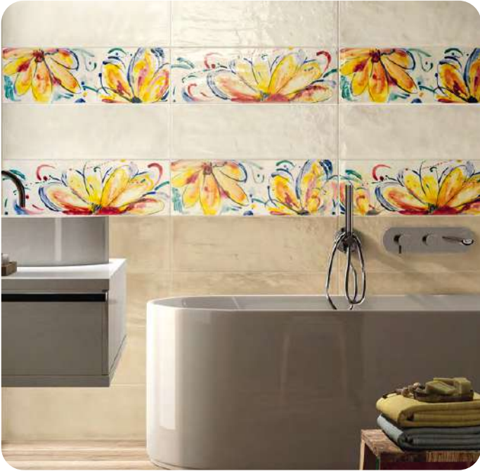
SHADES effetto decorativo 20x60