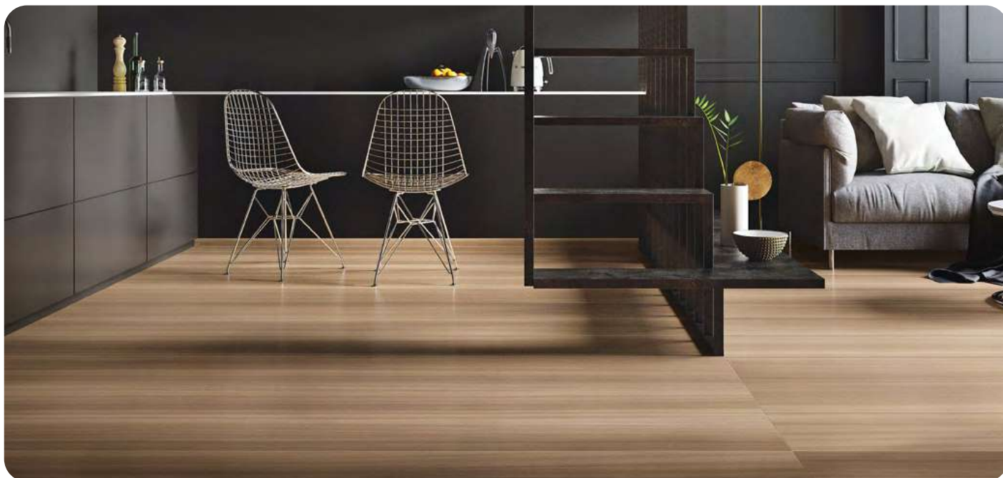
KOALA effetto legno 20x120 / 20x180