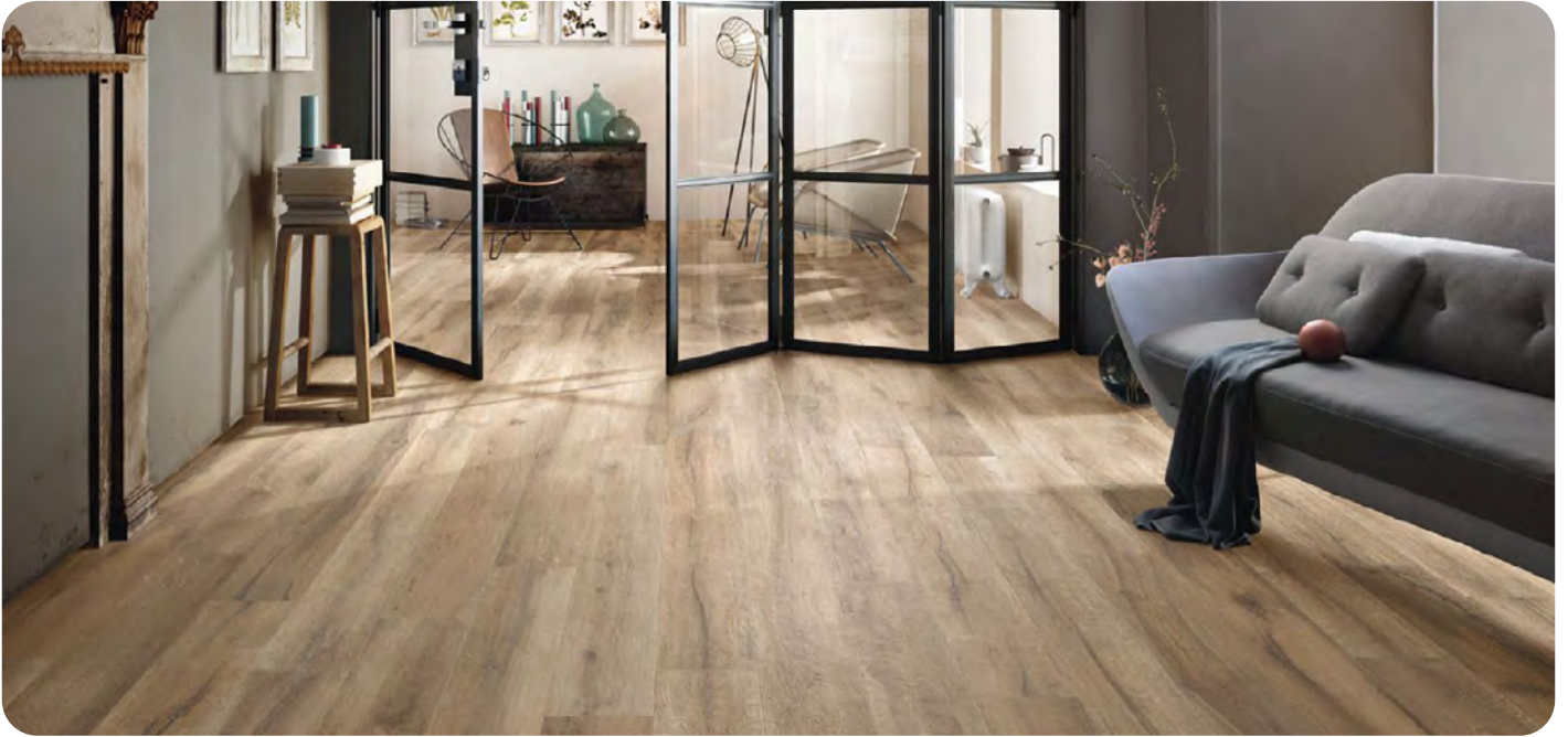
KUNI effetto legno 20x120