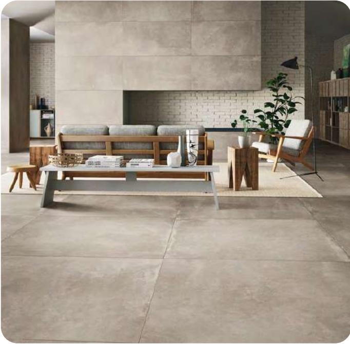
AZUMA effetto cemento 90x90