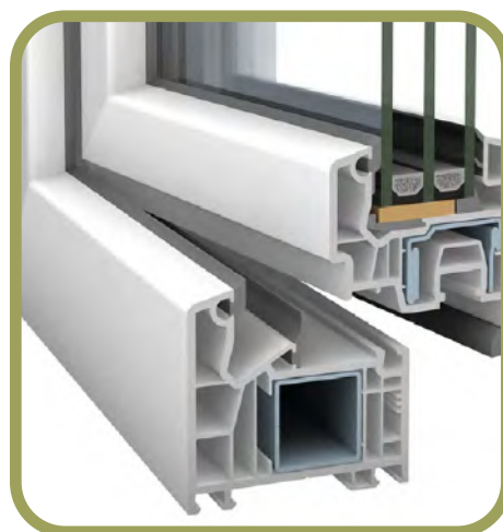
SERRAMENTI PVC COLORE BIANCO