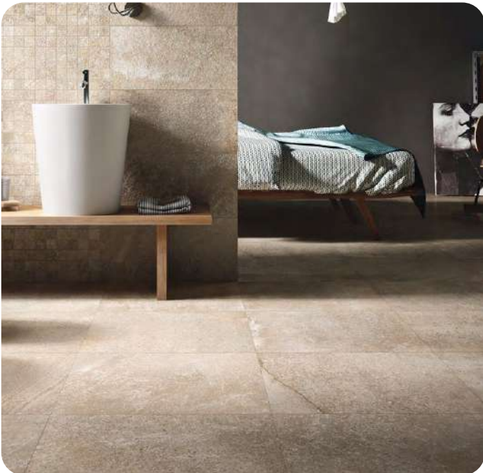
BRIXSTONE effetto pietra 60x60