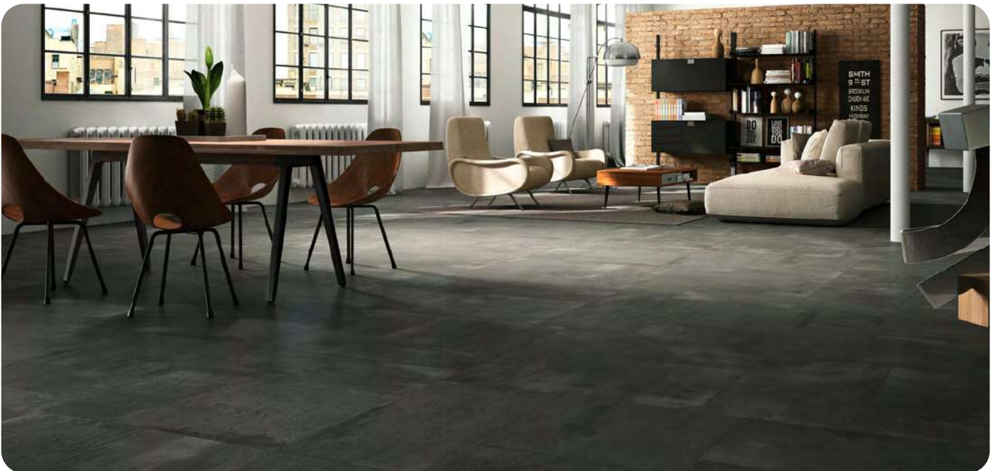
CREATIVE CONCRETE effetto cemento 90x90