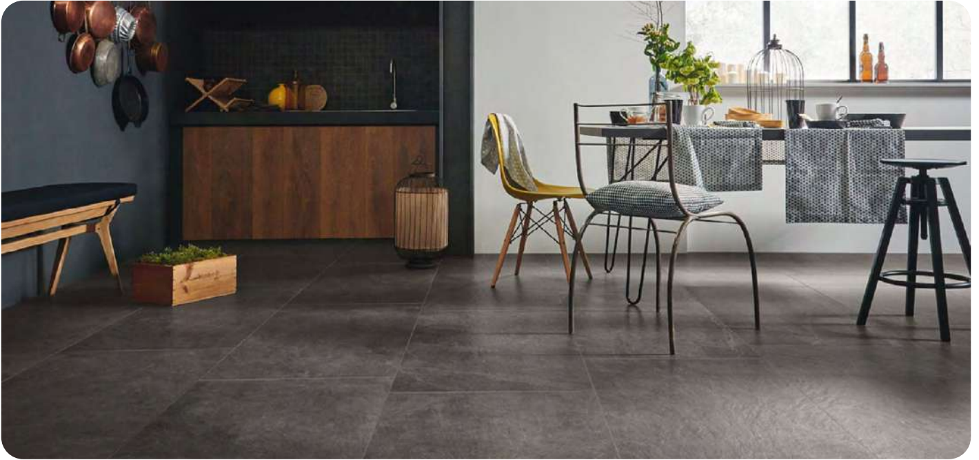
X-ROCK effetto pietra 60x60