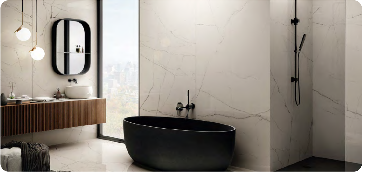
THE ROOM STA VP6 effetto marmo 60x120