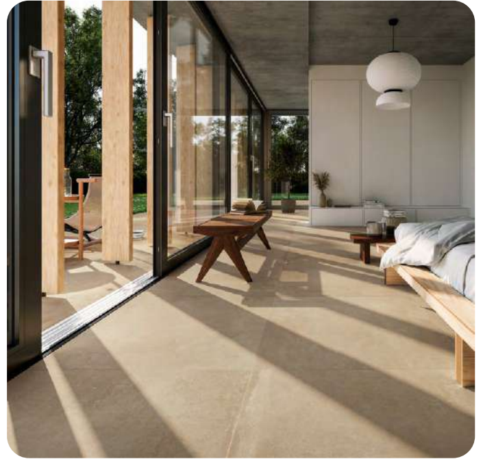
AZUMA UP effetto cemento 60x60