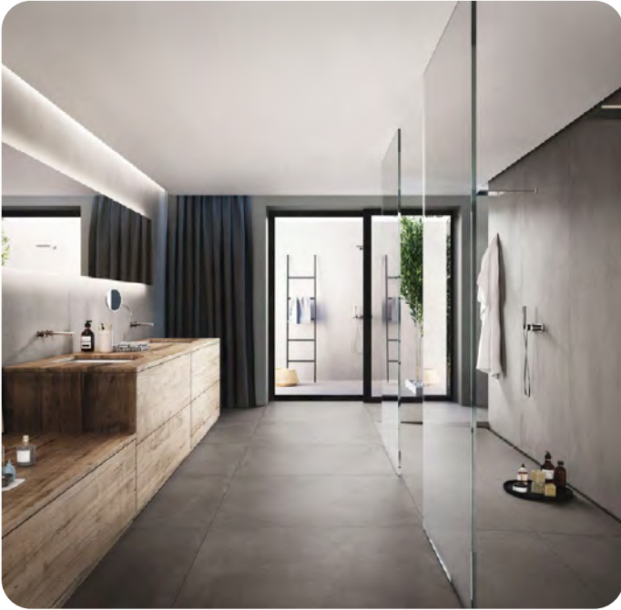
AZUMA effetto cemento 60x60