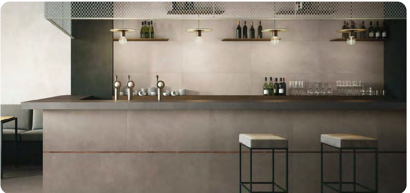
AZUMA SP 6,5 effetto cemento 60x120