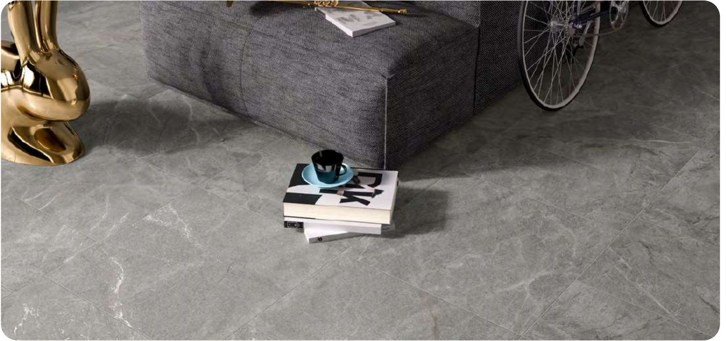
BLUE SAVOY effetto pietra 60x60