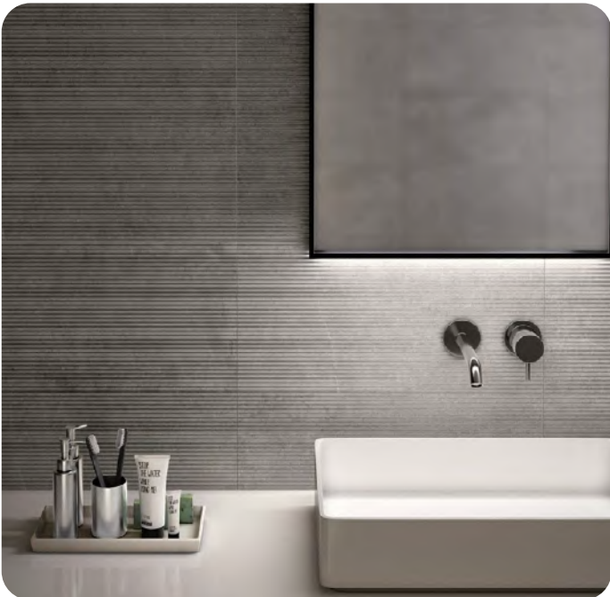
STONECRETE effetto pietra 30x60