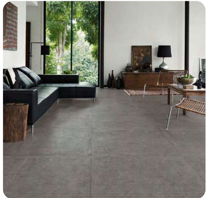
STONECRETE effetto pietra 60x60