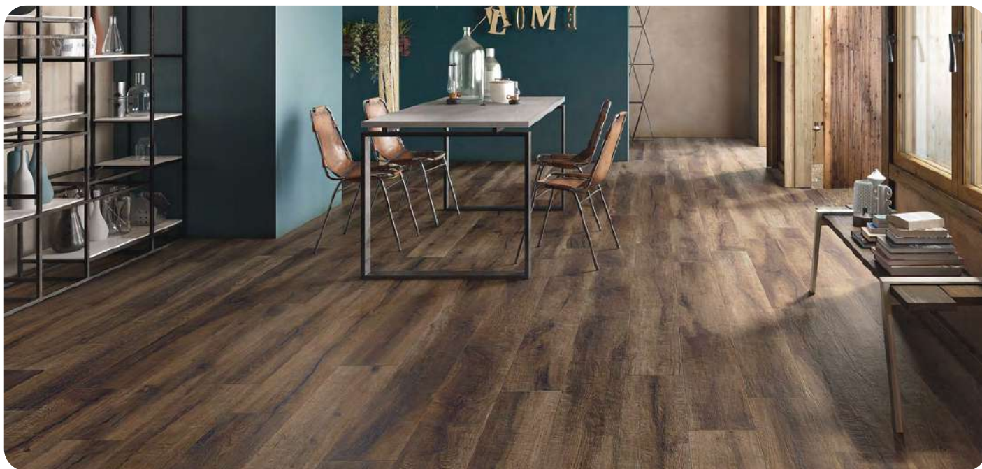
KUNI effetto legno 20x120 / 20x180