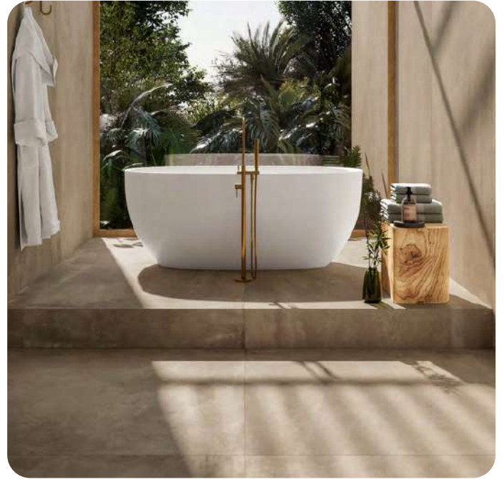
AZUMA UP effetto cemento 90x90