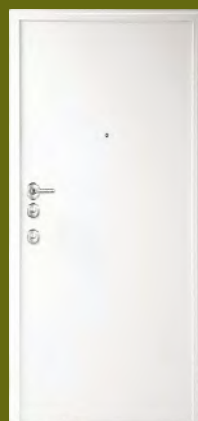
DIERRE Tablet 8 plus esterno