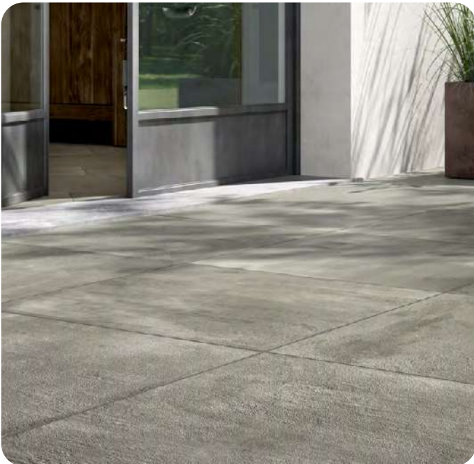
CREATIVE CONCRETE effetto cemento 60x60