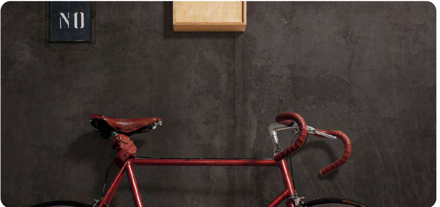
TUBE SP 6,5 effetto contemporaneo 60x120