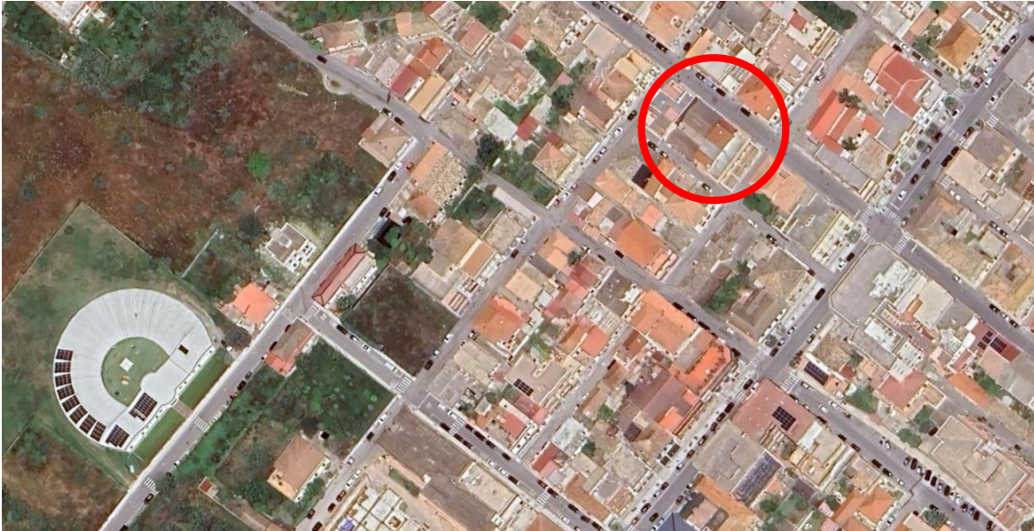
Figura 2 - Inquadramento territoriale

L'u.i. di nostro interesse è localizzata nel Comune di Locri con accesso in Via Palermo 12, nelle immediate vicinanze il Lungomare Di Locri circa 500 metri.