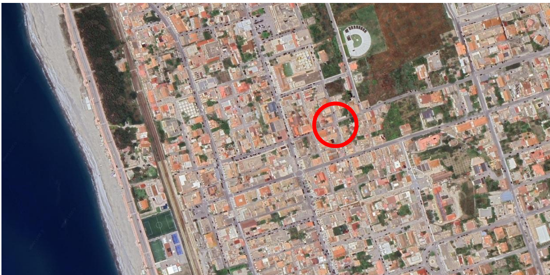
Figura 1 - Inquadramento territoriale

L'immobile si colloca nel comune di Locri, in provincia di Reggio Calabria (RC), da cui dista circa 110 Km