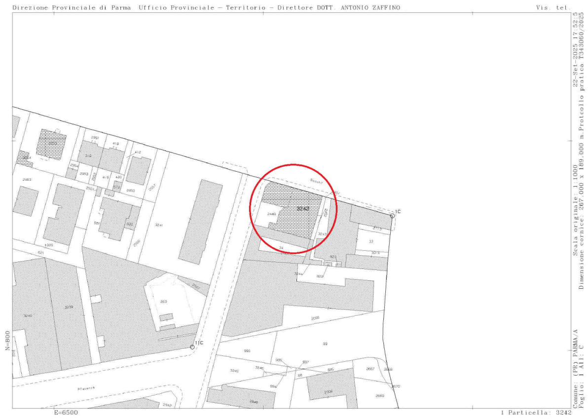
Figura 1 – ESTRATTO DI MAPPA

Di seguito si riporta l'estratto di mappa non in scala.