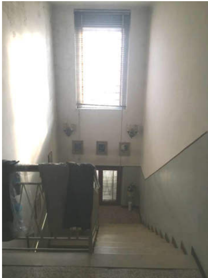
Altra vista della scala