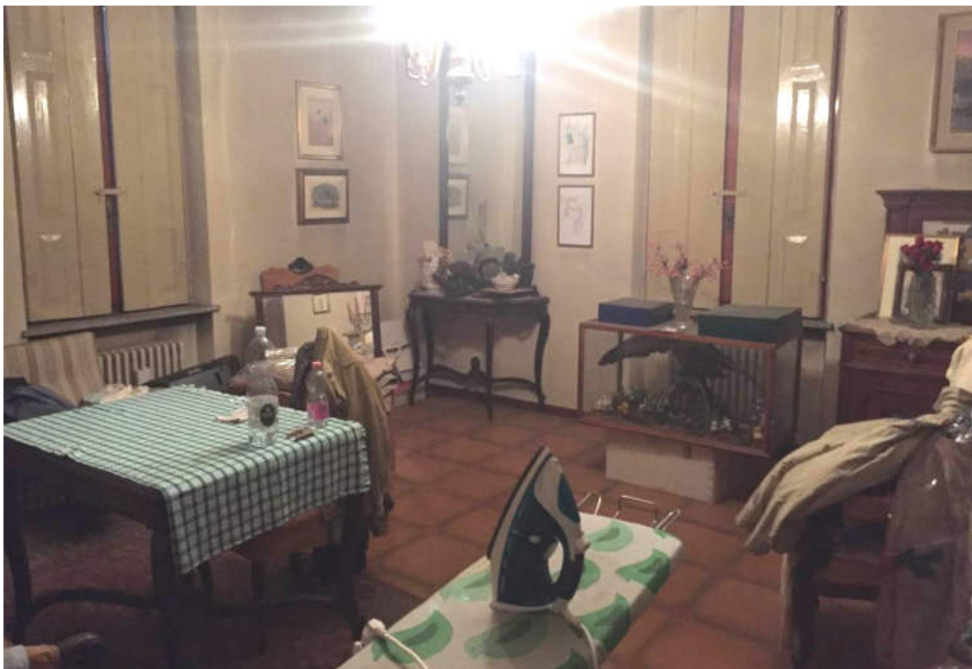
Sala pranzo dell'abitazione