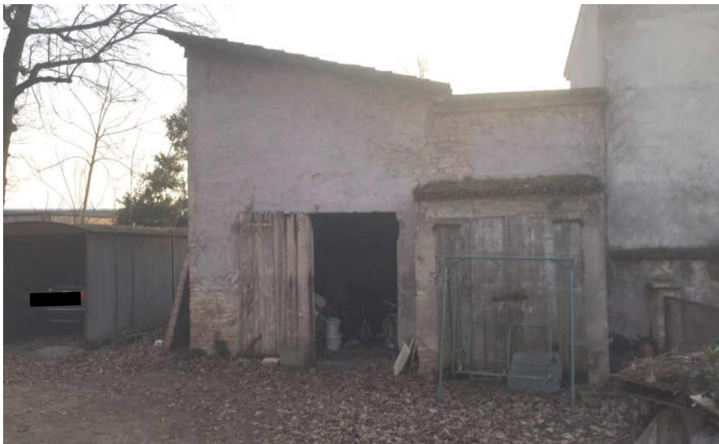
Vista Est dell'accessorio esterno che contiene le cantine