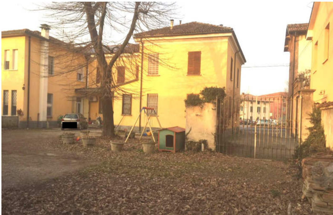
Prospettiva Sud dell'abitazione, vista da altra angolazione, e cancello carraio di ingresso