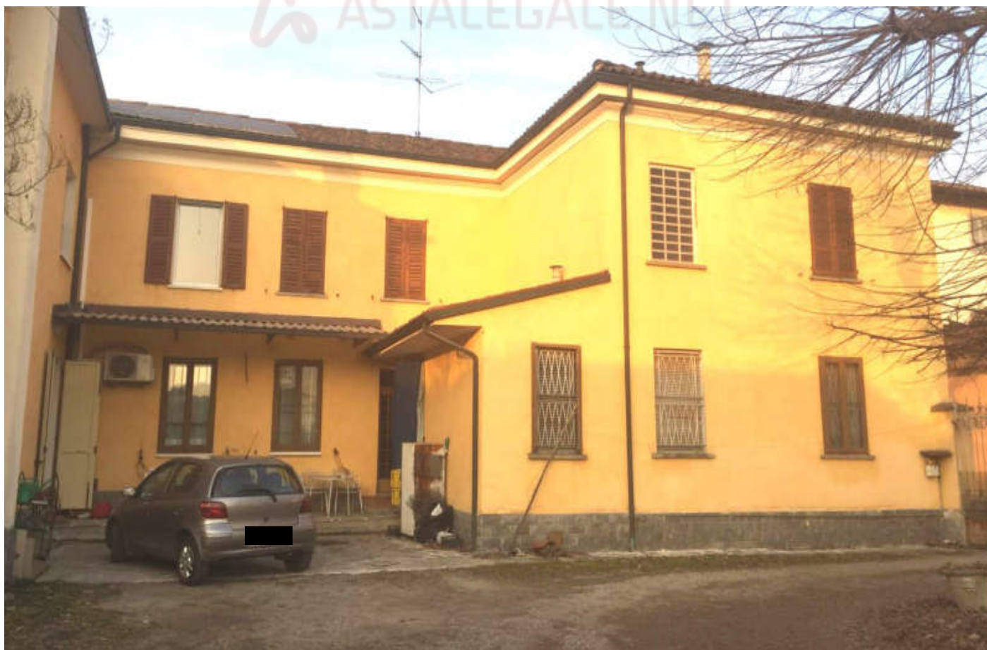
Prospetto Sud dell'abitazione in oggetto, dal cortile interno