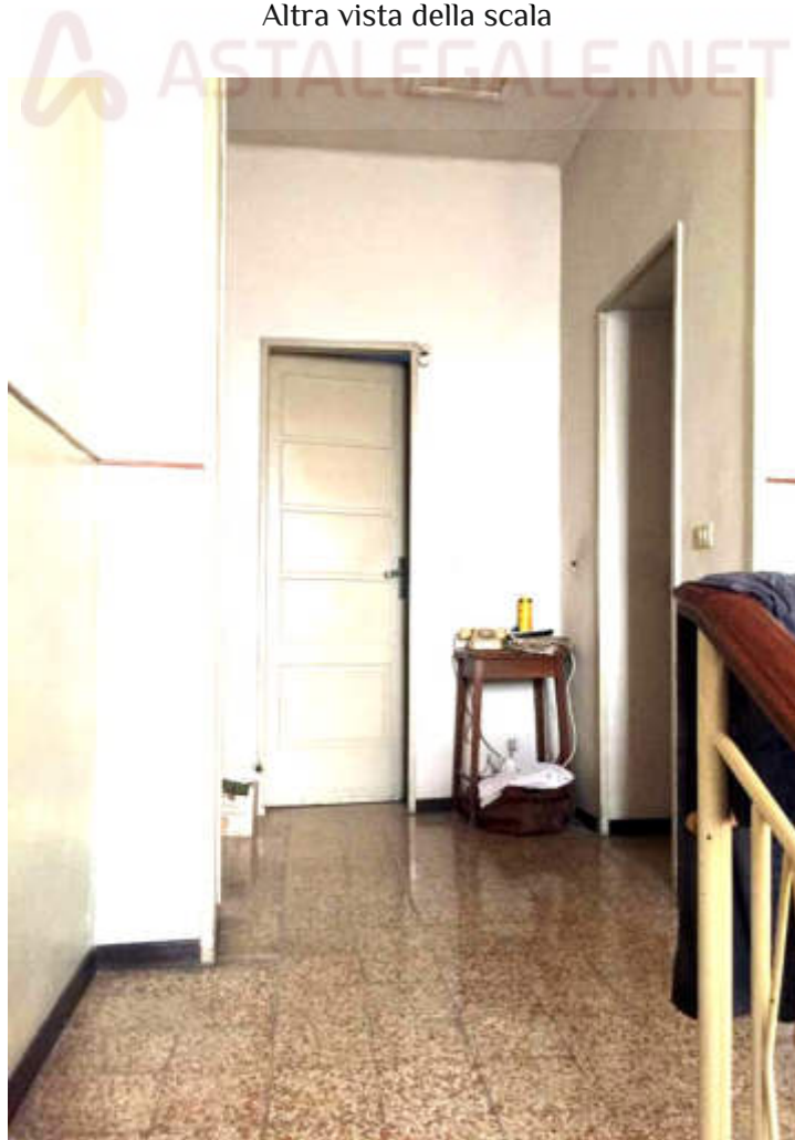
Disimpegno al piano primo