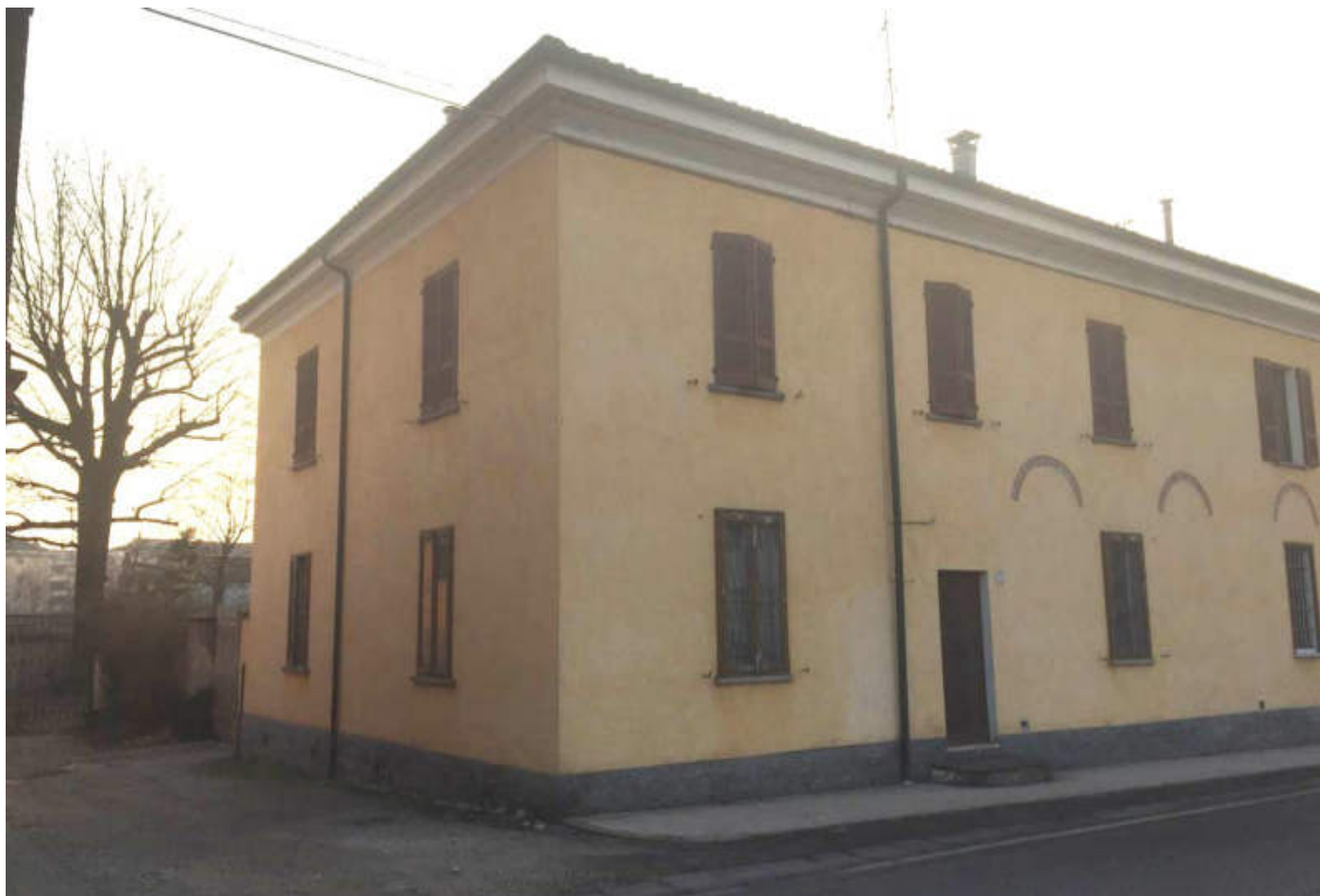
Angolo Nord-Est dell'abitazione in oggetto, da via XI Febbraio