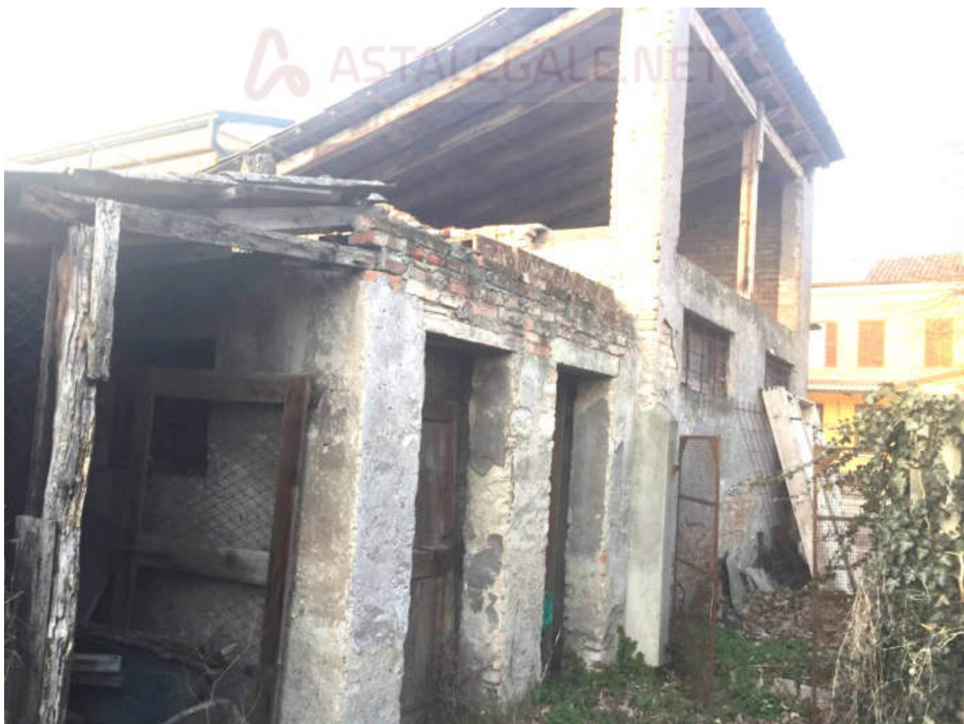
Vista generale dell'accessorio esterno che contiene cantine e box