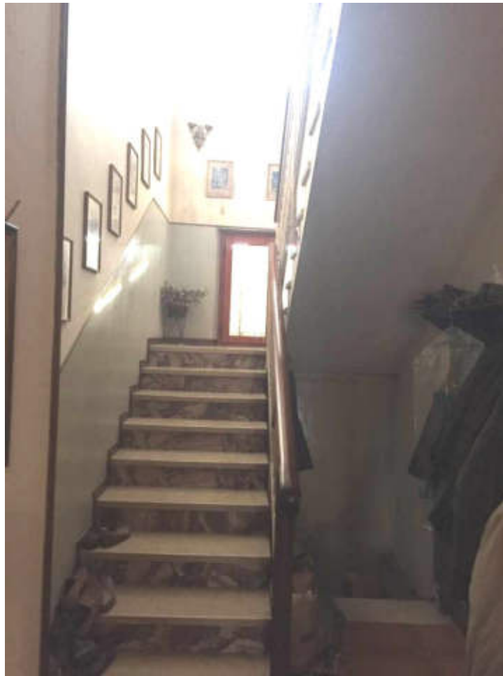
Scala di accesso al piano primo