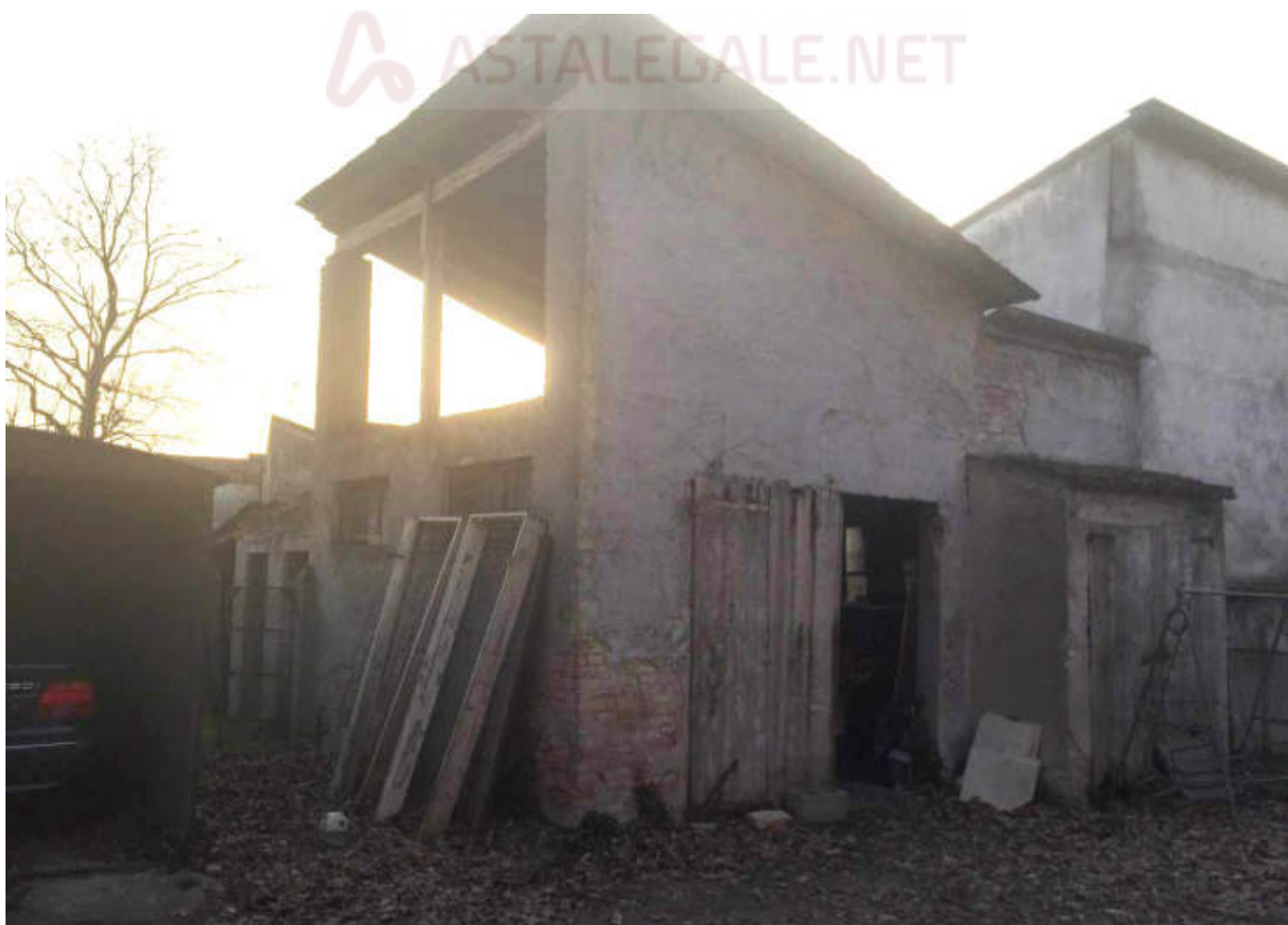
Vista Sud dell'accessorio esterno che contiene le cantine