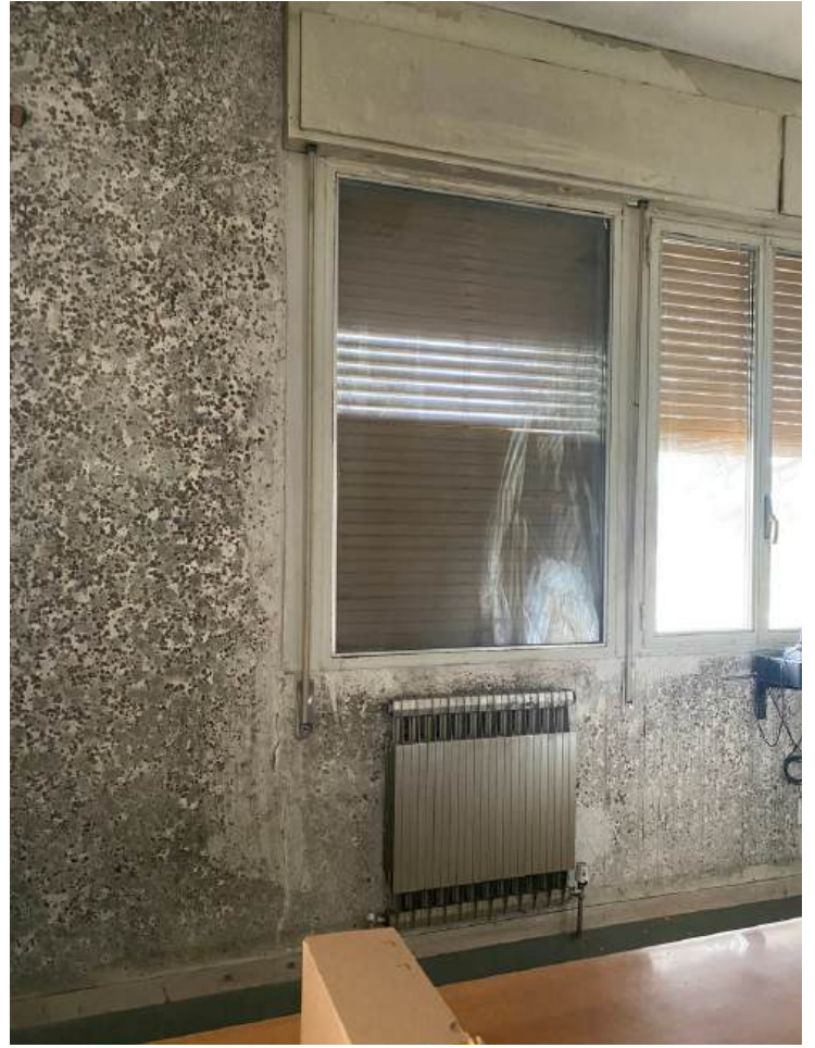
Locali colpiti dagli ultimi episodi alluvionali