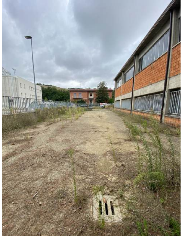
Piazzale adibito a parcheggio