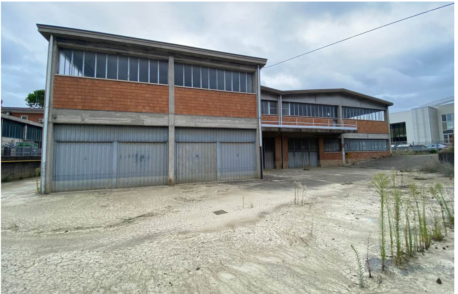
Piazzale retrostante con zona per carico scarico