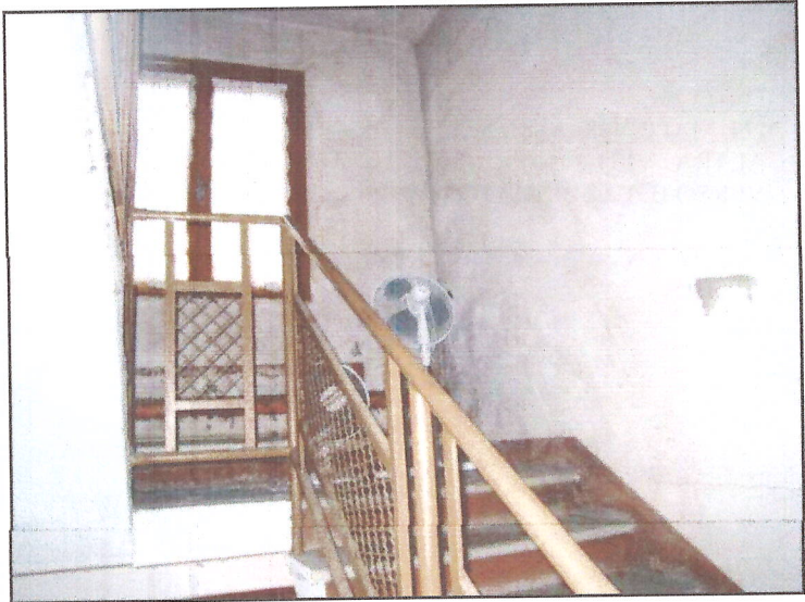
FOTO 32 VISTA DAL VANO SCALA COMUNE VERSO INGRESSO AL SOTTOTETTO.