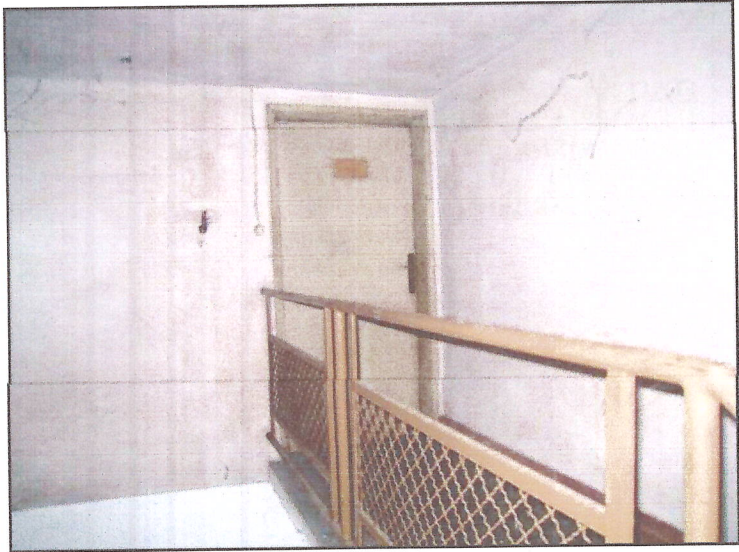
FOTO 33 VISTA PORZIONE COMUNE DEL SOTTOTETTO ENTRANDO.