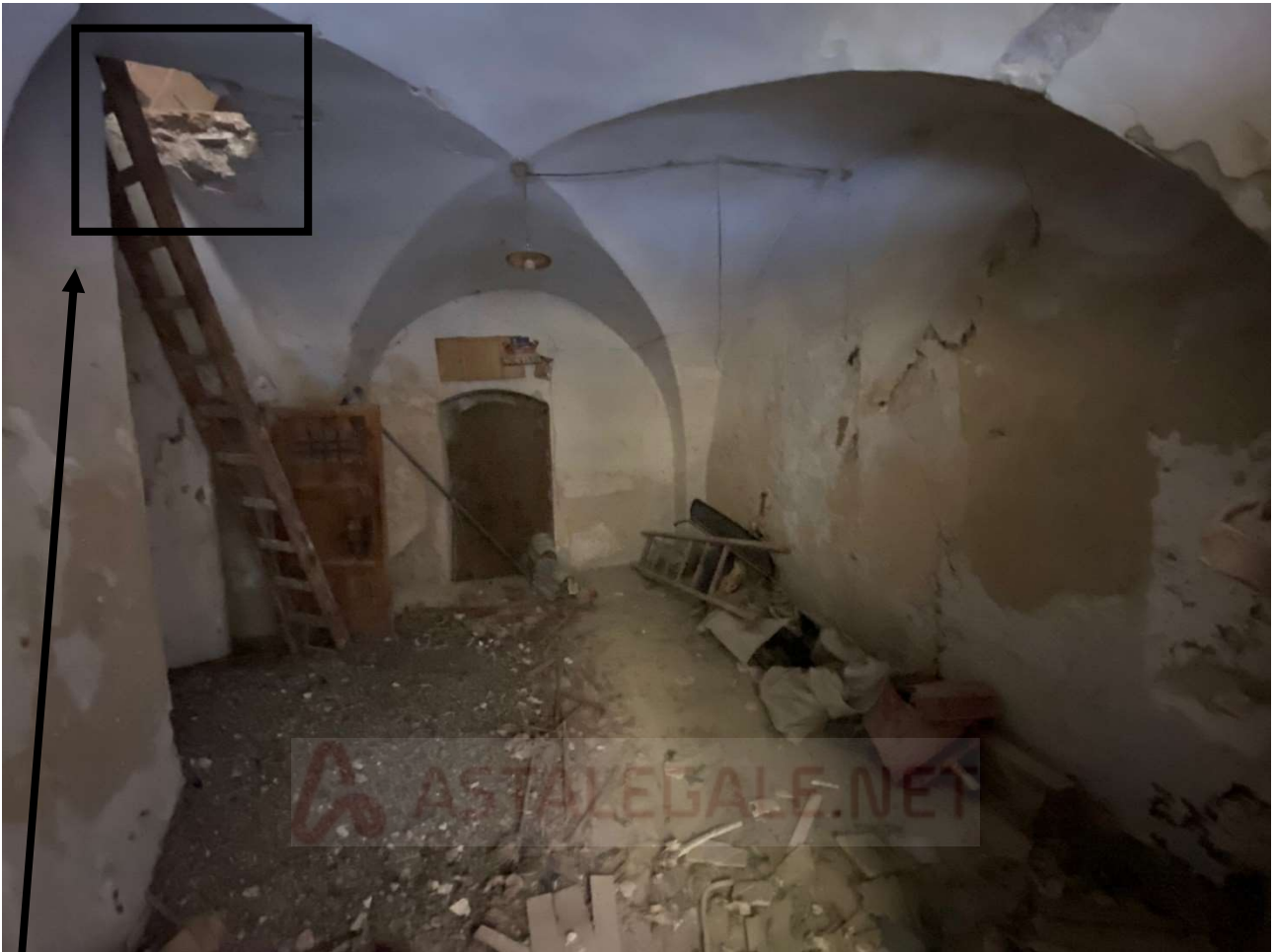
Porzione di solaio crollato, da cui si accede al Piano Primo (tramite scala in legno)