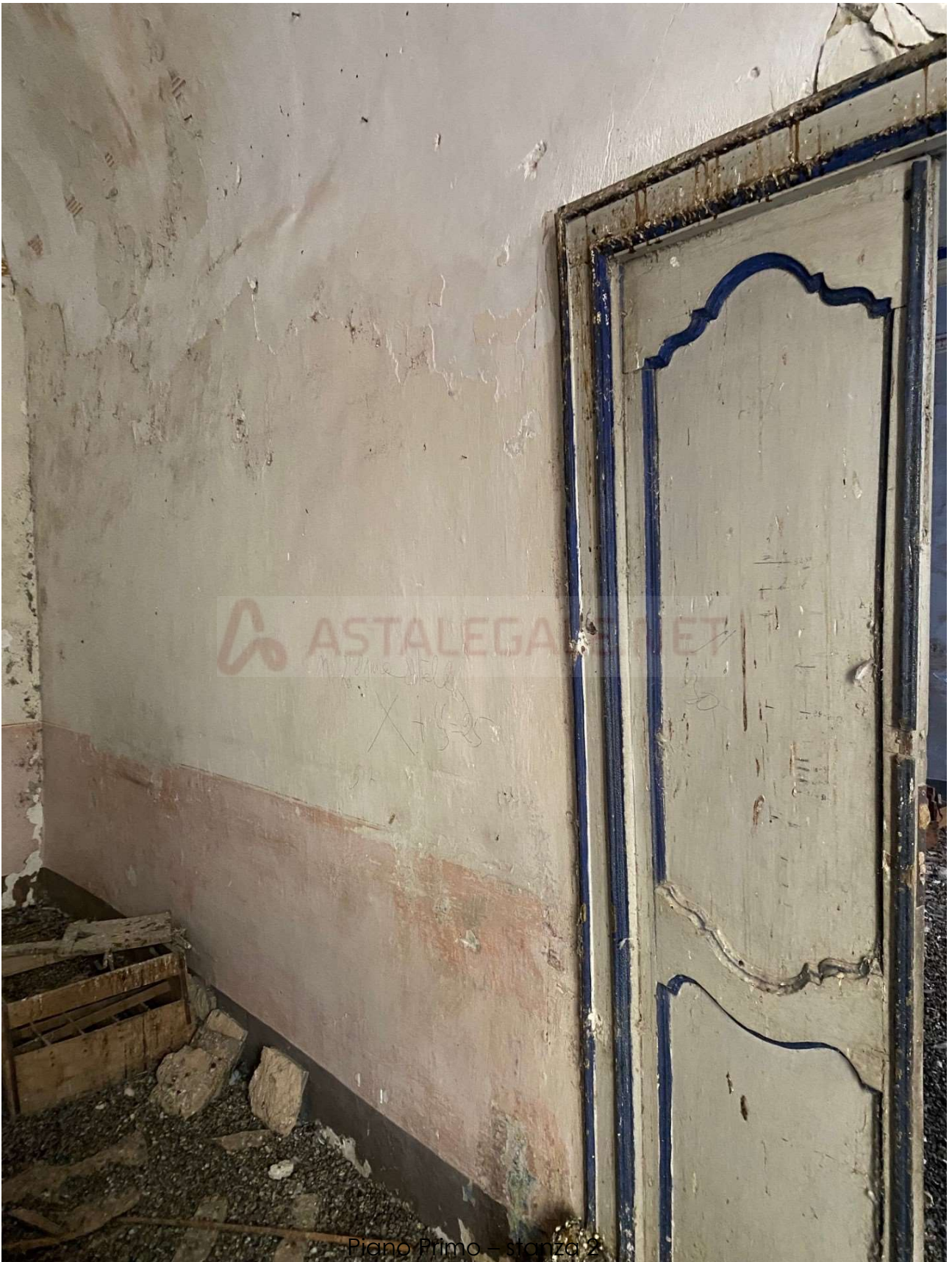
Piano Primo – stanza 2