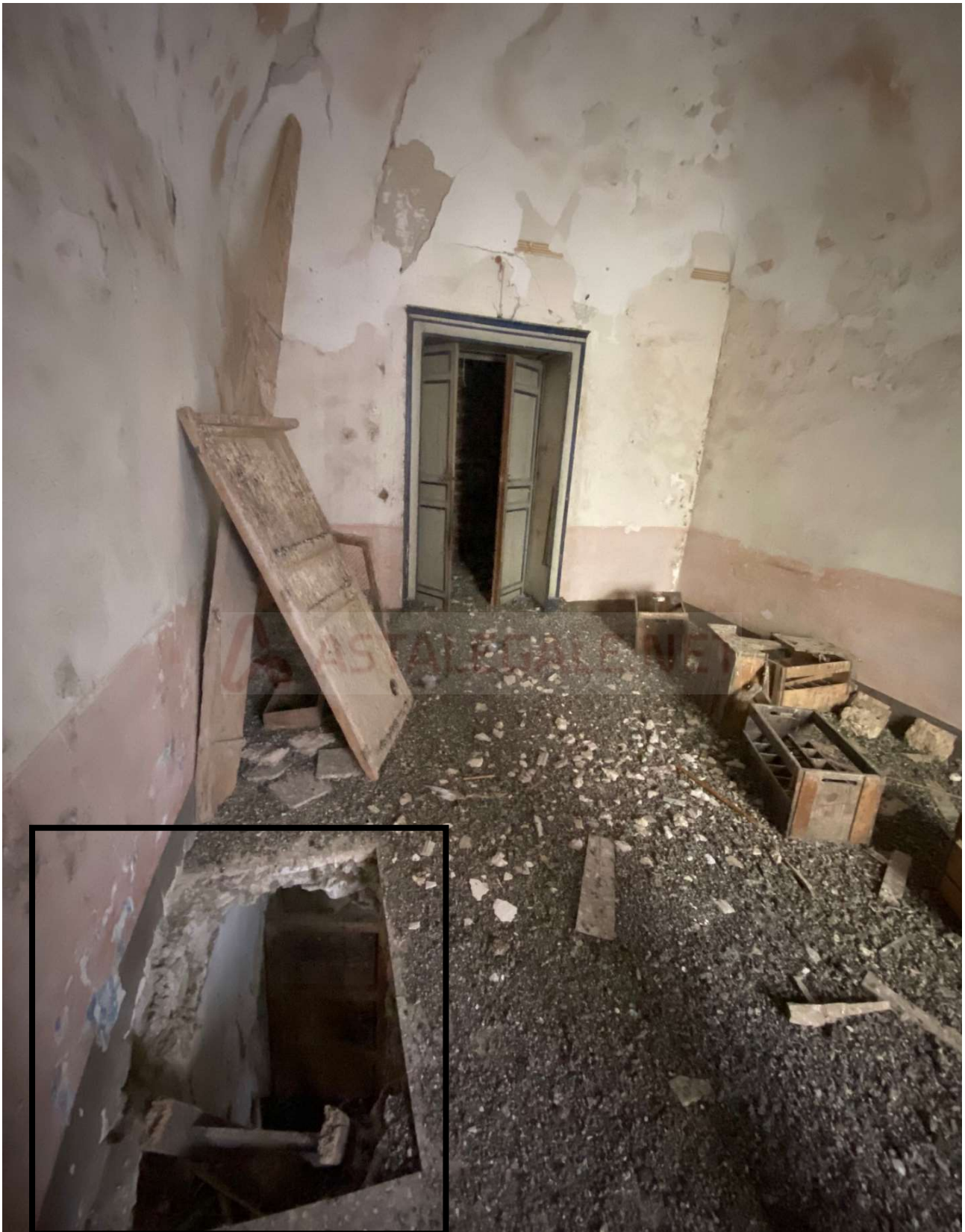
Porzione di solaio crollato, da cui si accede al Piano Primo (tramite scala in legno)