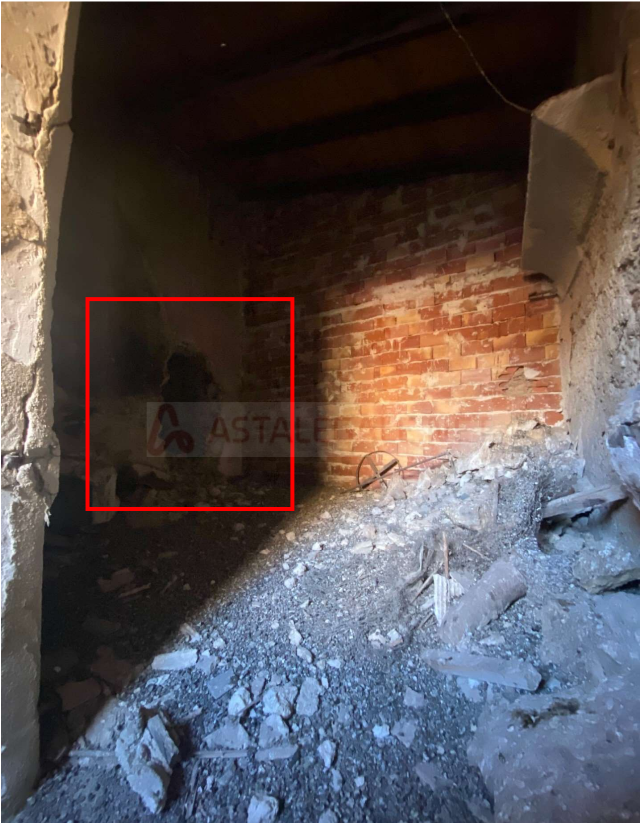
Sbarramento fisico al prosieguo delle operazioni peritali nel piano secondo