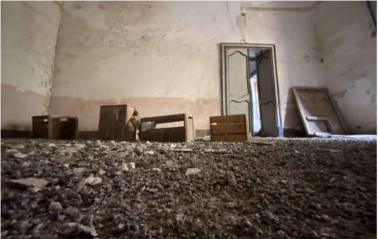
guano di volatili a pavimento e patologie di degrado della struttura