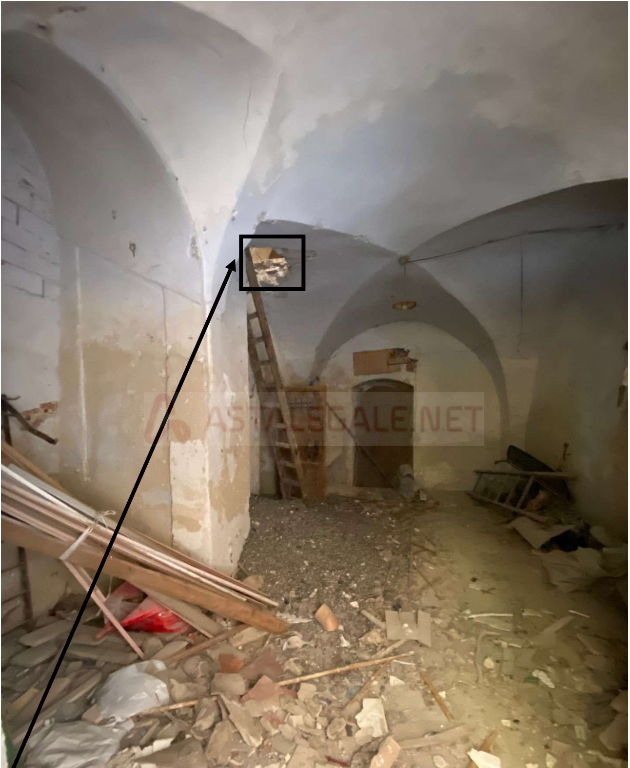
Porzione di solaio crollato, da cui si accede al Piano Primo (tramite scala in legno)