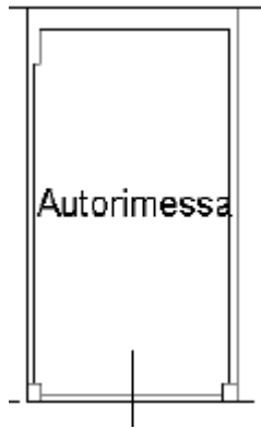
Autorimessa: Planimetria (fuori scala)