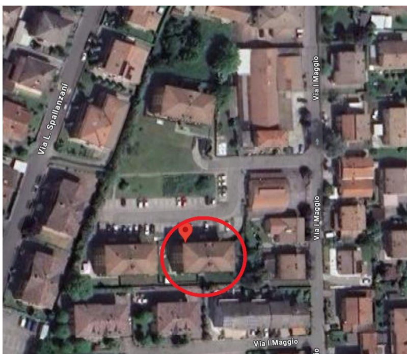
Vista Aerea ed Esterna

Piena proprietà di appartamento con garage in Via Primo Maggio 14/5 a Cadelbosco di Sopra (RE)